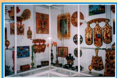
Роспись по дереву