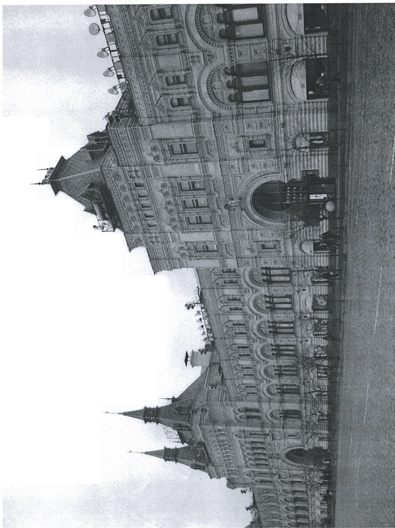
ВЕРХНИЕ ТОРГОВЫЕ РЯДЫ (ГУМ)