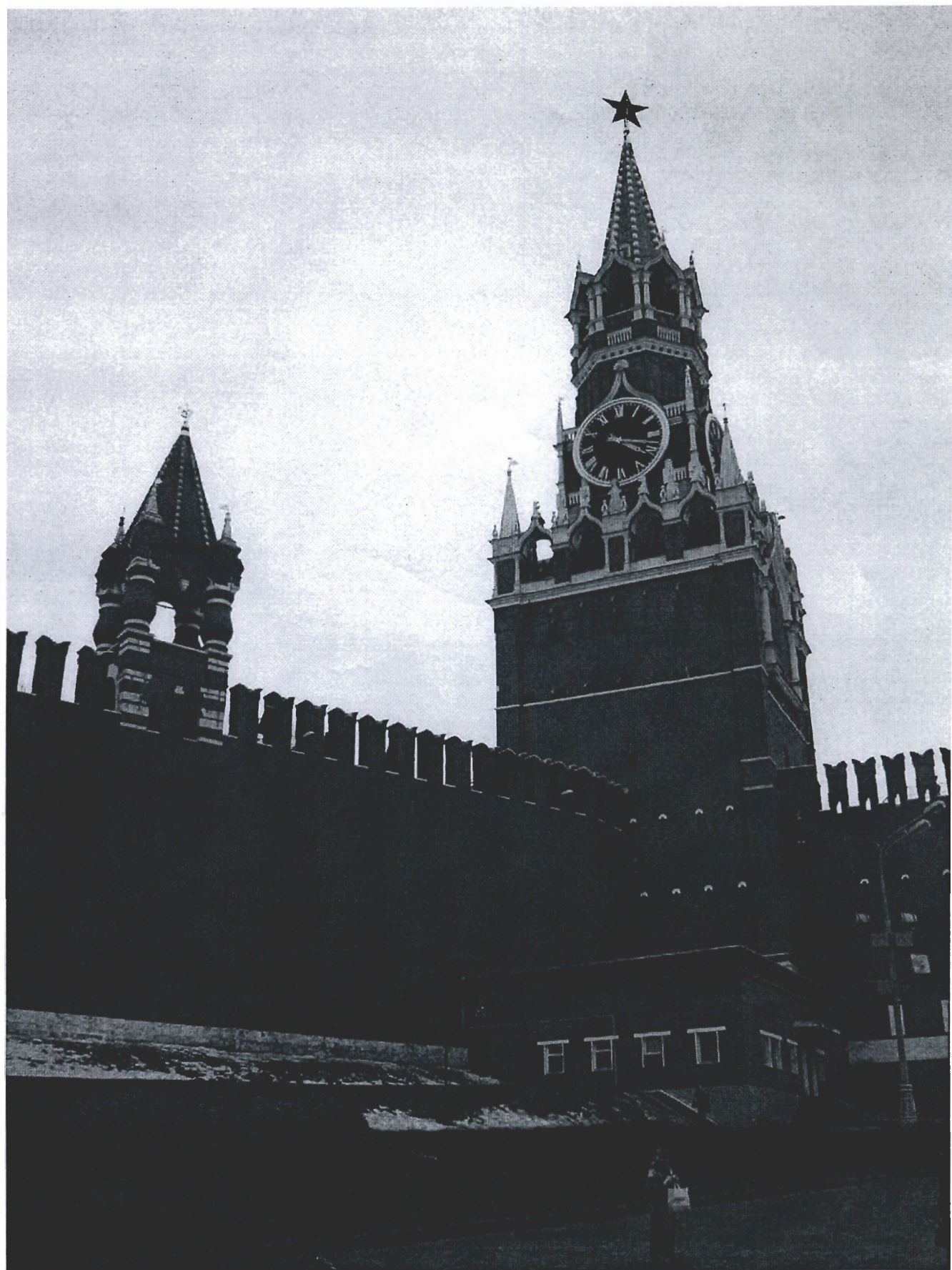
СПАССКАЯ (ФРОЛОВСКАЯ) и ЦАРСКАЯ (СМОТРИТЕЛЬНАЯ) БАШНИ