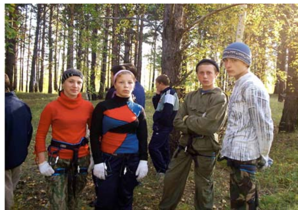
и перед туристической полосой