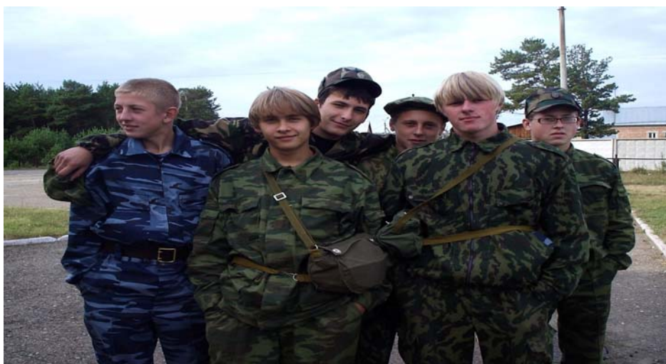
Команда допризывников нашей школы