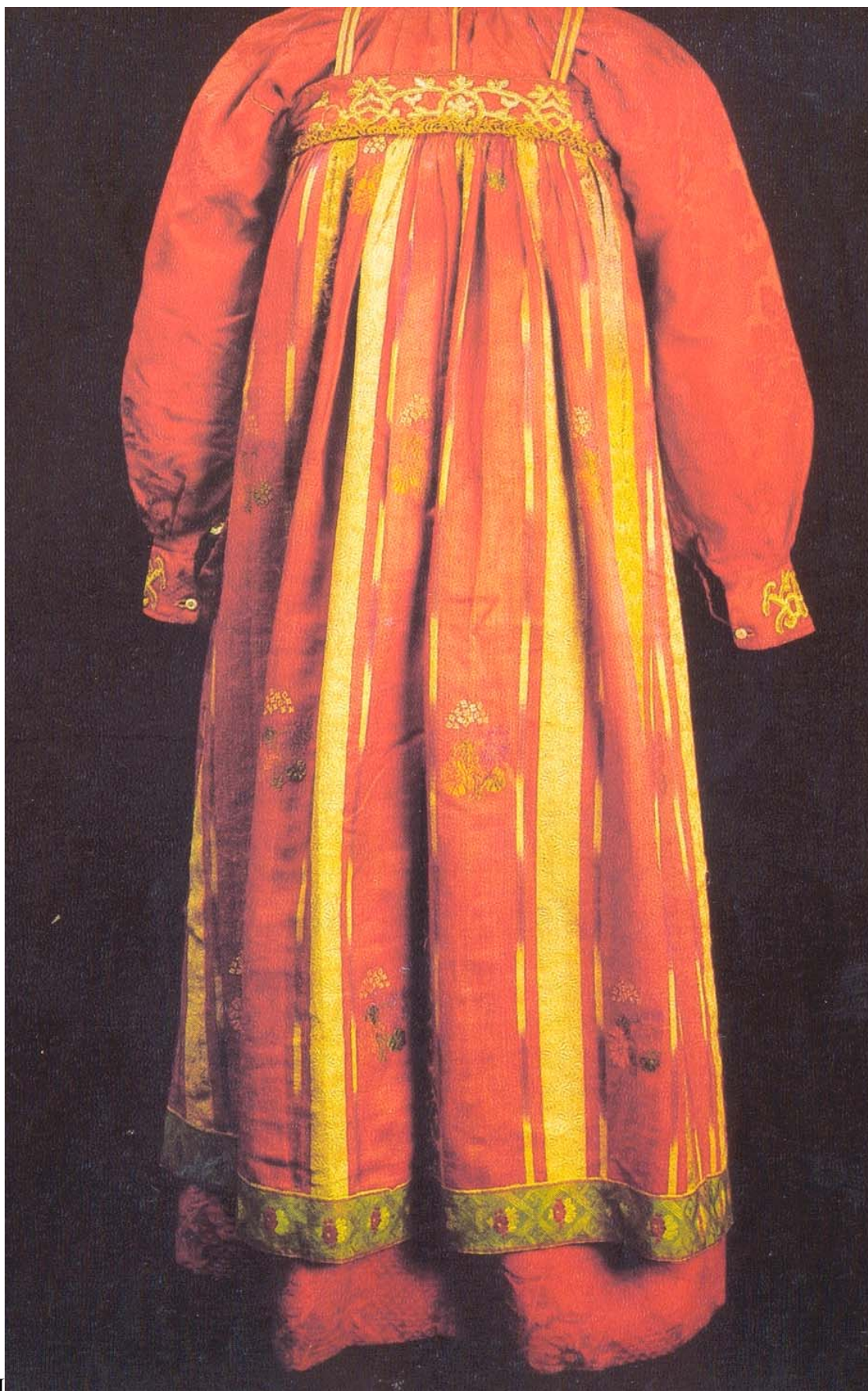
Праздничный костюм крестьянки Вологодской губернии. XIX век.