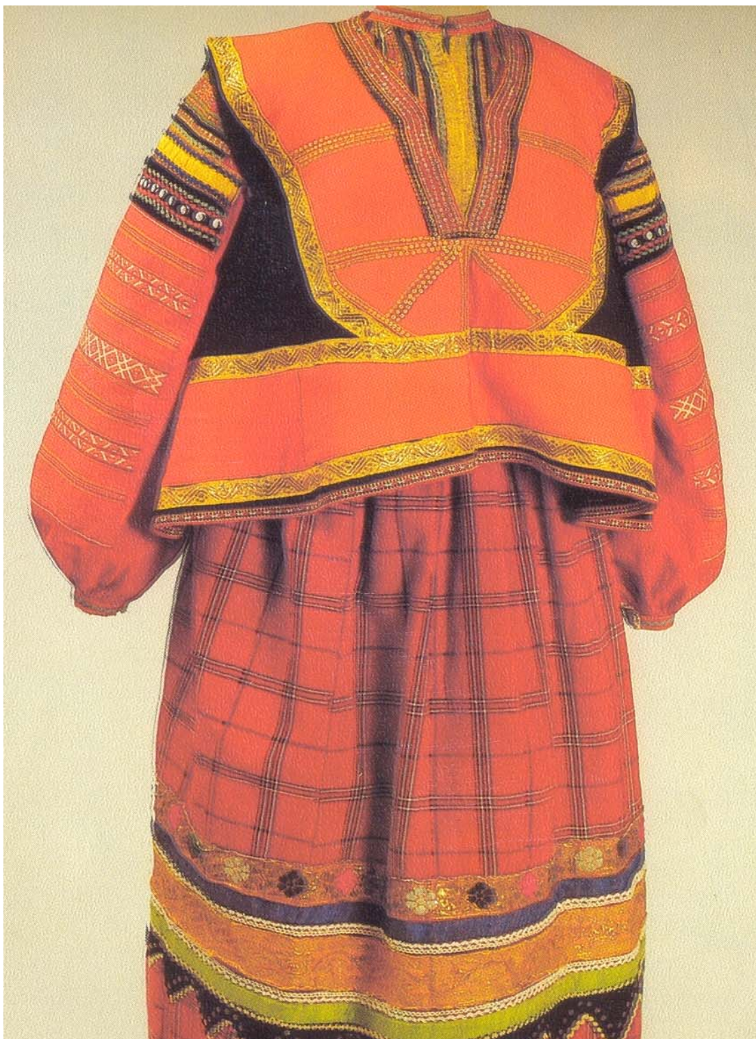
Русский народный головной убор. XIX век.

Праздничный костюм крестьянки Рязанской губернии. Последняя четверть XIX века.