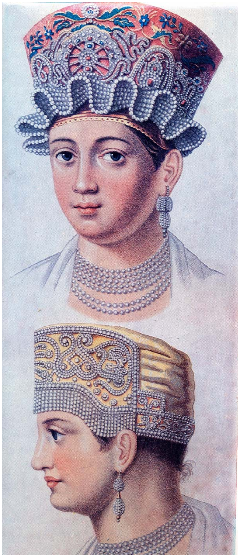
Женские праздничные головные уборы. XIX век.