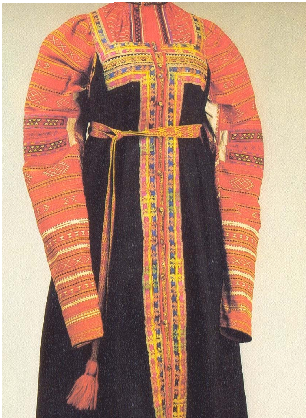
Рубаха девичья покосная. Каргополье. Конец XIX века.