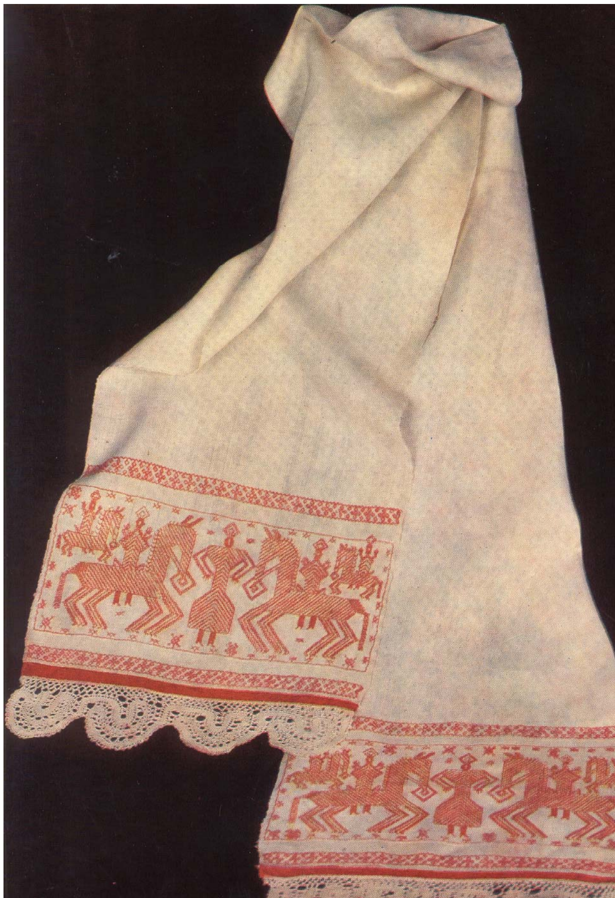
Свадебное полотенце. Каргополье. Конец XIX века.