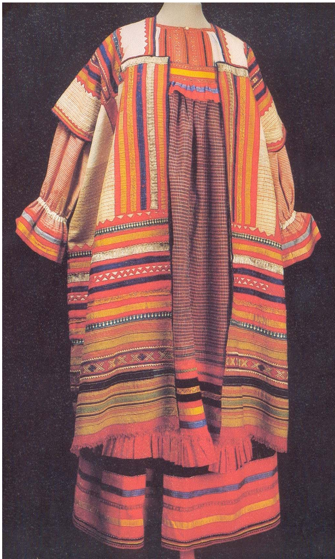
Поневный комплекс одежды крестьянки уезда Тамбовской губернии. Вторая половина XIX века.