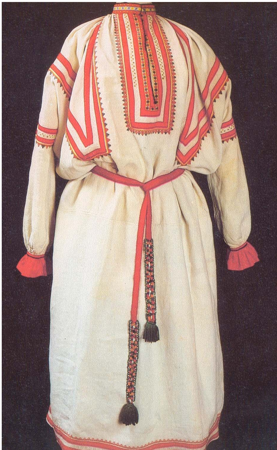
Костюм крестьянки Рязанской губернии. Вторая половина XIX века.