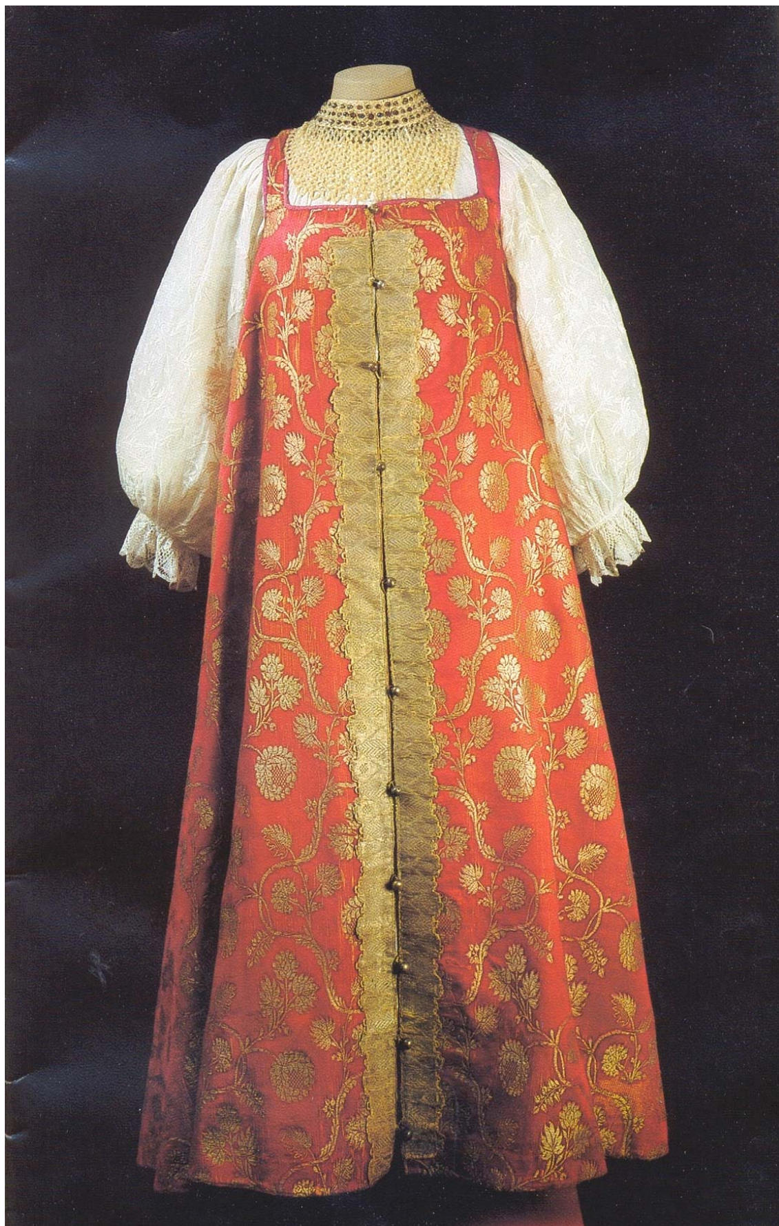
Праздничная русская народная одежда. Начало XIX века.