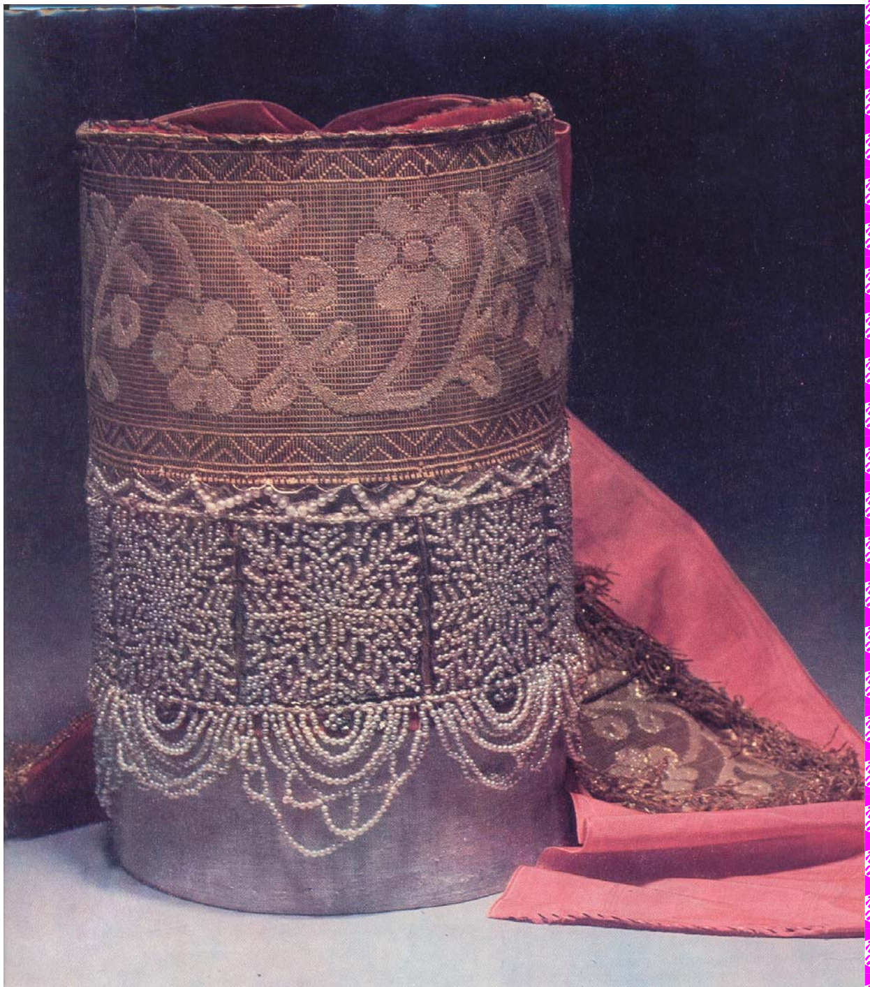
Девичий головной убор. Повязка. XIX век.