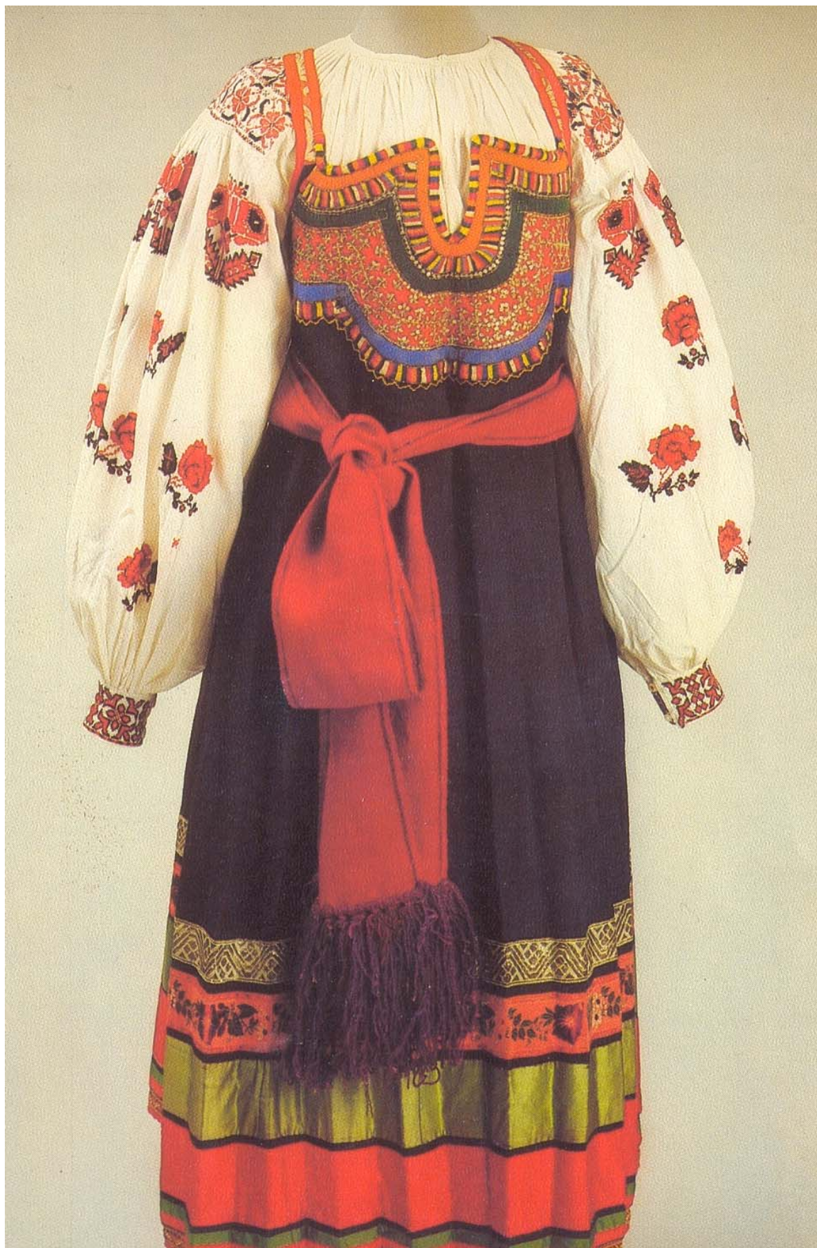
Праздничный костюм крестьянки Курской губернии. Вторая половина XIX века.