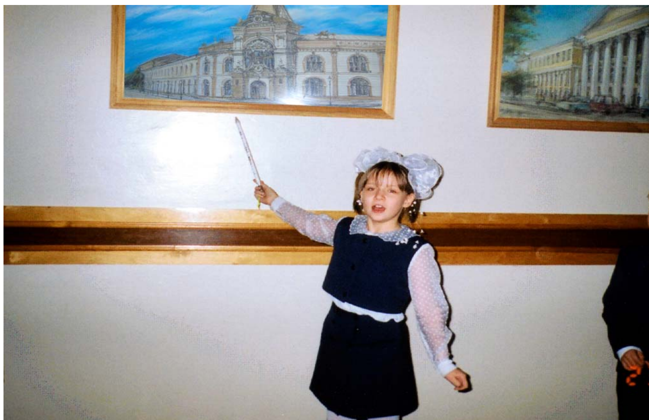
Экскурсия по картинной галерее гимназии № 122 г. Казани