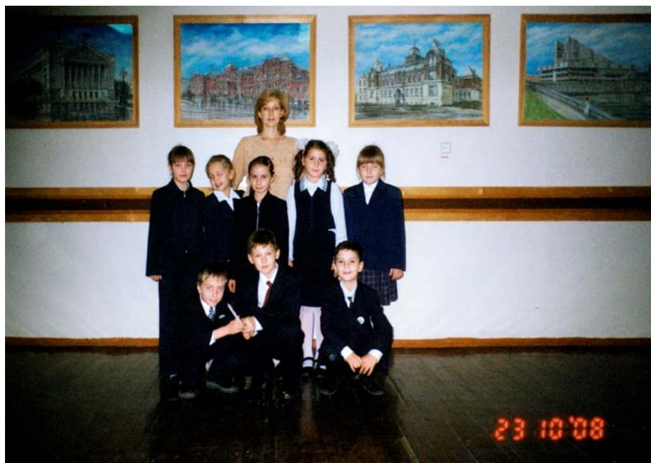
Актив отделения экскурсоводов Школы Ученого Зайца гимназии №122 г. Казани

Мы самостоятельно собрали материал для проведения экскурсии по картинной галерее гимназии.