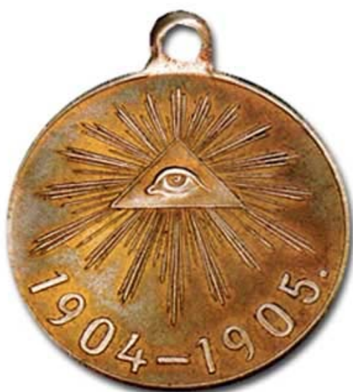
Медаль В память японской войны 1904-1905 гг.

Пожелтевшая от времени бумага с порванными, потрепанными краями - свидетельство причастности моего прадеда, простых людей к истории государства.