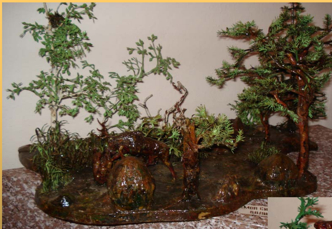
Природа Сибири Автор: Балин В.Н.