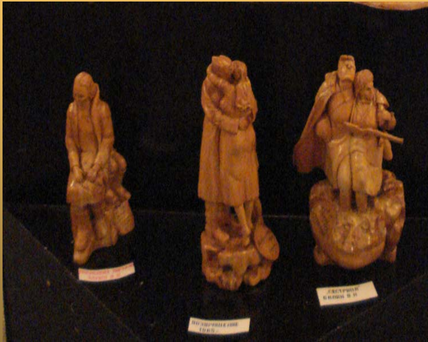
Автор: Балин В. Н.