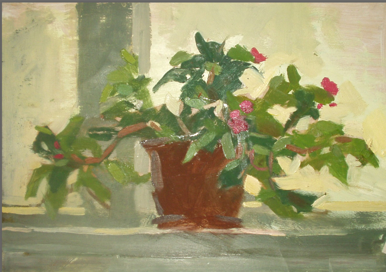
«Цветок на подоконнике» (масло)