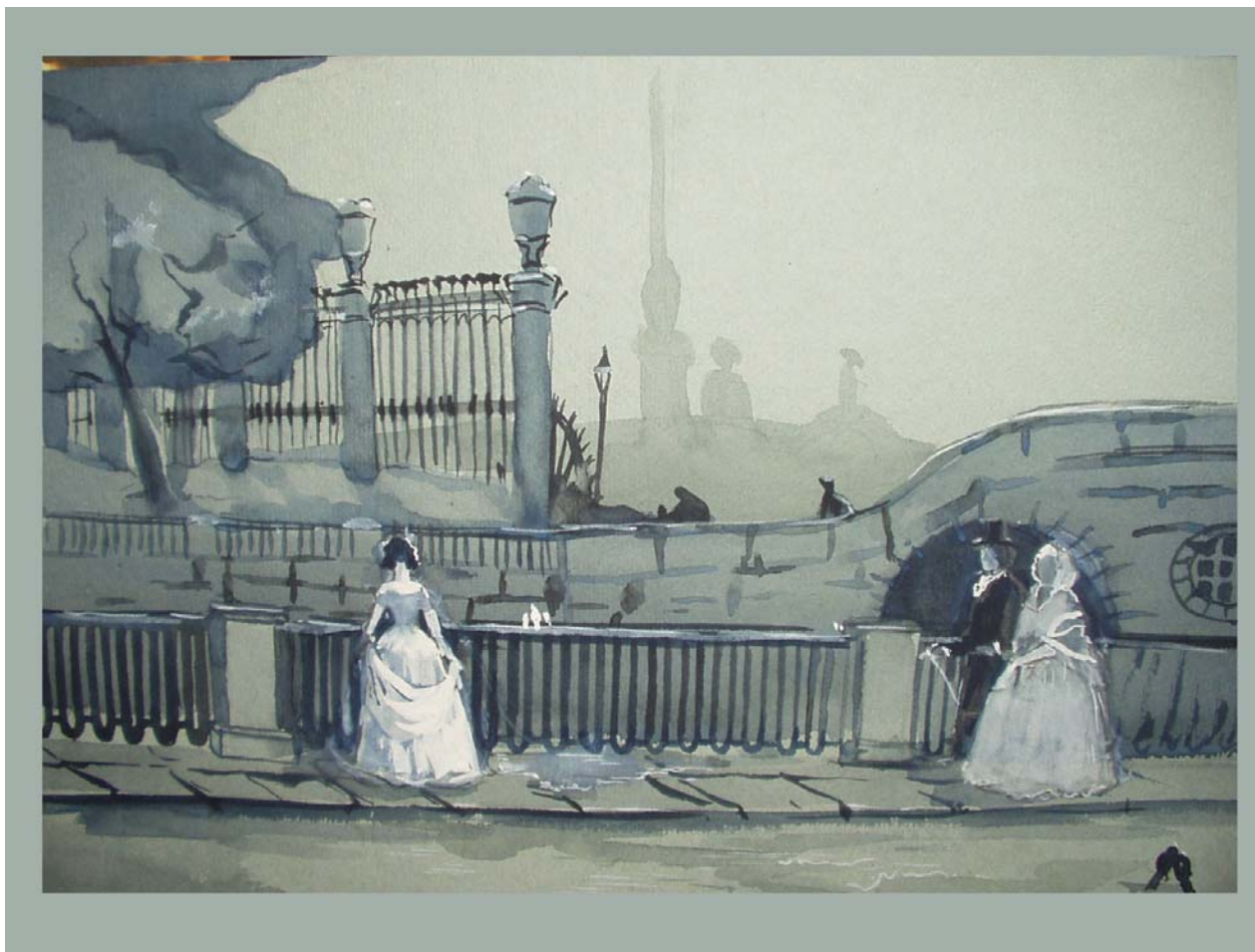
«Прогулка по набережной» (Акварель)