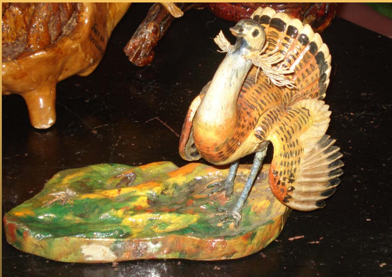
Степная птица автор: Балин В.Н.