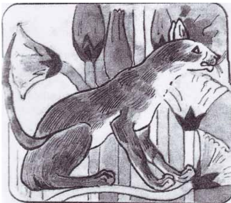
Рисунок 5. Изображение нубийской кошки древним художником.

Сегодняшним любителям кошек нубийская кошка вряд ли понравилась бы (см. рисунок 5). Она была длинноногая, имела короткую шерсть и маленькую голову. Но может быть, именно такая кошка нравилась людям тогда? А может быть, у них не было выбора, а «рабочие качества» этих животных вполне устраивали египтян?