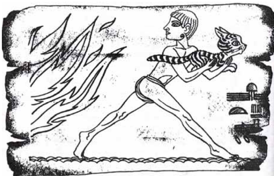
Рисунок 4. Спасение кошки из огня.

Поэтому богиня Бубасте – она изображалась женщиной с головой кошки, ей поклонялись, а саму кошку, которая считалась добрым духом дома, тщательно оберегали. Во время пожара, например, египтяне в первую очередь старались спасти кошку (см. рисунок 4), если она находилась в доме, а потом уже спасали имущество или гасили огонь. А ведь поймать в горящем доме обезумевшую от страха кошку было нелегко.