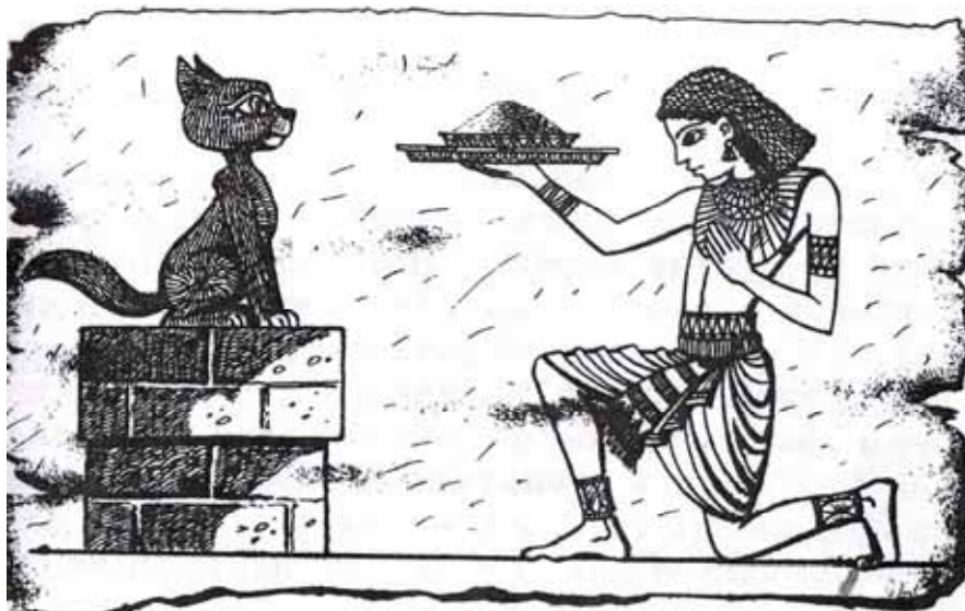
Рисунок 3. Древний обряд почитания кошек.

чем выше солнце, тем зрачки у кошки уже. И наоборот: чем солнце ниже, тем зрачки шире. Солнце зашло, наступила темнота, и зрачки кошки совсем расширилась, как маленькие солнца.