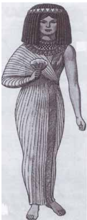
Рисунок 1. Изображение Богини Басты.

У нее были роскошные храмы, свои жрецы и свои почитатели. Умерших кошек хоронили на специальных кладбищах в специальных гробах (см. рисунок 2). Кошек бальзамировали, тщательно заворачивали в полотняные платки, усы и уши прижимали к голове, а наружу торчали уши и усы, искусно сделанные из того же полотна.