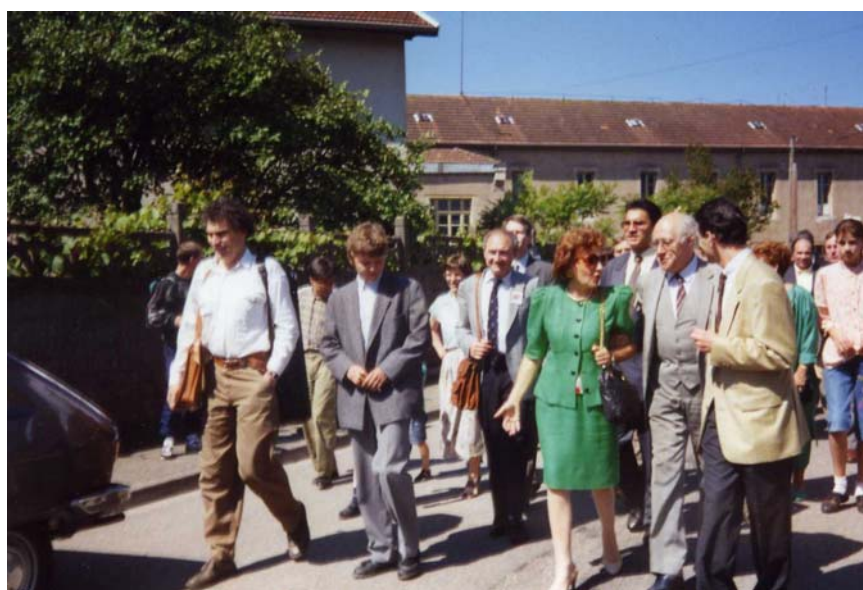
М. Ростропович с визитом во Францию.