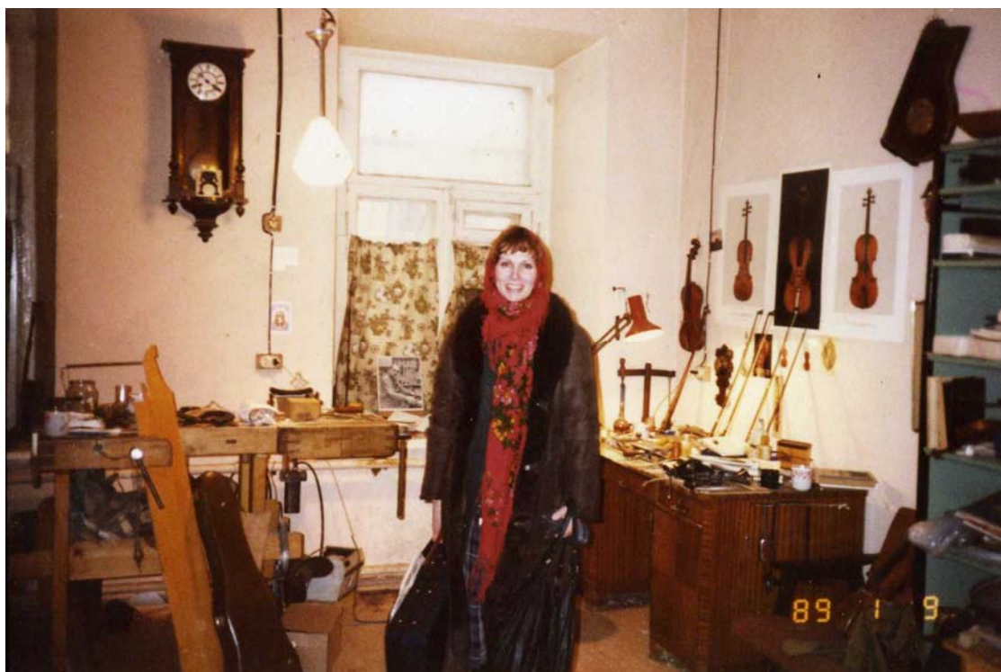
В мастерской Юры Московской консерватории.