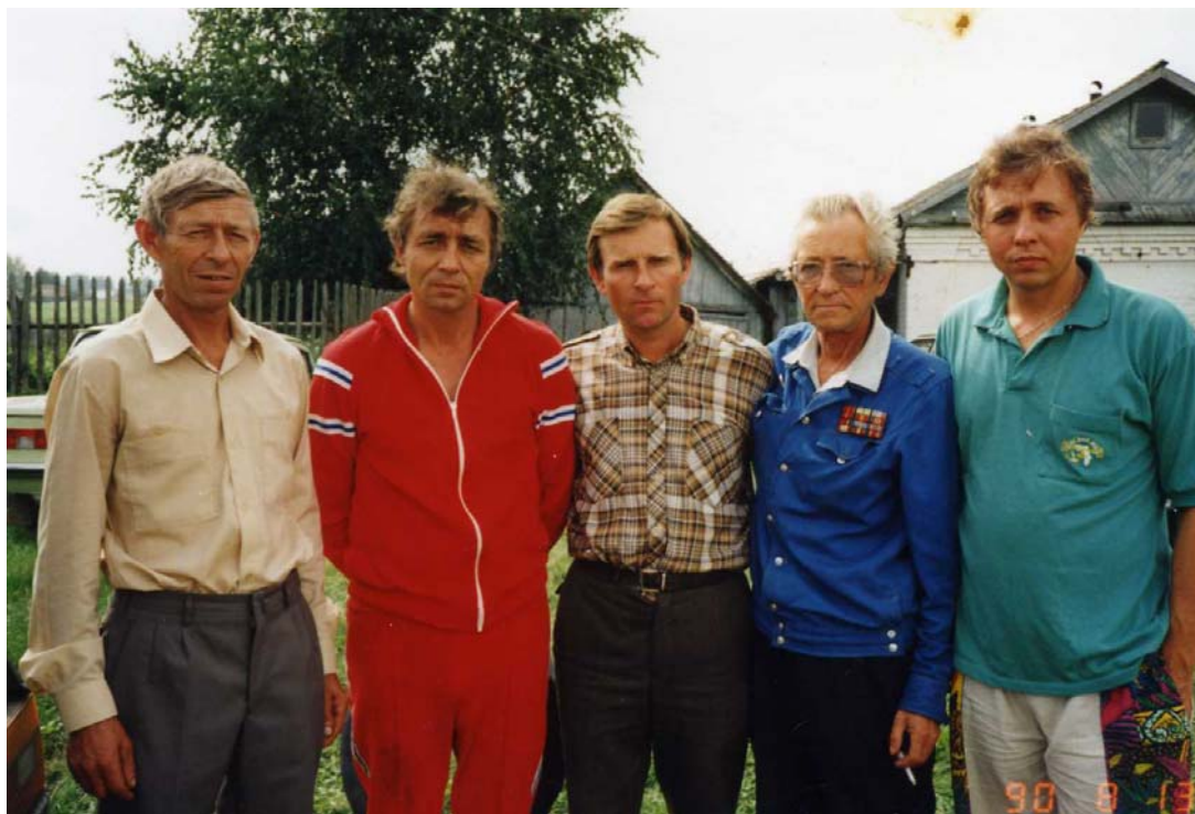
Встреча с братьями у родного дома.