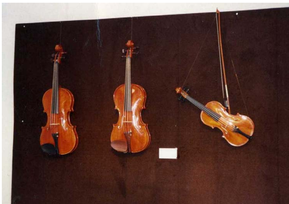
Инструменты, сделанные Юрием Тришевым. Париж – международная выставка – 1991 год.

Но прежде, чем попасть на этот конкурс, инструменты должны пройти экспертизу. Скрипки мордовского мастера прошли все преграды и получили высшую оценку.