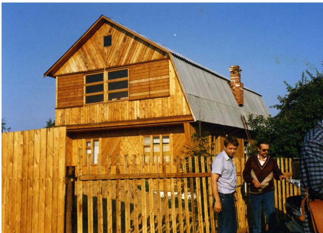
Загородный дом Юрия в Подмосковье.