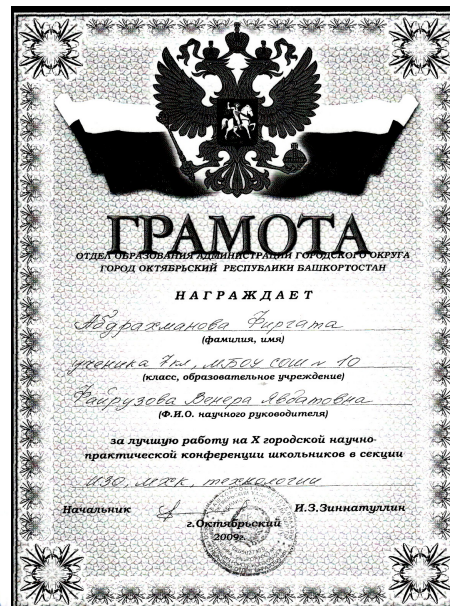
Участие в городской научно-практической конференции учащихся.