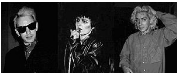
Siouxsie & The Banshees

Влияние на готическую субкультуру началось ещё очень давно, со времен Bowie, Doors и Velvet Underground, но расцвет панка в середине/конце 70х сделал существенную основу для готов, и в музыке и в имидже.