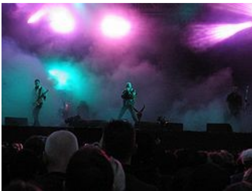
The Sisters of Mercy во время выступления

В в начале 90тых готический рок и метал оказали большое влияние на Visual kei, благодаря творчеству арт-рок группы Malice Mizer. Взяв у готической музыки более углублённую эстетику и имидж, Визуал кей к нынешним временам окончательно отделился от глэм-метала и элементы готик-метала и готик рока стали основными для направления.