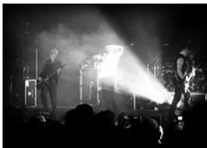
Bauhaus на сцене (2006)

Первый альбом Banshees («The Scream», Ноябрь 1978) и первый альбом Joy Division («Unknown Pleasures», Июнь 1979) во многом стали образцом для готов, с заметным отсутствием громких панковских гитар и акцентом на ритм секцию вместо этого, вместе с резким пустым звучанием.