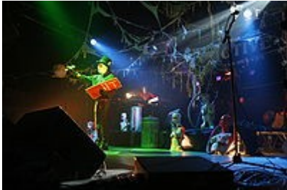
Alien Sex Fiend

Новая волна готических групп также стала получать серьёзное внимание со стороны СМИ, с попаданием Southern Death Cult на лицевую обложку NME (Октябрь 1982) и Sex Gang Children на лицевую обложку Noise! (также октябрь 1982).