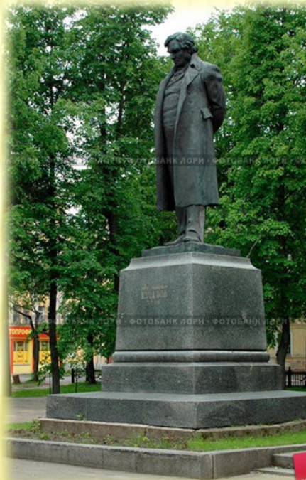
Тверь, памятник Крылову