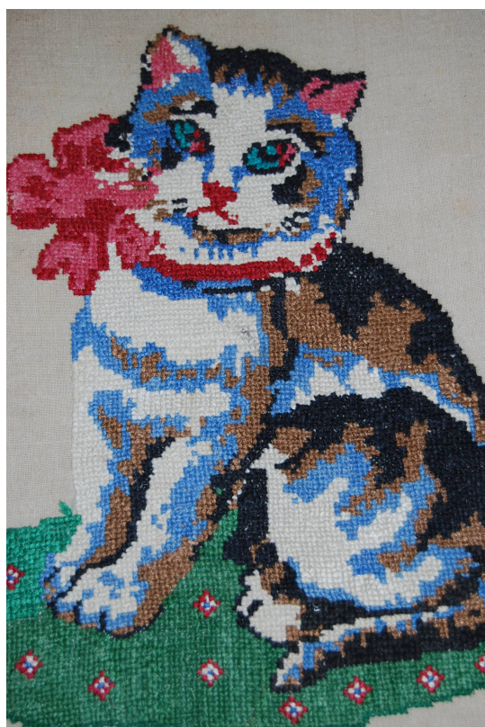
Вышивка. Автор: Коновалова Елизавета Петровна