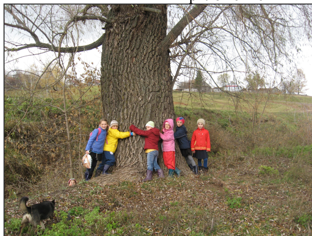
Вековая огромная ветла