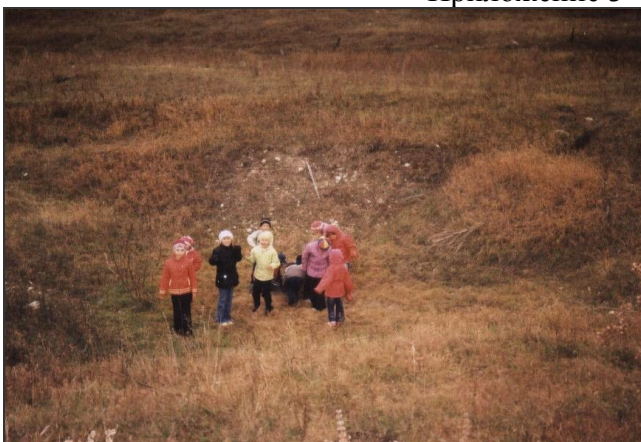
Яма, где люди прятали хлеб