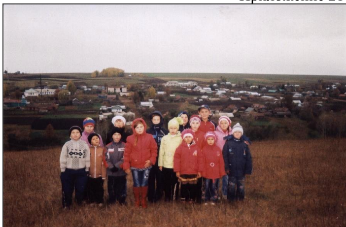
Вид села с возвышенности Сарапай