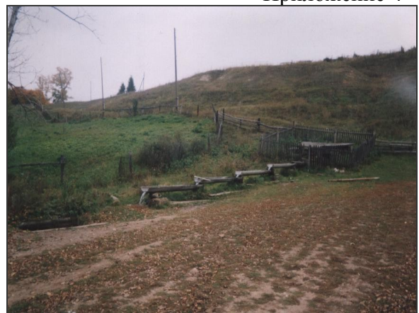
Место образования села Шигали