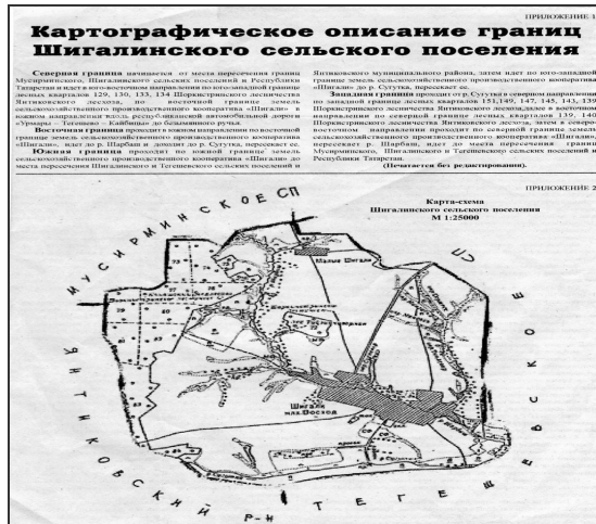
Картографическое описание границ Шигалинского сельского поселения