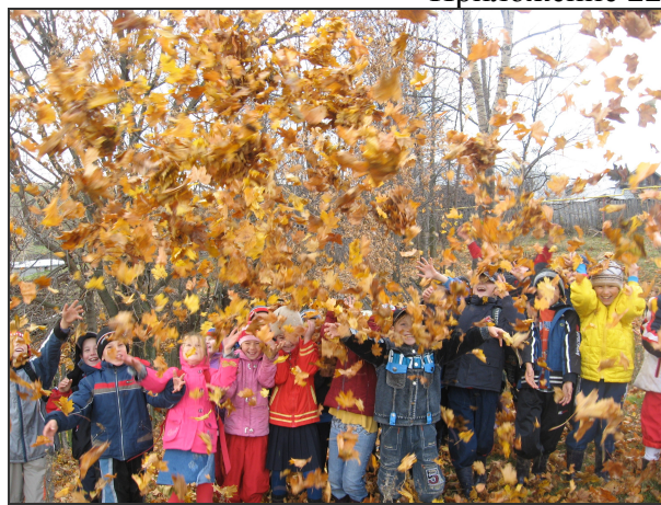
Красота родной природы