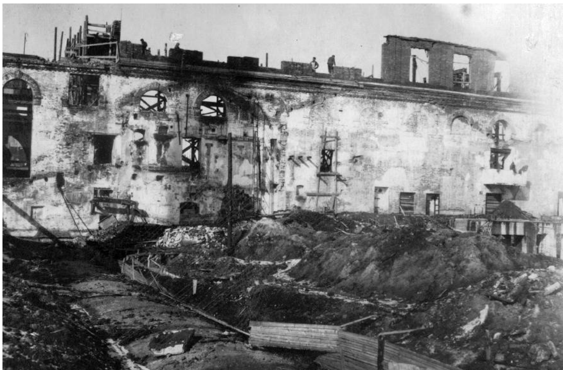
Сахарный завод. 1943г.