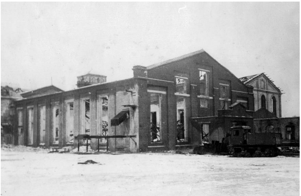
Главный корпус сахарного завода.