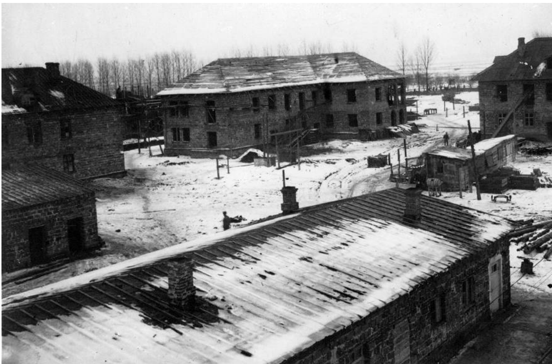
Ст. Нежеголь. 1943г.

При освобождении Шебекино погибли 66 советских солдат и офицеров. Они похоронены в пяти братских могилах в нашем городе.