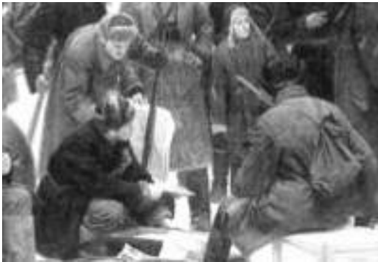
подошли к городу Шебекино.