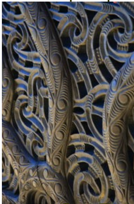
Пример резьбы «Татьянка».