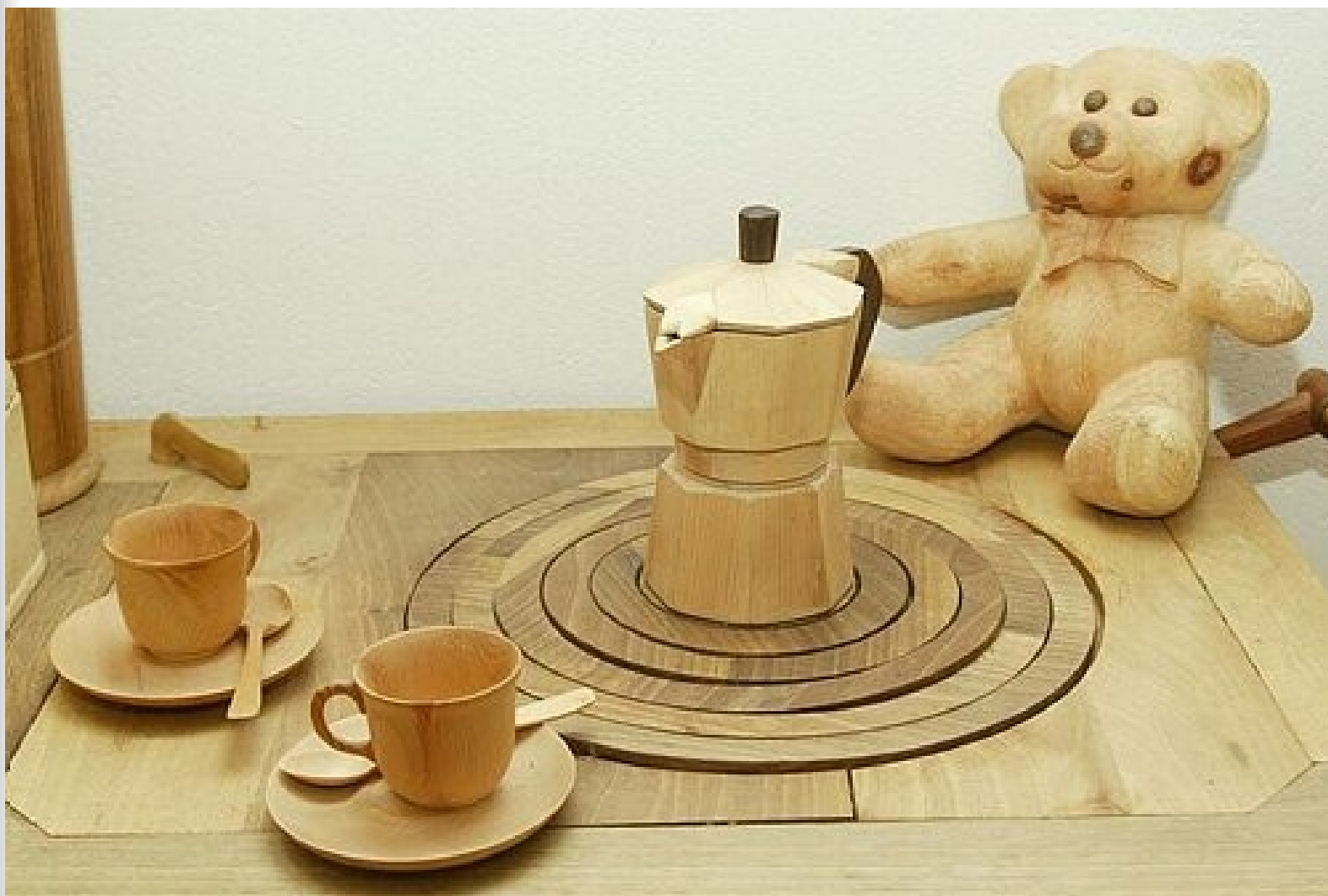
Деревянный мишка с чайным сервизом.