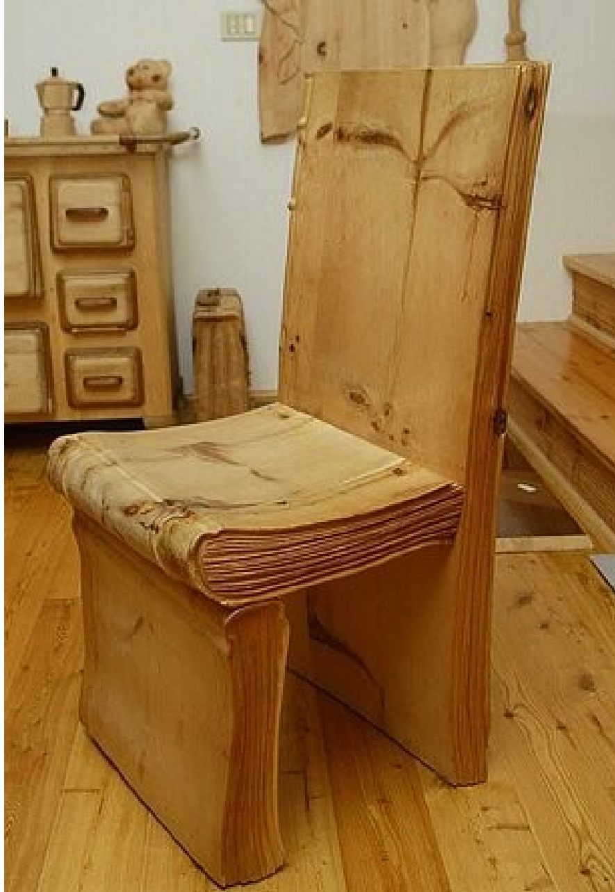
Стул, выполненный в форме книг.