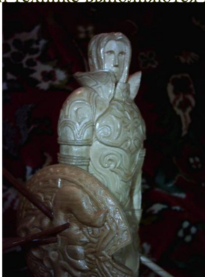
Пример рельефной резьбы.

Рельефная резьба характерна тем, что элементы резьбы находятся выше фона или на одном уровне с ним. Как правило, в этой технике выполняются все резные панно.