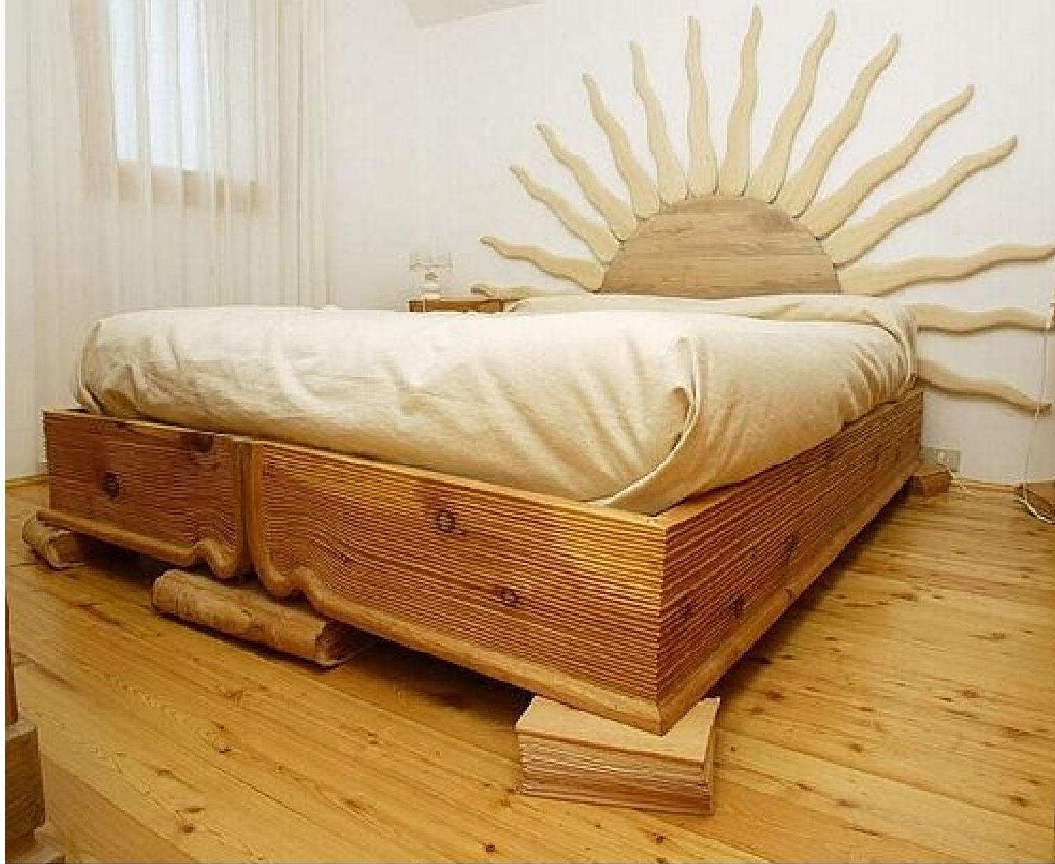
Спальная комната венецианского плотника.