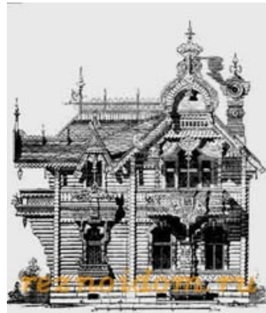
Примеры резных усадеб