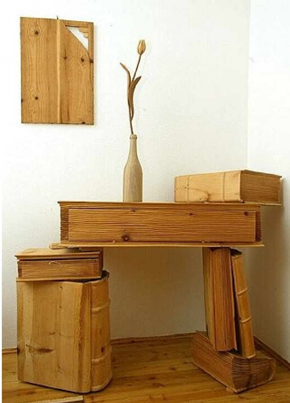
Письменный стол плотника.