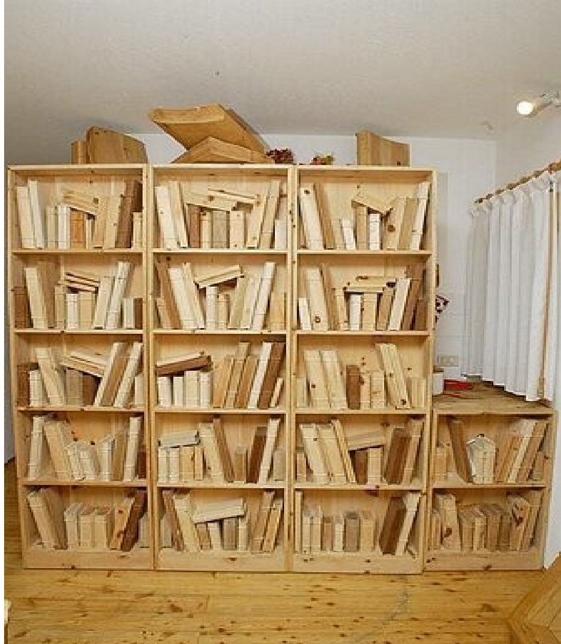
Книжные полки с деревянными книгами — одна из лучших работ плотника.