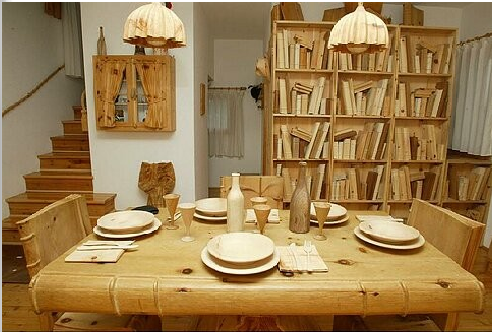
Интерьер дома венецианского плотника.