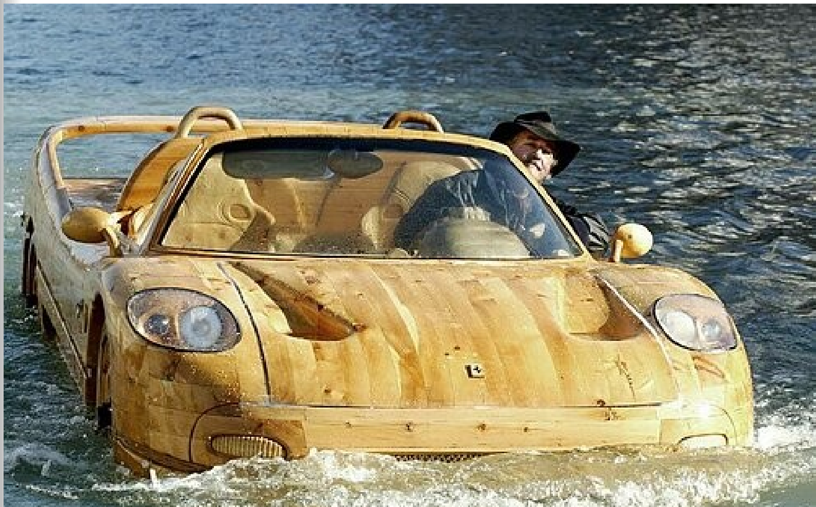
Лодка плотника, на изготовление которой ушло несколько лет.