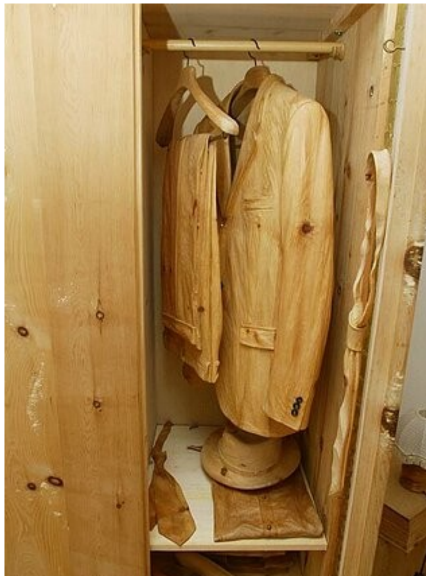
Шкаф с деревянной одеждой.