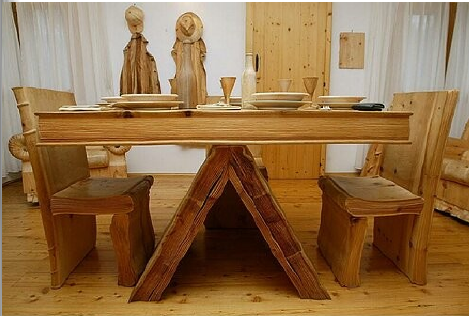
Стол и стулья, выполненные в форме книг.