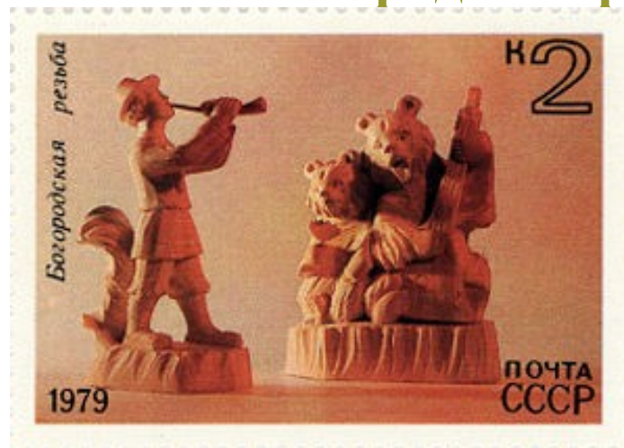
Пример скульптурной резьбы

Отличительная особенность — наличие скульптуры — изображения отдельных фигур (или групп фигур) людей, животных, птиц или других объектов. Фактически, является самым сложным видом резьбы, поскольку требует от резчика объёмного видения фигуры, чувства перспективы, сохранения пропорций. Отдельным подвидом её считается богородская резьба .