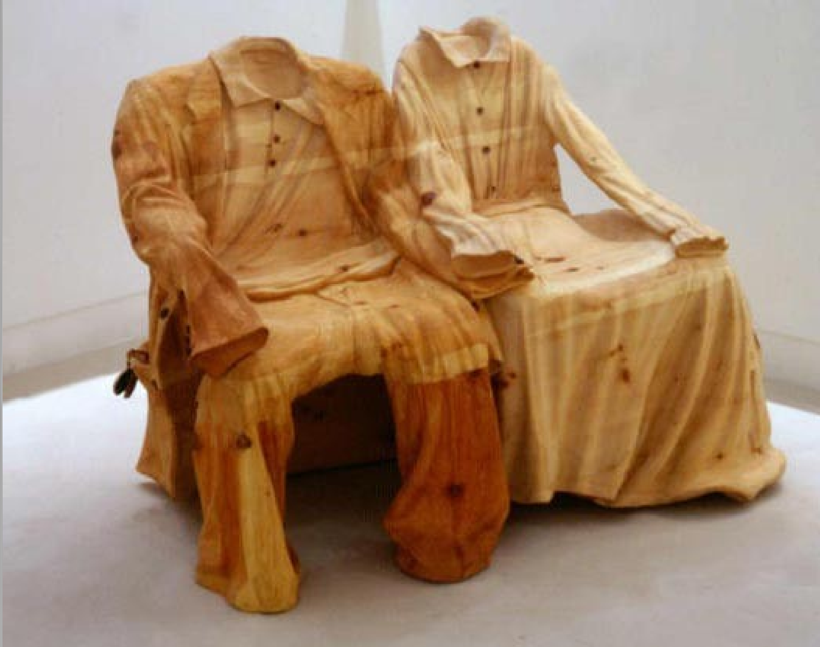
Деревянная одежда, одна из самых первых работ плотника.