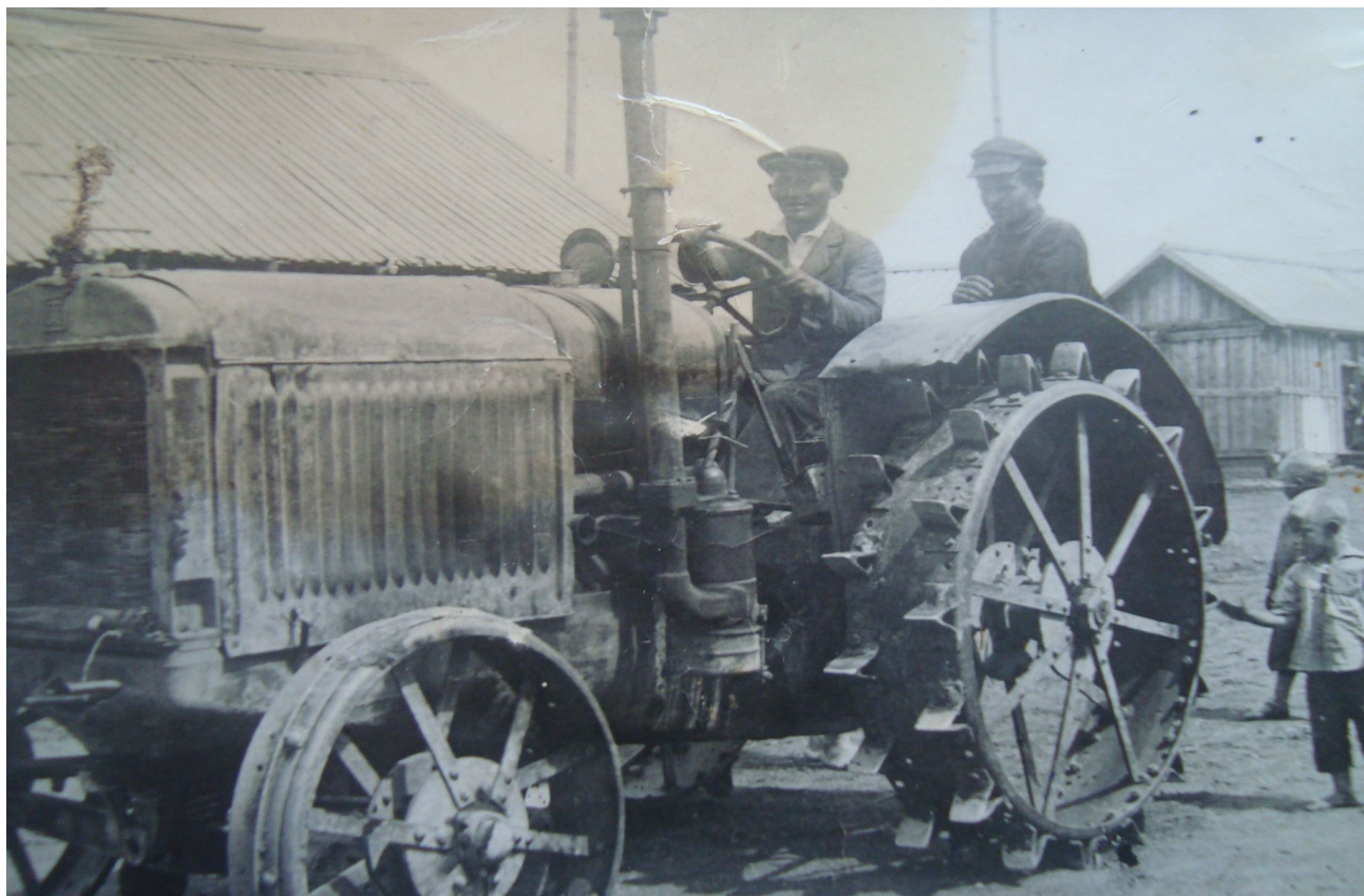
Трактор Харьковского тракторного завода