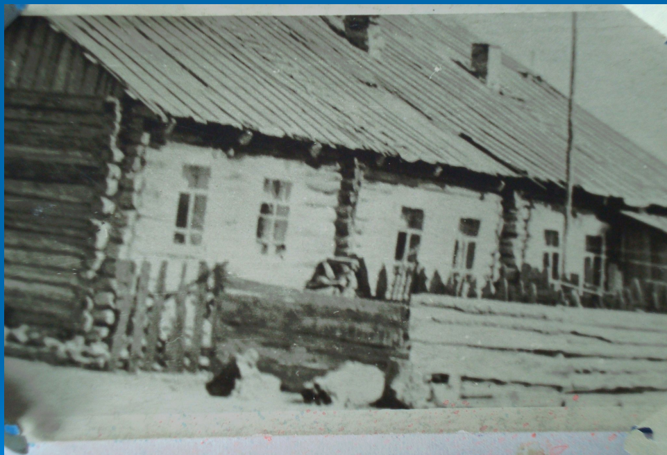
Здание конторы, позднее стала школой. 1925г.