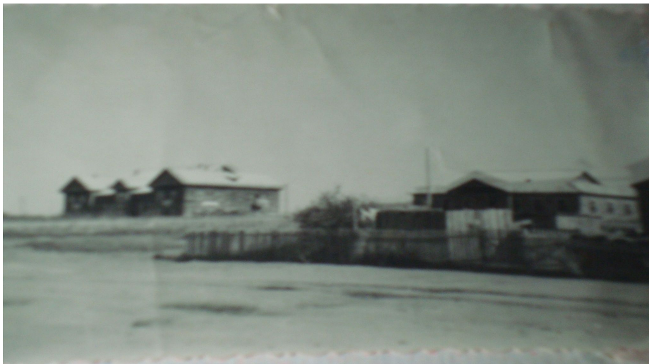
Послевоенное строительство домов.