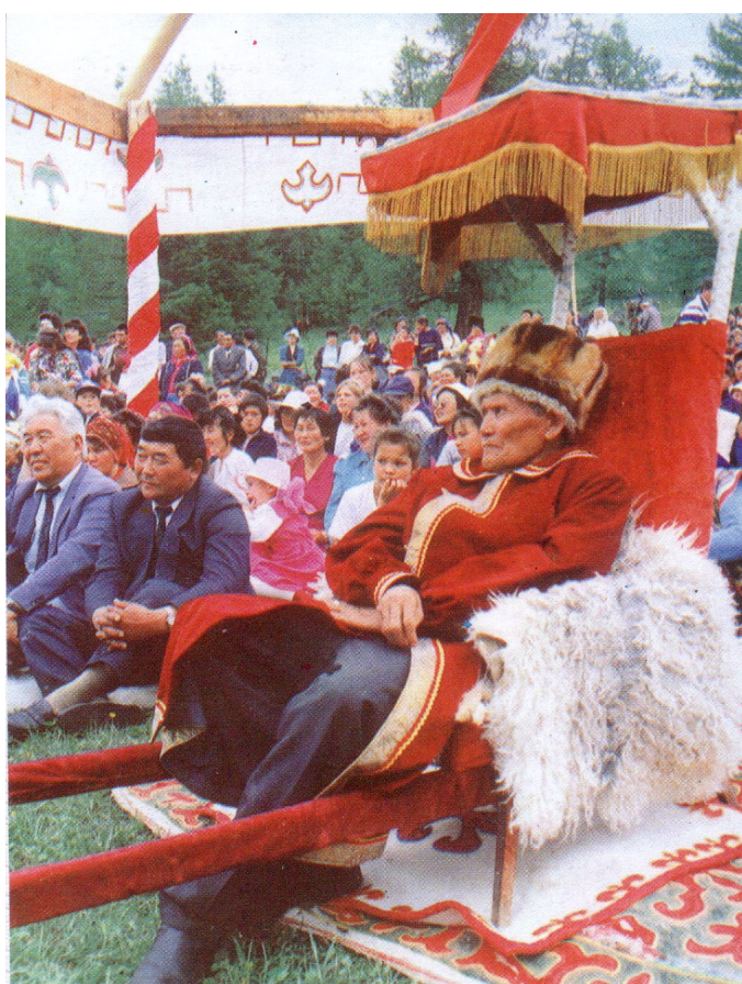
Алексей Григорьевич Калкин – великий кайчи (сказитель)