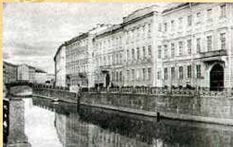
Квартира Пушкина в Петербурге на Набережной Мойки

С середины октября 1831 г. и уже до конца жизни Пушкин с семьей живет в Петербурге.