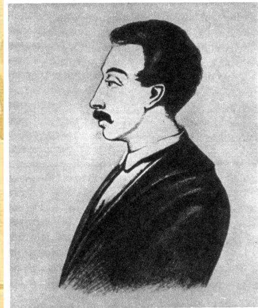
Вильгельм Карлович Кюхельбекер