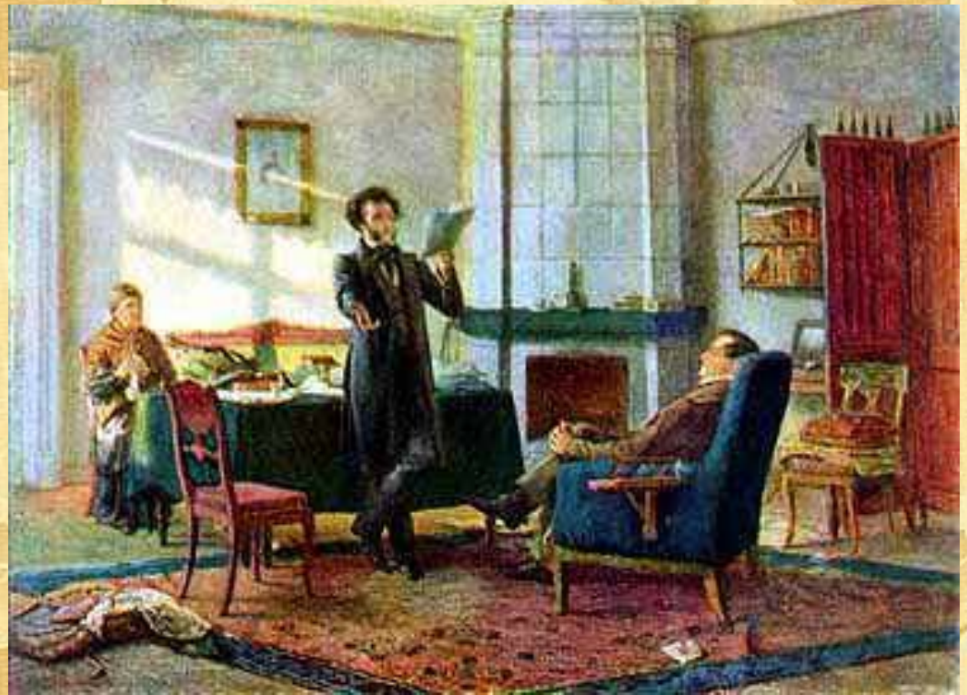
Пушкин в селе Михайловском (Пушкин у Пушкина). Н.Н. Ге. 1875 г.

За три года ссылки написаны "Кавказский пленник", "Бахчисарайский фонтан", а также "Узник", "Песнь о Вещем Олеге». Начат роман в стихах "Евгений Онегин".