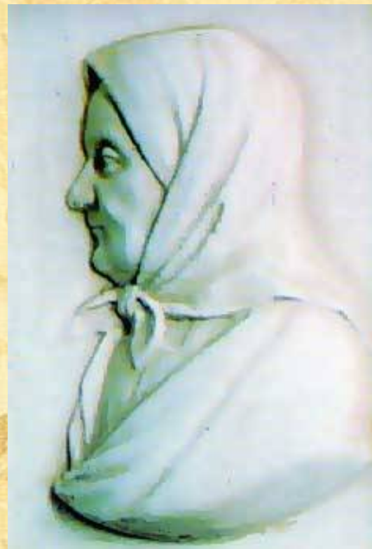
Яковлева Арина Родионовна