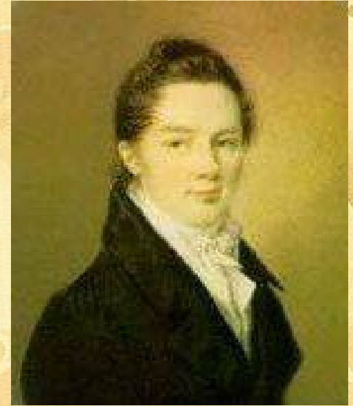
Иван Иванович Пуцин

Пушкин сохранил лицейскую дружбу и культ Лицея на всю жизнь.