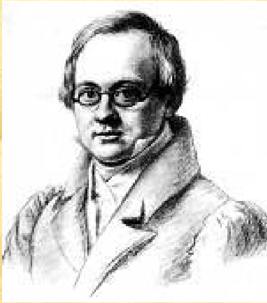
Антон Антонович Дельвиг