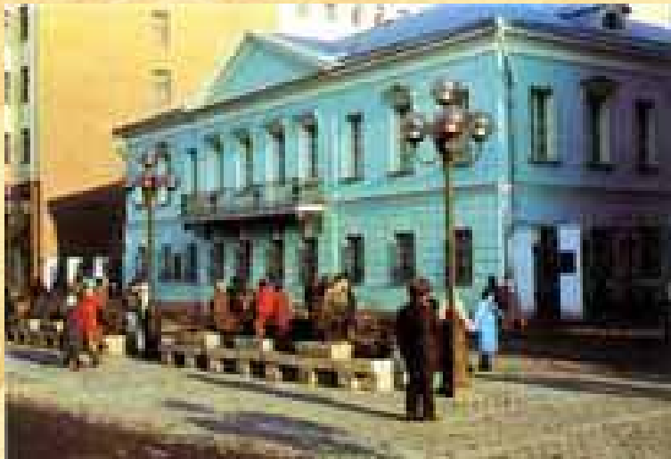
Квартира Пушкина в Москве на Арбате

18 февраля 1831 г. в церкви Вознесения Господня состоялось его венчание с Н.Н.Гончаровой. Первые месяцы семейной жизни он провел с женой в Москве, сняв квартиру на Арбате