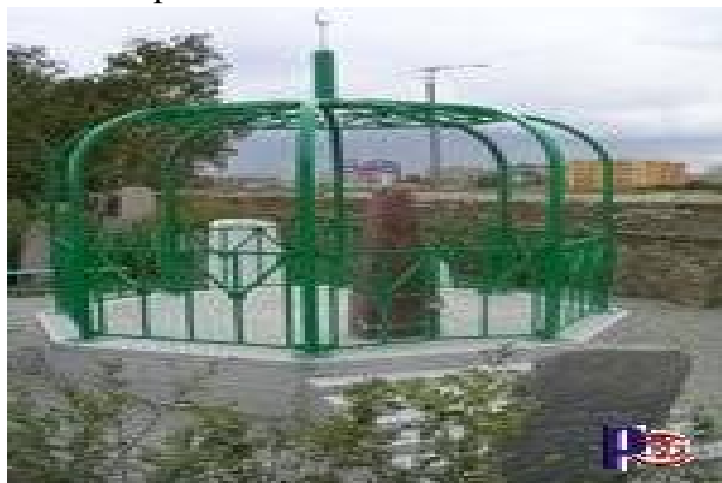
Могила Зайнуллы Хабибулловича Расулева.

Даже зимой к этой могиле ведёт протоптанная тропинка.