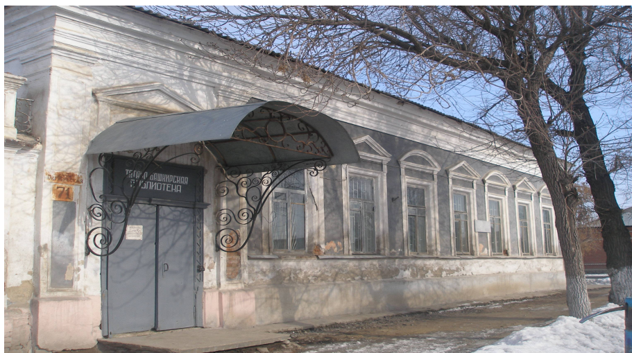
Татаро - башкирская библиотека.