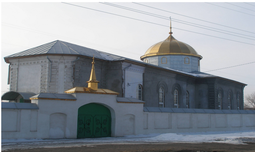
Мечеть по ул. Октябрьской

Сегодня из семи дореволюционных мечетей действуют две.