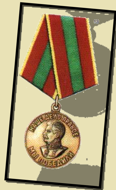
Медаль «За доблестный труд в ВОВ 1941-1945гг.