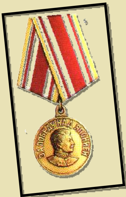
Медаль «За победу над Японией»