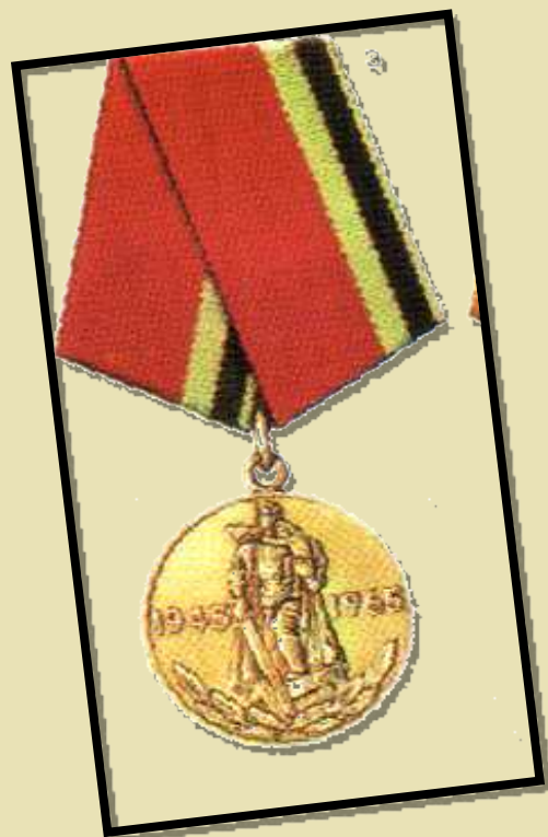
Медаль «20 лет Победы в ВОВ 1941-1945»