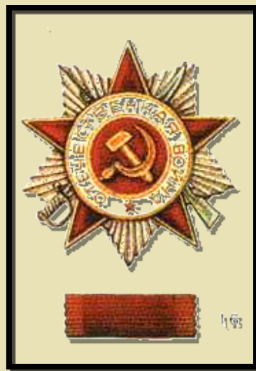
Награжден орденом Отечественной войны 2 степени