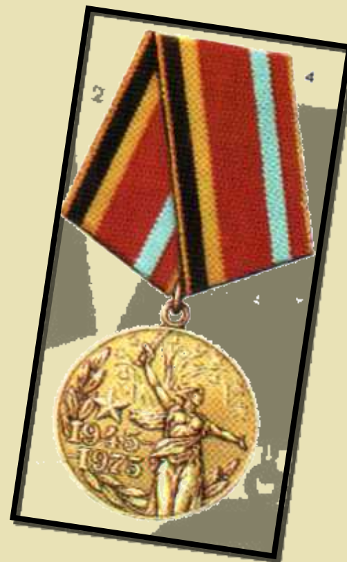
Медаль «30 лет Победы в ВОВ 1941-1945»