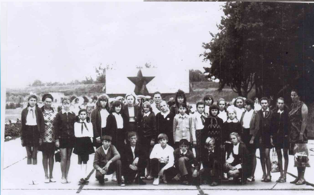
Брестская крепость-герои 1976 год. ★