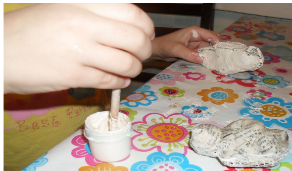
(Рис. 6) Грунтовка папье-маше белой гуашью.