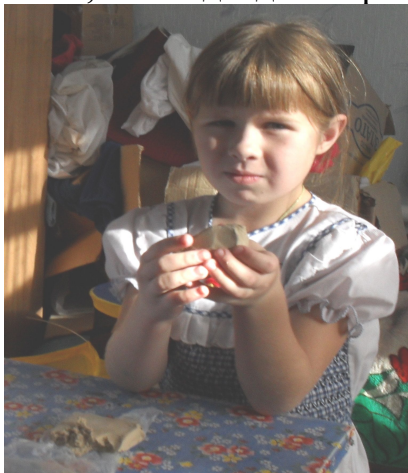
(Рис.1) Изготовление форм голов.

Далее, при помощи бинта и клея, мы снова соединили уже пустые половинки голов. Дали клею высохнуть и загрунтовали папье-маше сначала полностью белой гуашью, затем гуашью коричневого цвета. Когда гуашь просохла, мы медведям нарисовали глаза, брови, рот, но