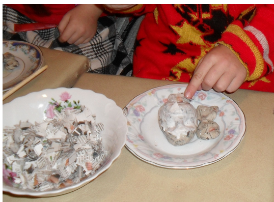
(Рис.3) Оклеивание формы папье-маше.