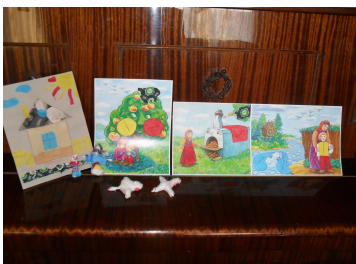
(Рис.5) Настольный театр.