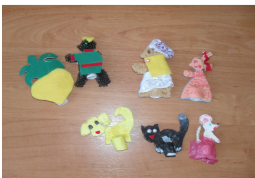
(Рис.6) Пальчиковый театр.