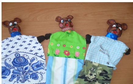
(Рис. 1) Одежда для медведей

Для Медведицы мы сшили длинное платье, к рукавам которого пришили лапки коричневого цвета. Медведя и Медвежонка мы одели в рубашки, с пришитыми к ним лапками, и так называемые «штаны», которые являются продолжением рубахи, только другого цвета .