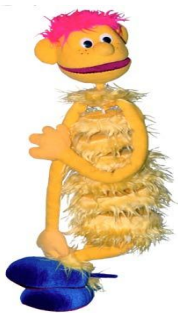
Рис.7 Напольная кукла.