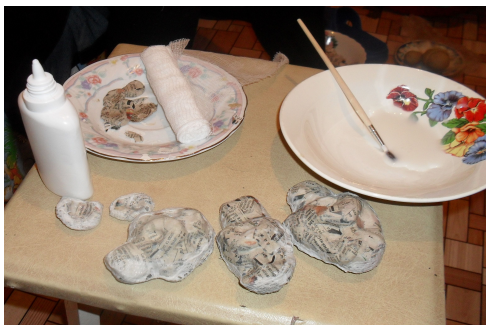
(Рис.5) Склеивание папье-маше по швам.