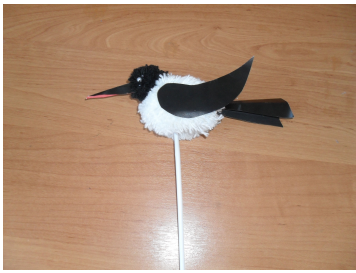
(Рис. 3) Тростевая кукла.