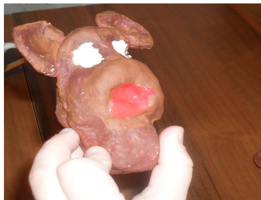
(Рис.8) Оформление морды.