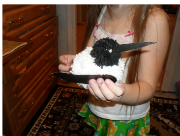
(Рис.3) Готовая кукла.