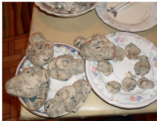
(Рис.4) Отделение папье-маше от формы.