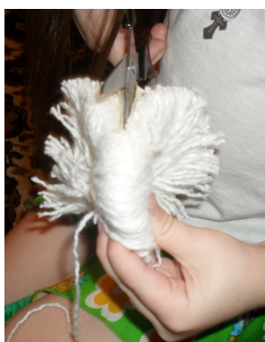
(Рис.2) Разрезание пряжи