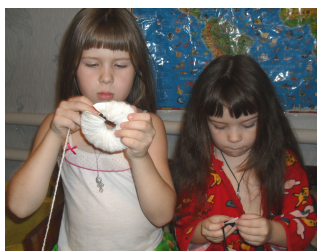
(Рис. 1) Изготовление помпончиков. Наматывание пряжи.

Далее мы сшили тело и голову, приклеили клюв, хвост, крылья из картона, пришили глазки. Снизу, в тело Сороки, вставили гибкую тросточку.