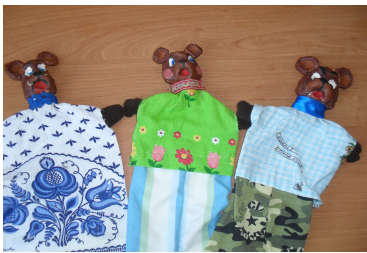
(Рис.4) Перчаточные куклы.