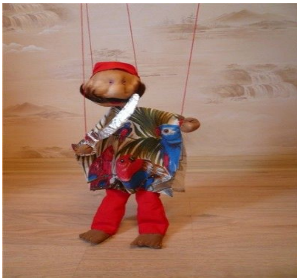
Рис.8 Марионеточная кукла.