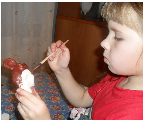
(Рис.7) Окраска фигурки цветной гуашью.