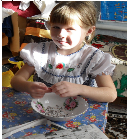
(Рис.2) Заготовка бумаги для папье-маше.