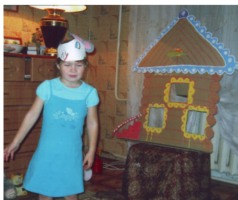
(Рис.1) Драматический театр.