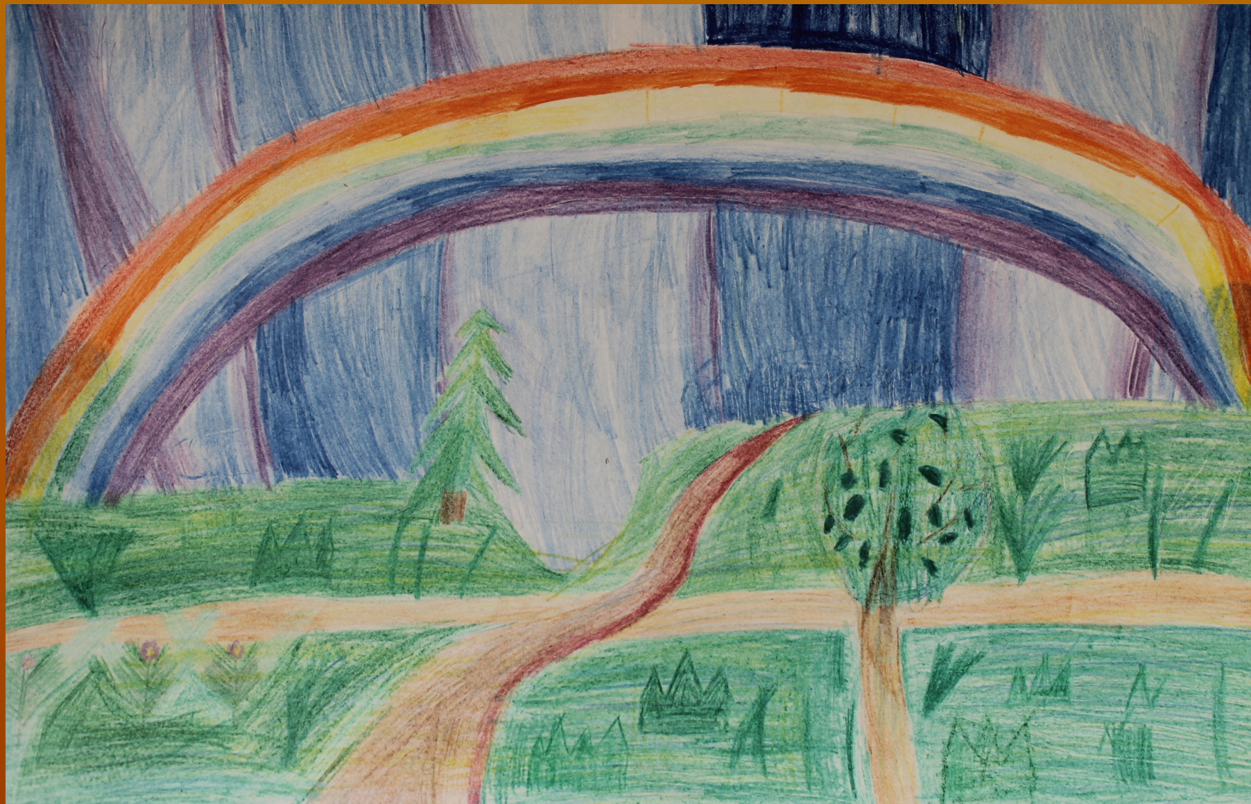
Рисунок Борисовой Дарии к стихотворению Леонтьева А.К.