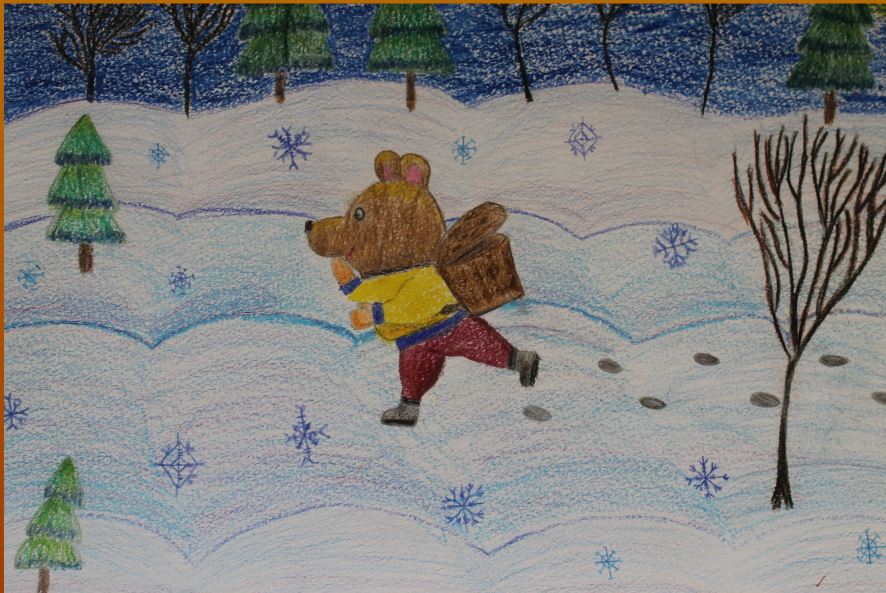
Рисунок Российских Эвелины к стихотворению Леонтьева А.К.