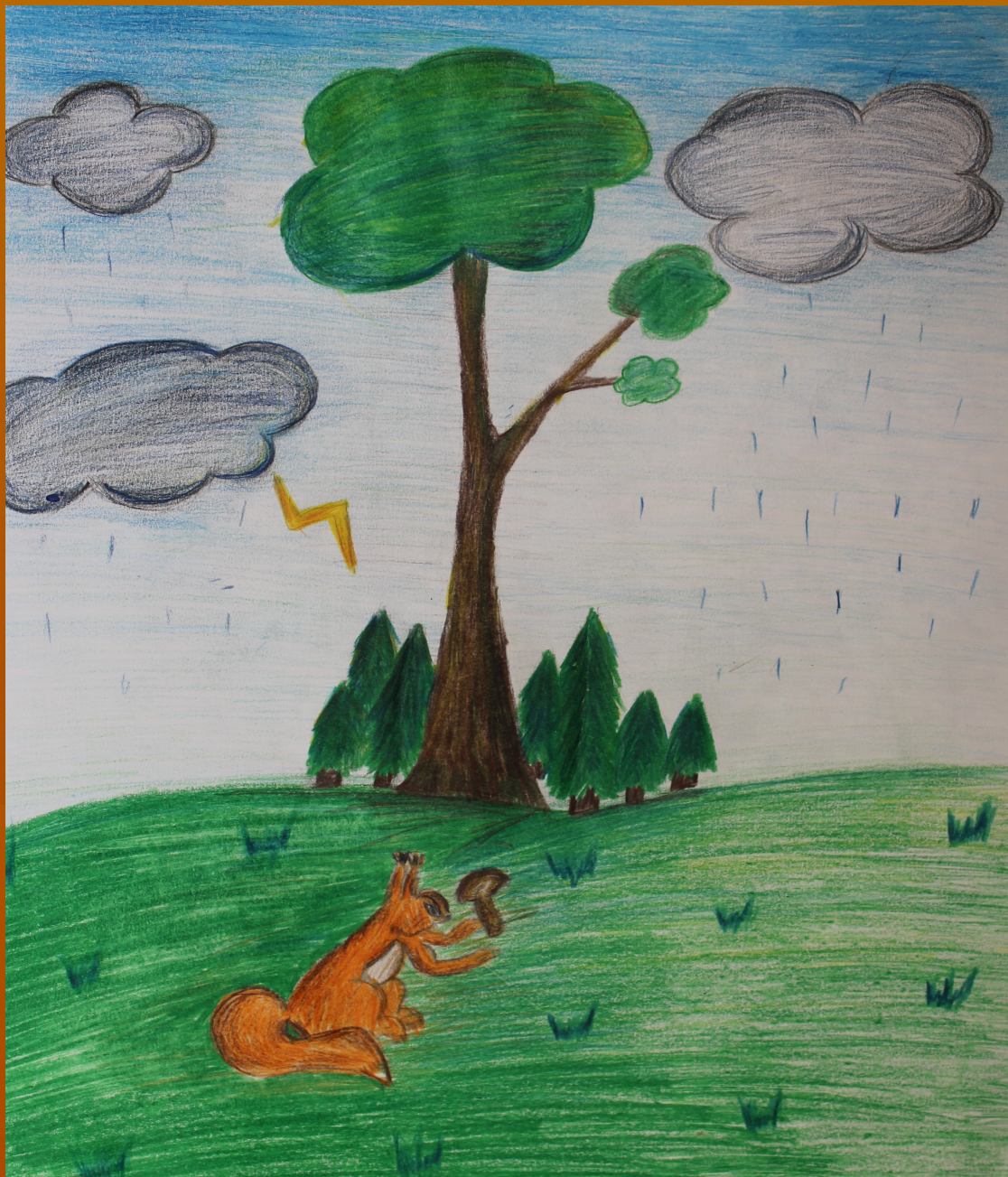
Рисунок Башкировой Ксении к стихотворению Леонтьева А.К.