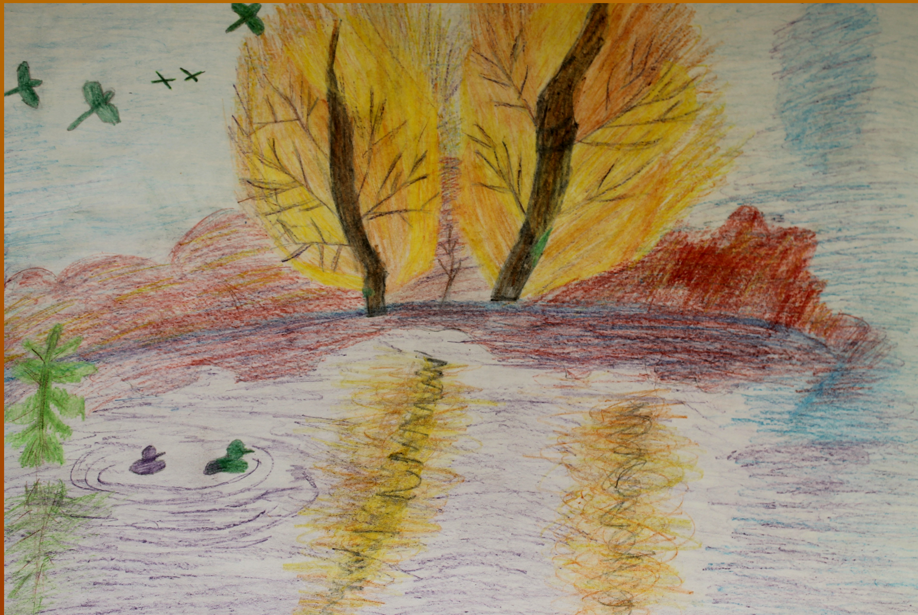
Рисунок Ельцовой Анастасии к стихотворению Леонтьева А.К.