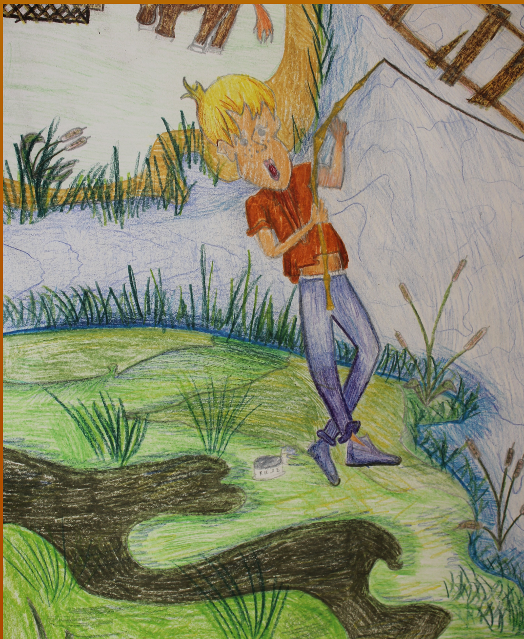
Рисунок Иванова Григория к стихотворению Леотьева А.К. «Лето».