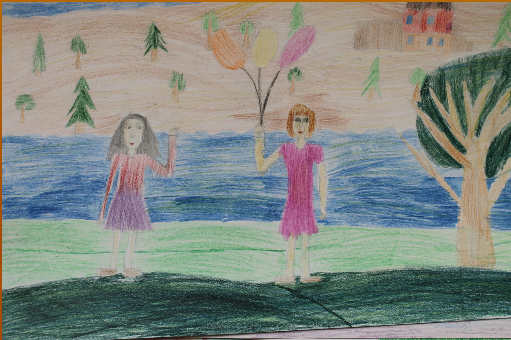
Рисунок Борисовой Дарии к стихотворению Леонтьева А.К.