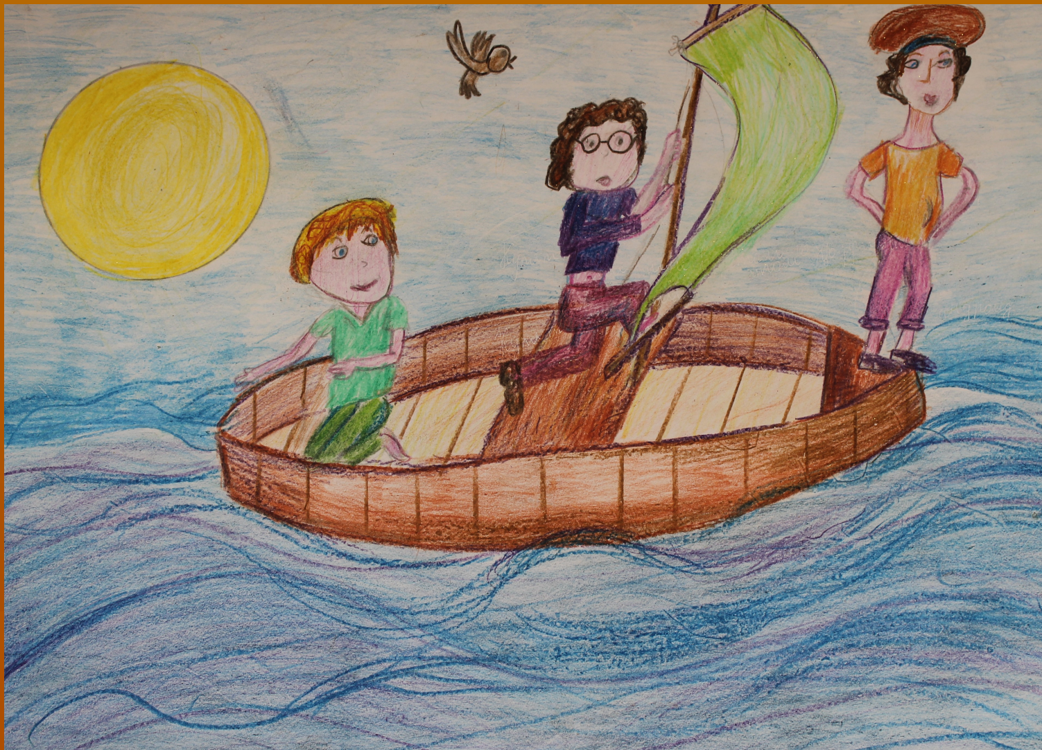
Рисунок Сидоровой Полины к стихотворению Леонтьева А.К. «Пыжын».