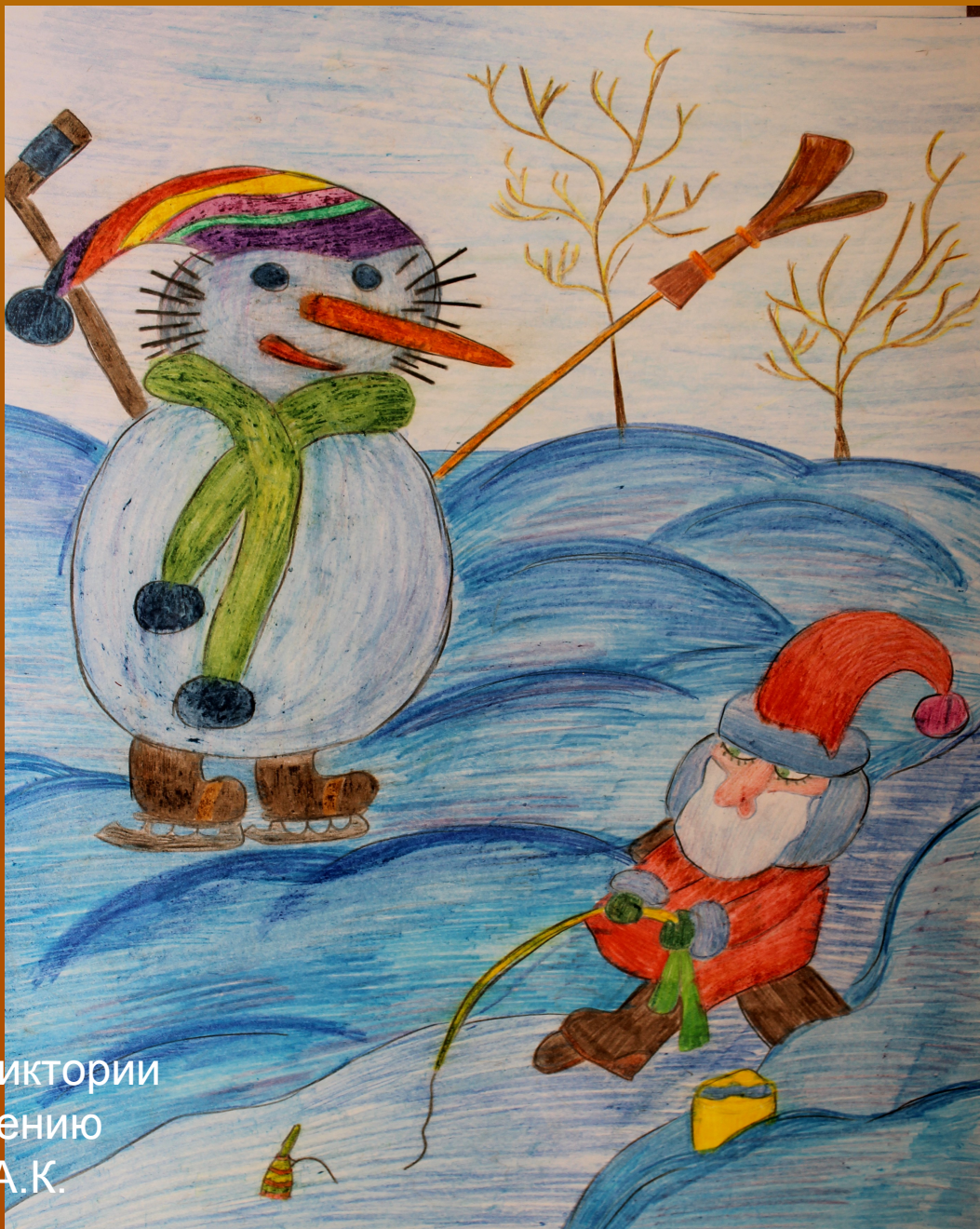
Рисунок Якоревой Виктории к стихотворению Леонтьева А.К.