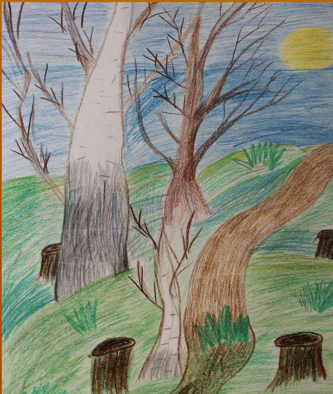
Рисунок Дубовцевой Дианы к стихотворению Леонтьева А.К.