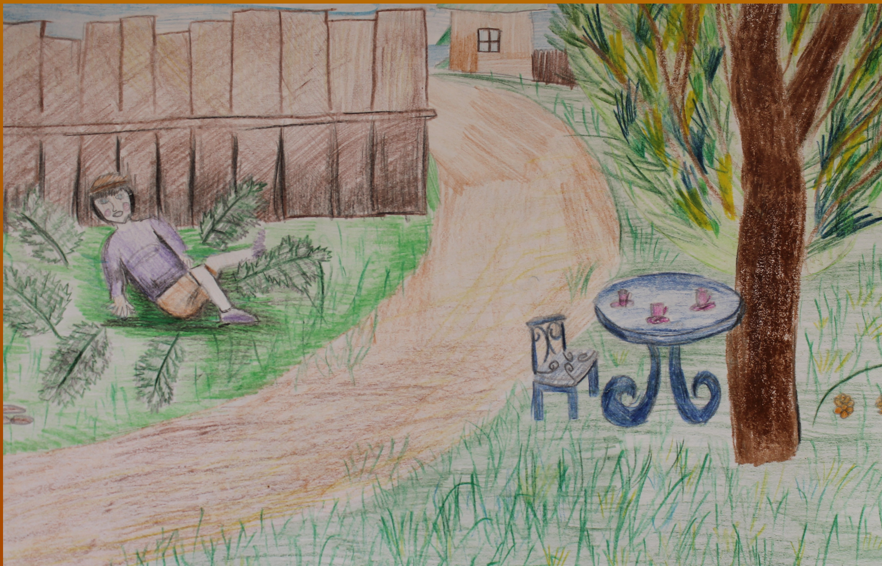
Рисунок Огородниковой Алины к стихотворению Леонтьева А.К. «Наш Паршион куатаськиз».