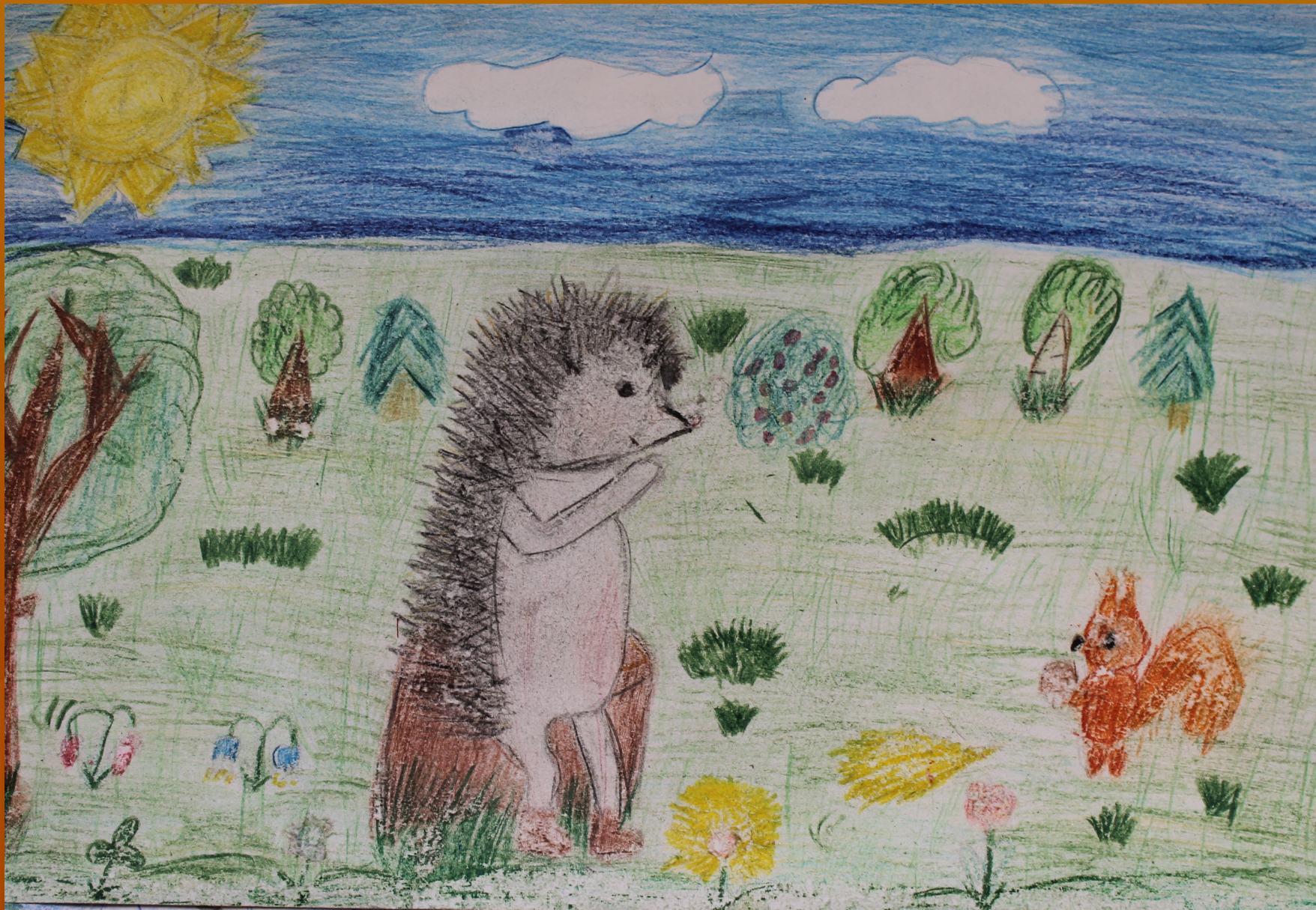
Рисунок Семаковой Елизаветы к стихотворению Леонтьева А.К, «Ёжик и гриб».