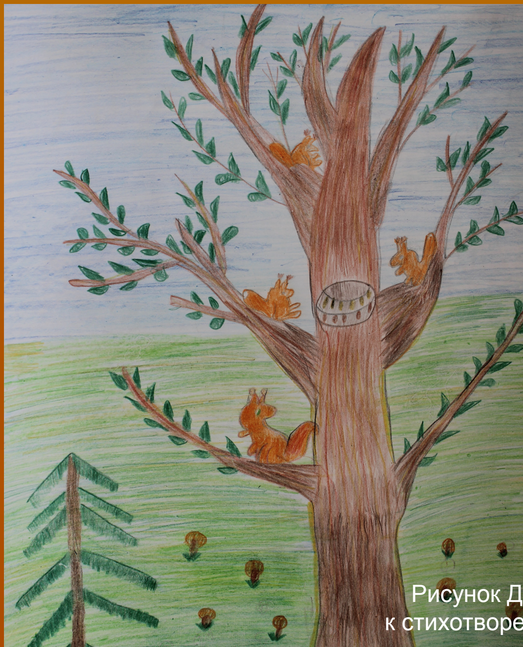
Рисунок Дианы Дубовцевой к стихотворению Леонтьева А.К.