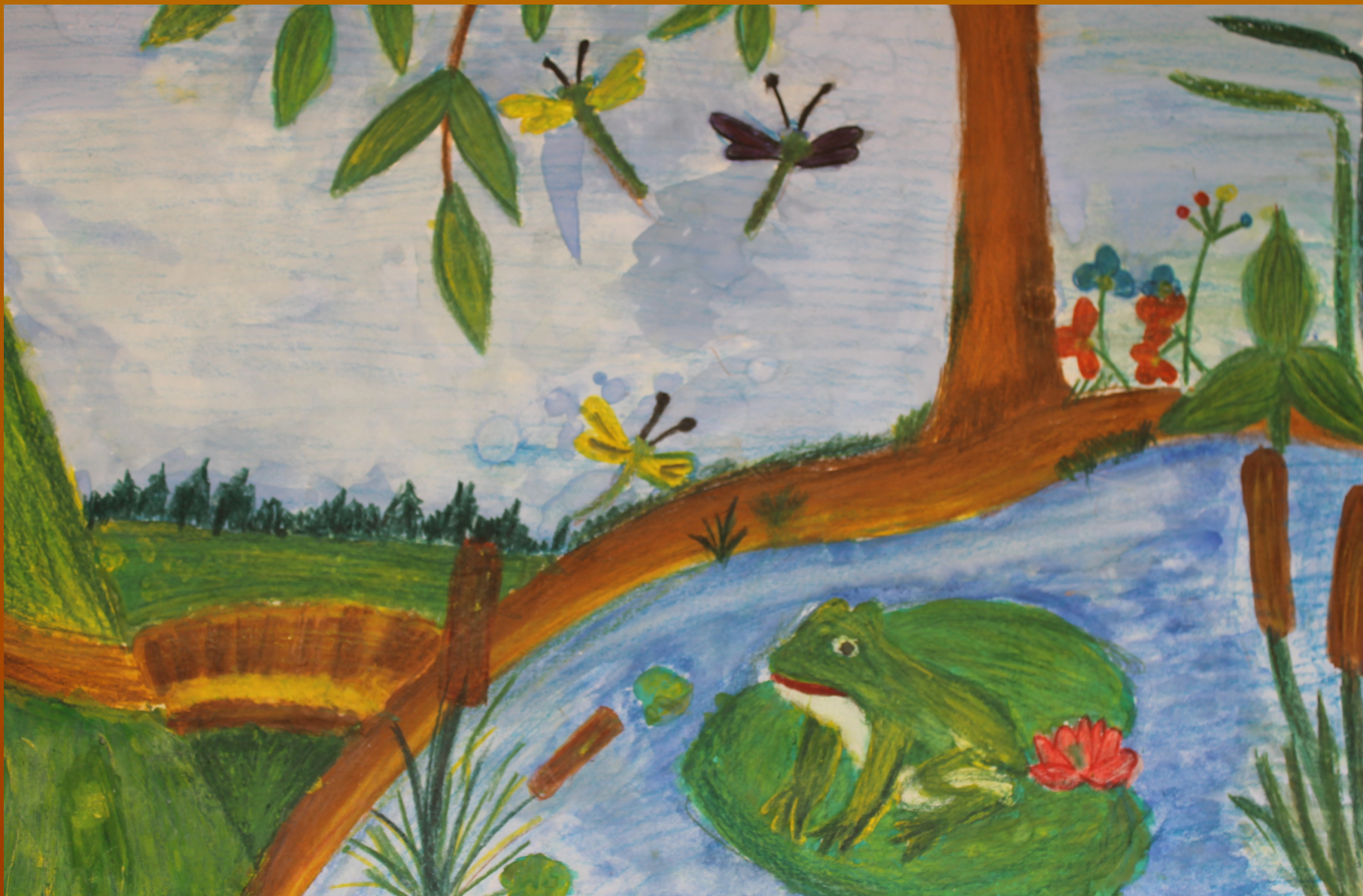
Рисунок Луциковой Анастасии к стихотворению Леонтьева А.К.