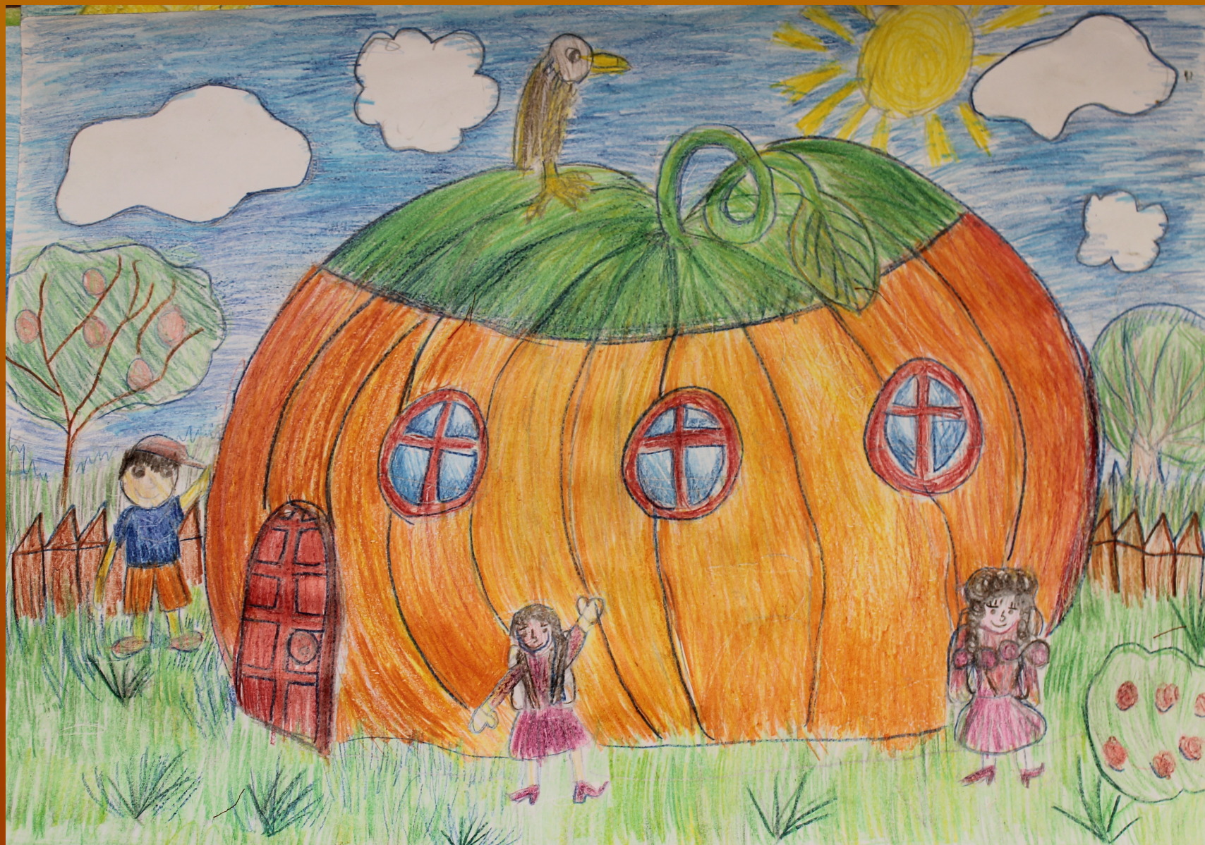
Рисунок Калининкова Валерия к стихотворениям Леонтьева А.К.