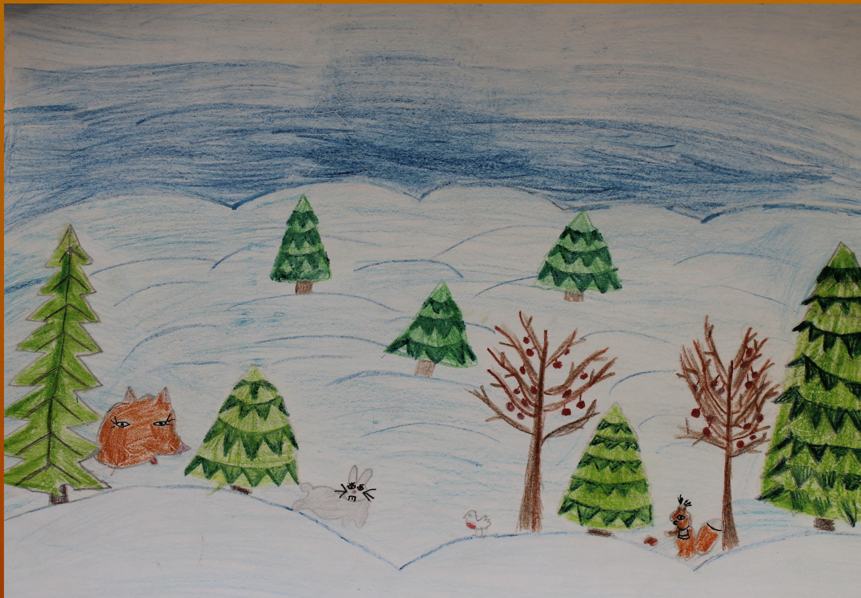
Рисунок Ивановой Вероники к стихотворению Леонтьева А. К.