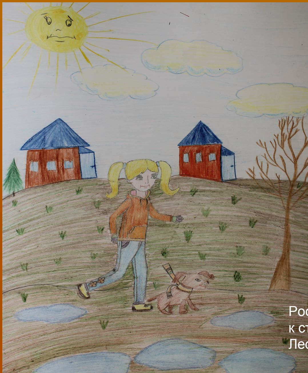
Рисунок Российских Эвелины к стихотворению Леонтьева А.К.