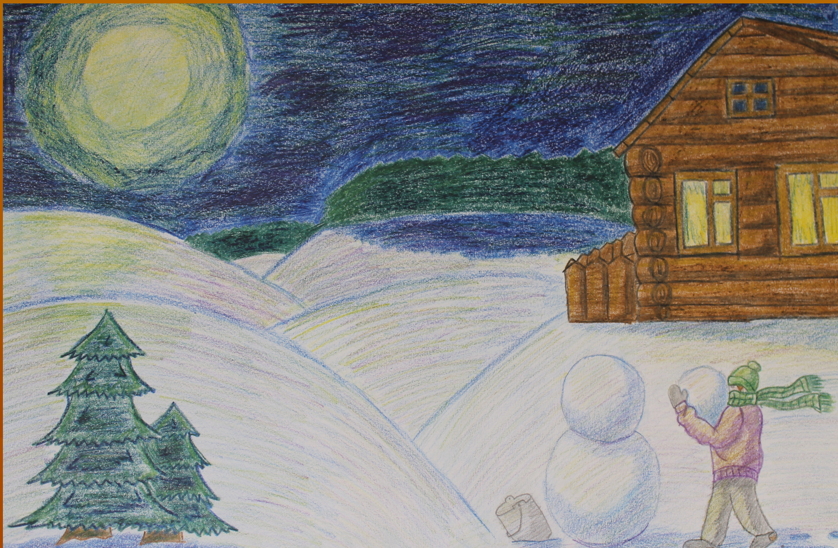
Рисунок Семакина Ивана к стихотворению Леонтьева А.К.