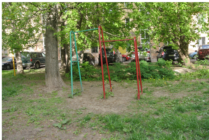
Рис. 3 Турник