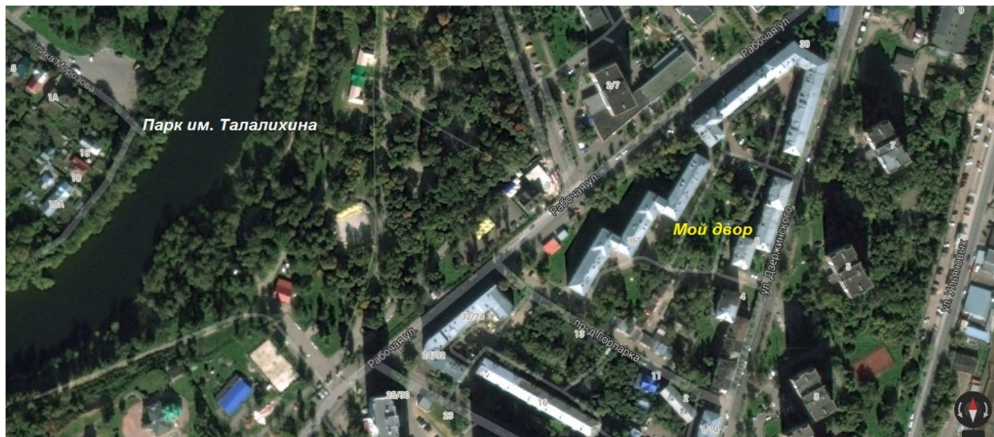
Рис. 1 Вид на двор со спутника

Мой двор очень старый. Он находится в Подольске, недалеко от городского парка имени Талалихина в домах, которые построили ещё до Великой Отечественной Войны. Вид на двор со спутника показан на рис. 1