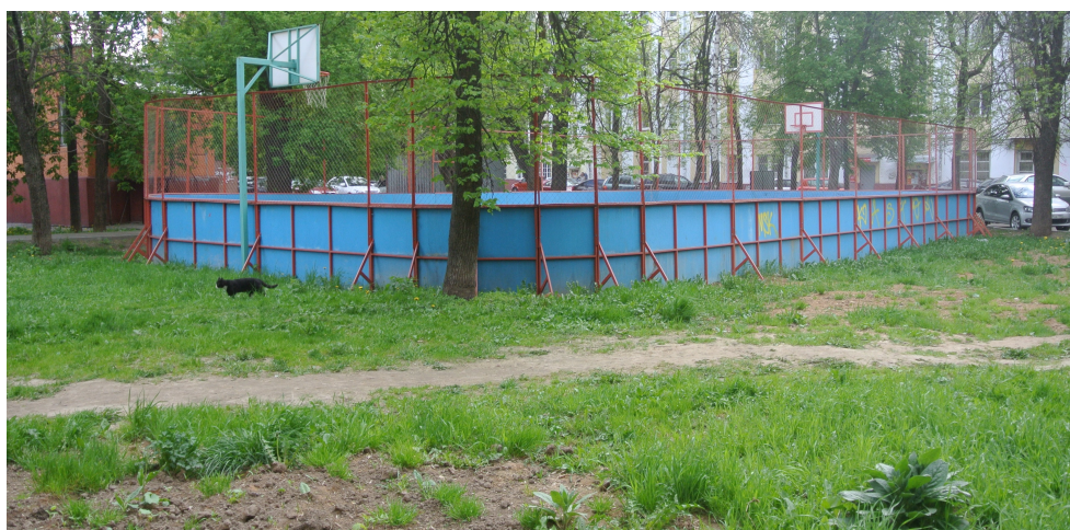
Рис. 7 Спортивная площадка