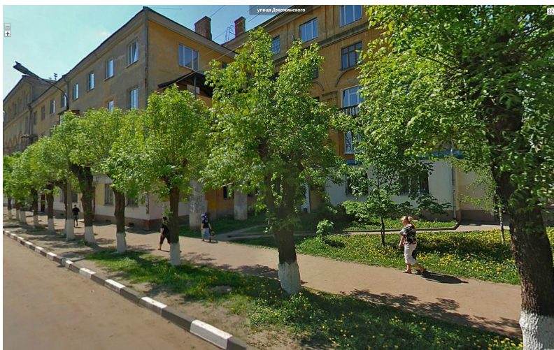
Рис. 9 Аллея тополей