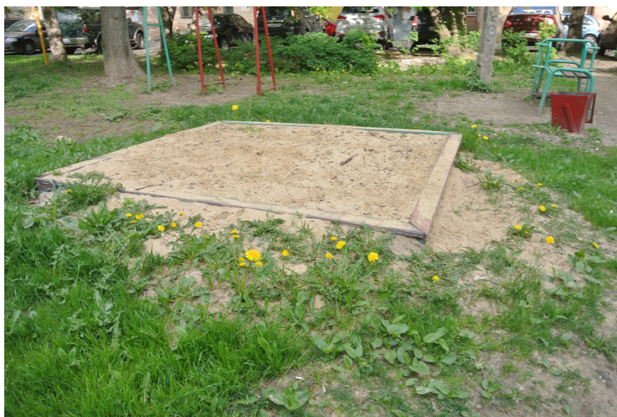
Рис. 5 Песочница