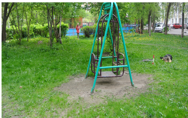
Рис. 2 Качели во дворе

Во дворе есть детская площадка. На площадке есть качели (рис.2), турник (рис. 3), горка (рис.4), песочница (рис.5), лестница (рис.6). Часть двора занимает спортивная площадка (рис. 7). Летом на ней играют в футбол, а зимой её заливают водой и получается каток.