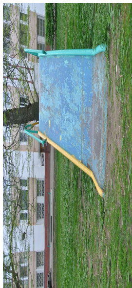
Рис. 4 Горка