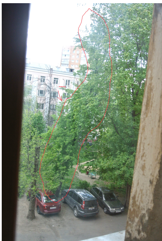
Рис. 8 Груша (выделена красным)

Я люблю свой двор! Пусть он старый и кому-то покажется некрасивым, зато в моём дворе за столько лет выросло очень много мальчишек и девчонок, которые стали уже бабушками и дедушками. Не каждый двор может похвастаться такой большой семьёй.