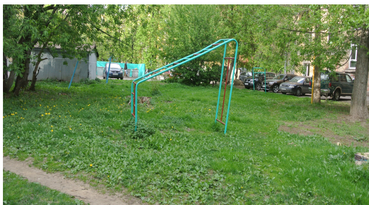
Рис. 6 Лестница