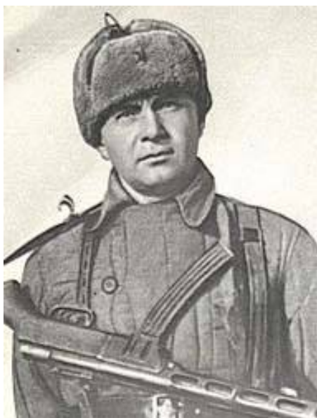
Майор Цезарь Куников

Командиром вспомогательного отряда был назначен майор Куников Цезарь Львович.