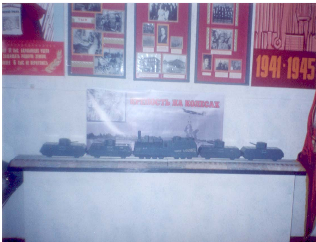
поезд «Сибиряк - барабинец»