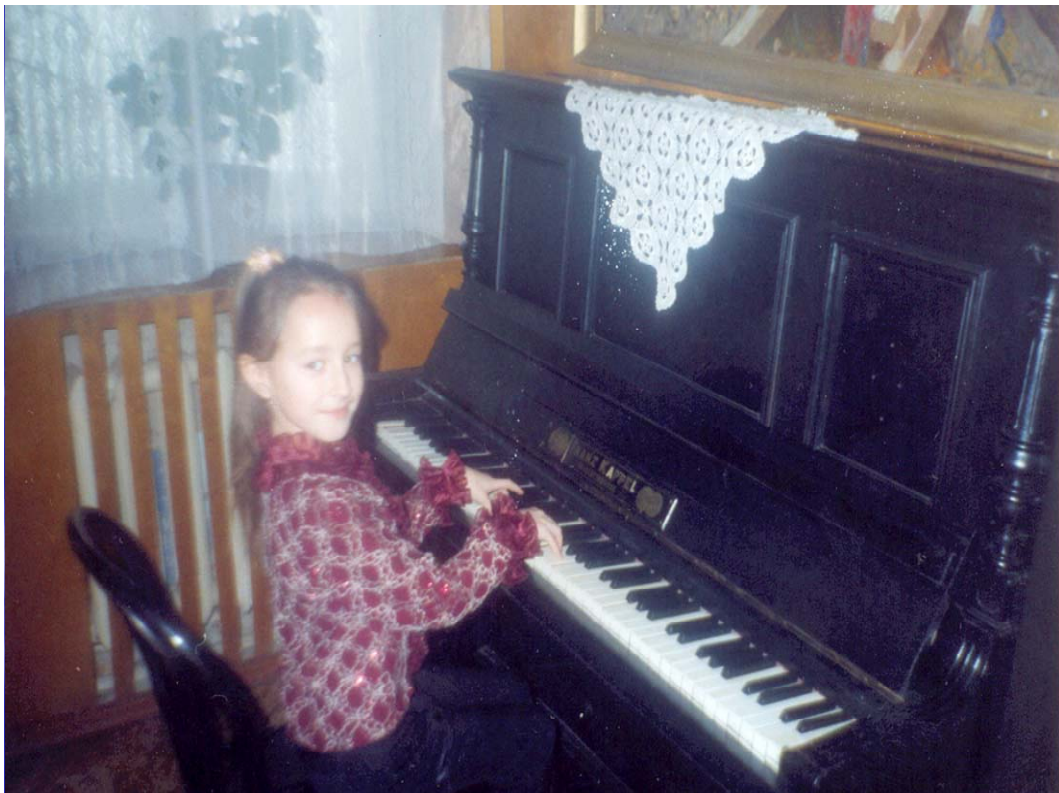
за немецким фортепиано