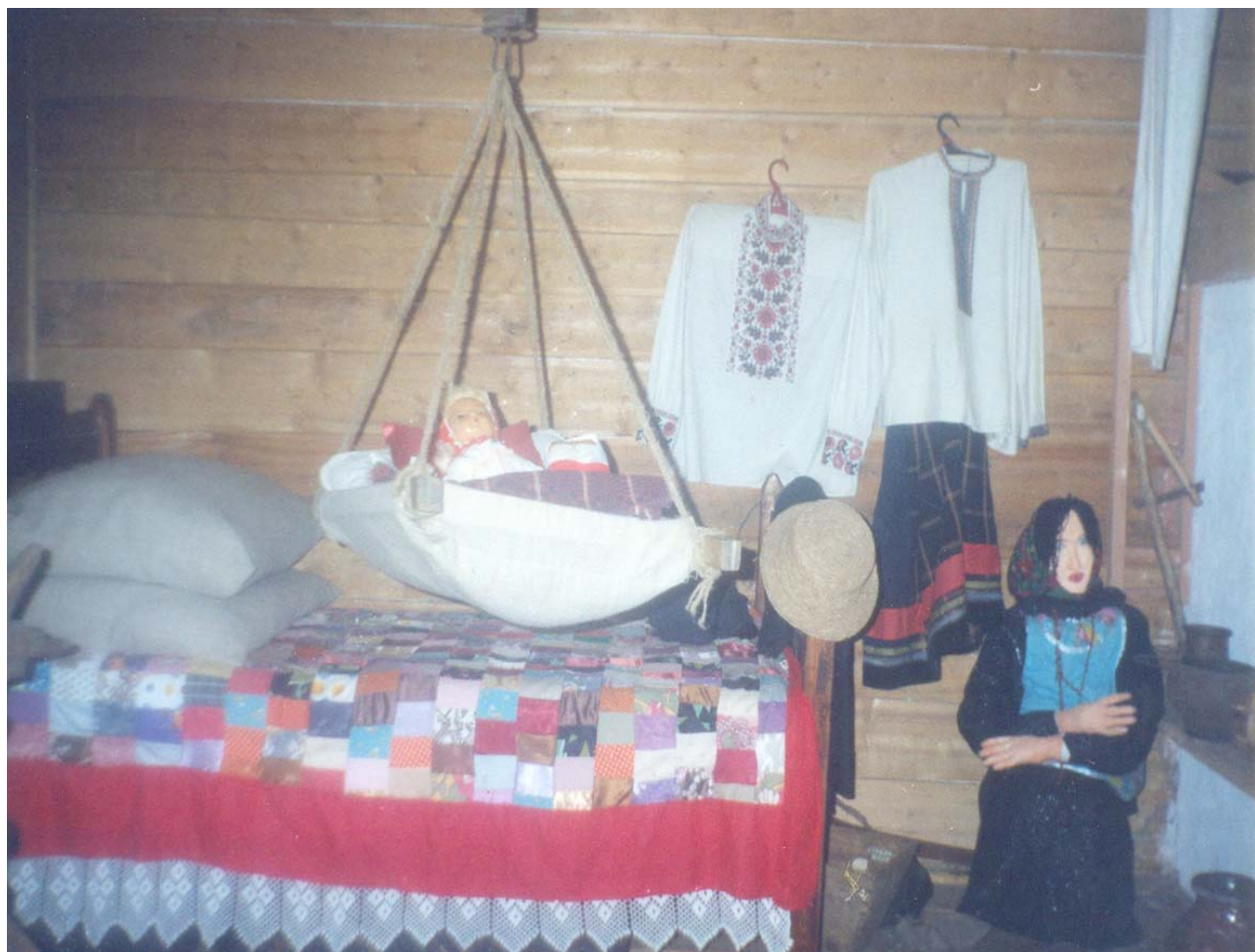
В крестьянской горнице