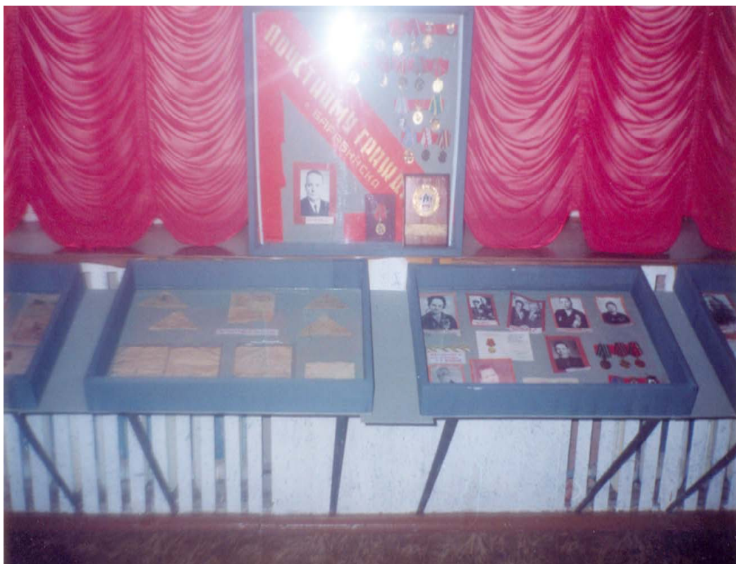
награды и письма фронтовиков