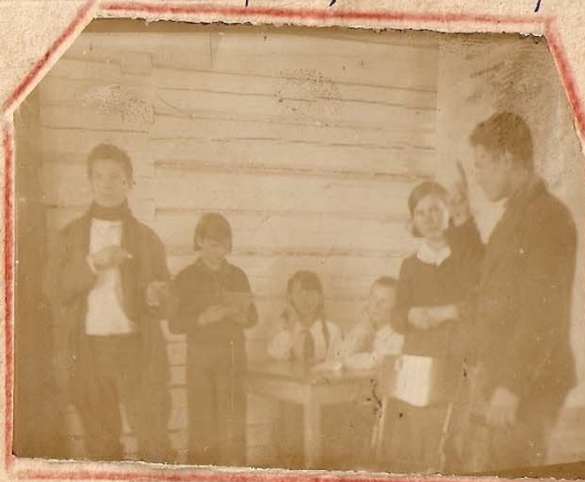
На репетиции драматического кружка