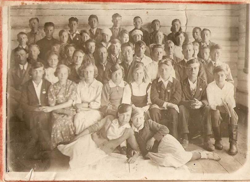
Подколлектив и учащиеся 7 х классов.