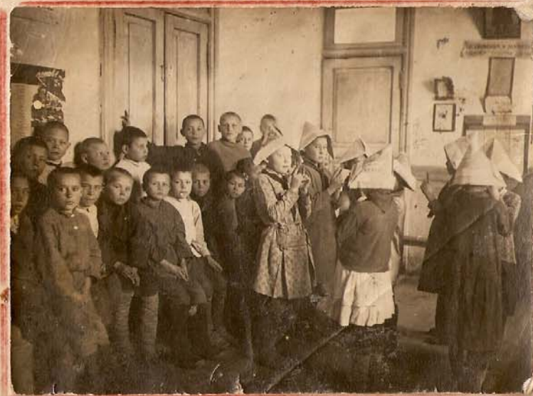
Выступление затейников на большой перемене в начальной школе.