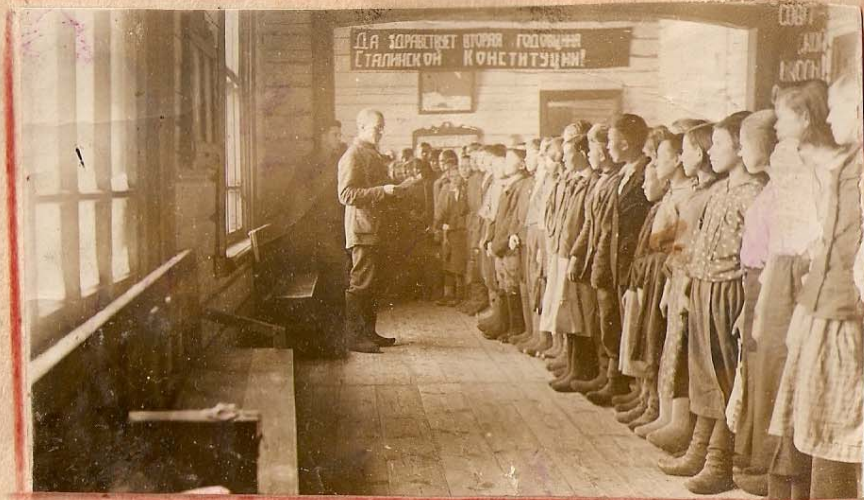
Подведение итогов за неделю.