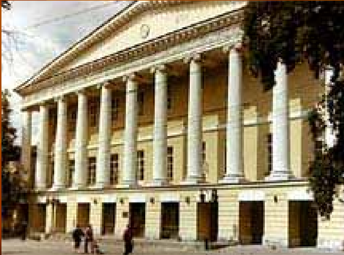
М.Ф.Казаков. Бывший дом Гагариных (Екатерининская больница) у Петровских ворот в Москве.

Классицизм связан с Просвещением. Ему присущи чёткость и геометризм форм, логичность планировки, сочетание гладкой стены с ордером и сдержанным декором.