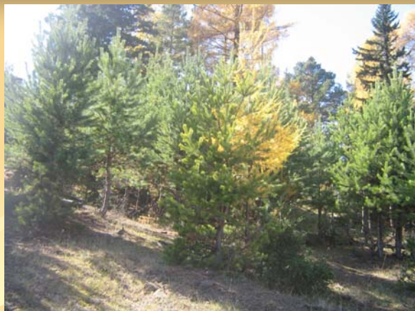
Осенний лес полон спелых плодов