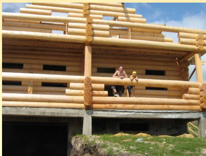
Строительство нового дома