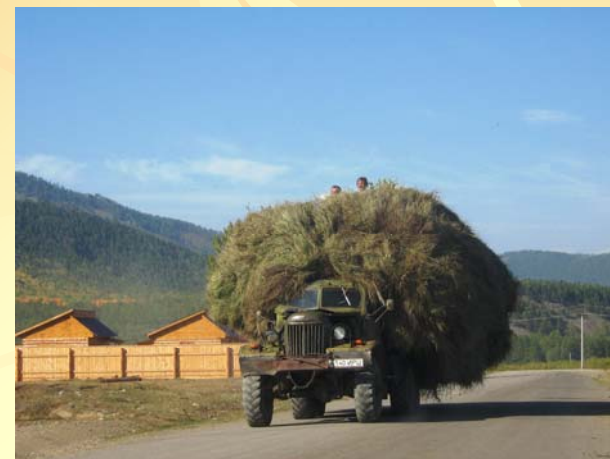
Привоз сена домой