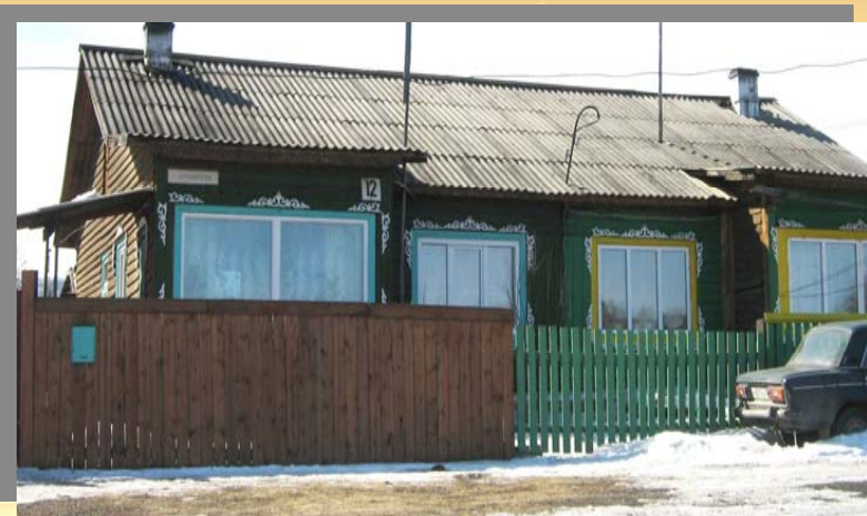
Дом с деревянными узорами