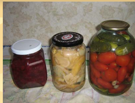
Заготовки на зиму