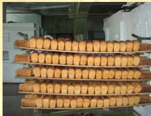
Теплый свежий хлеб