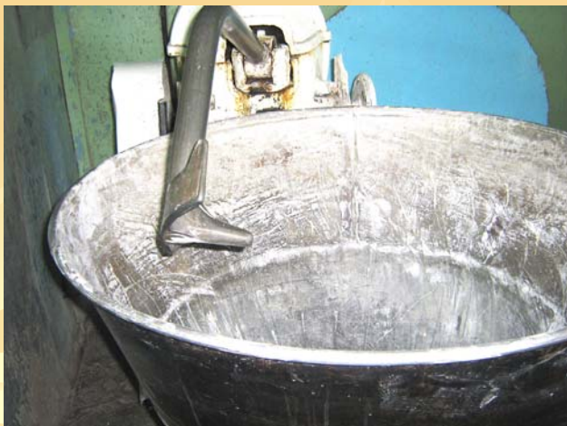
Емкость для теста