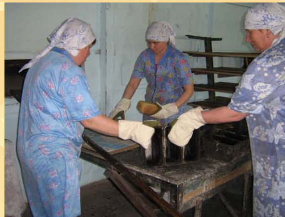
Выемка хлеба из форм