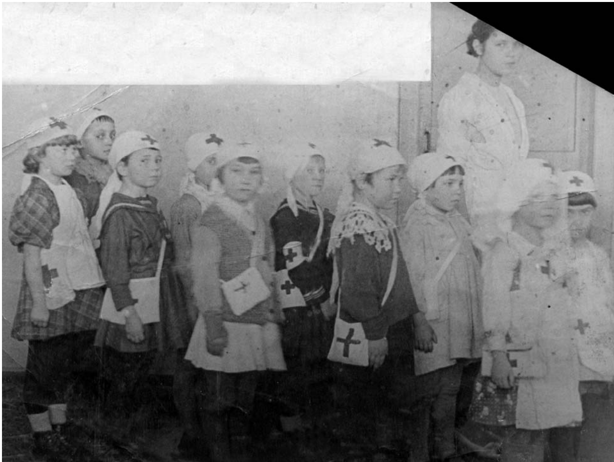
Детский сад. г. Энгельс. 1941 г.