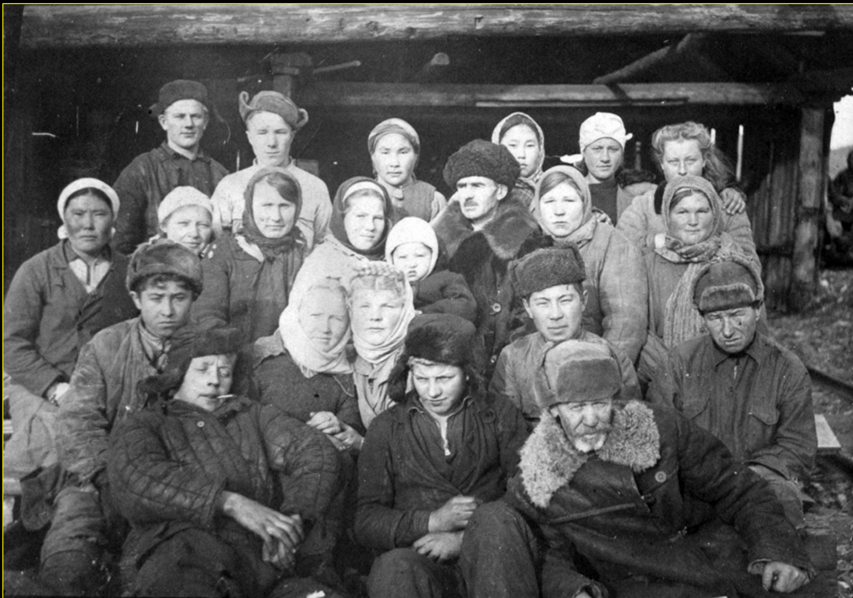
Уйбатский леспромхоз. 1945 г.