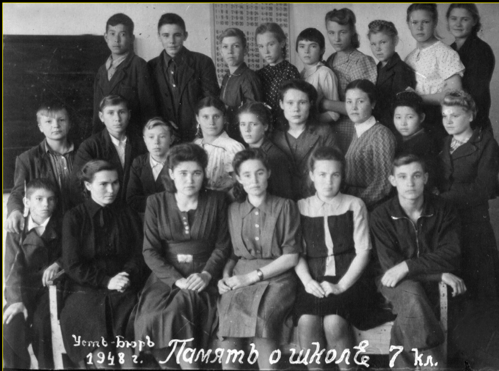
7 класс. Усть-Бюрь. 1948 г.