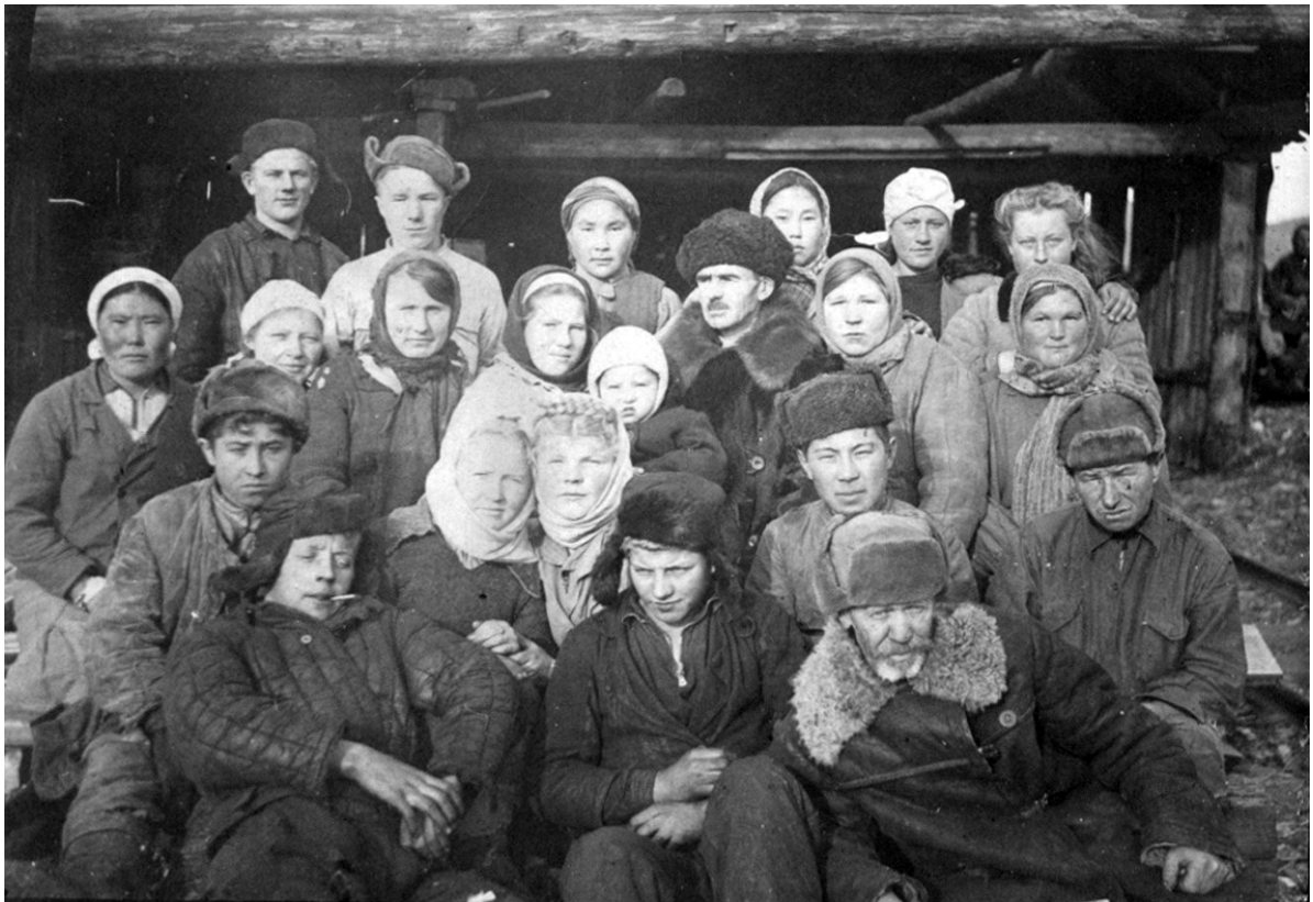
Уйбатский леспромхоз. 1945 г.