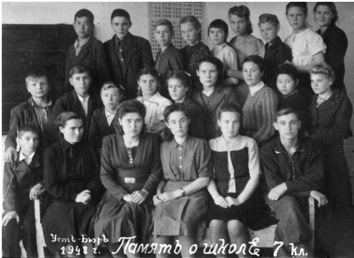
7 класс. Усть-Бюрь. 1948 г.