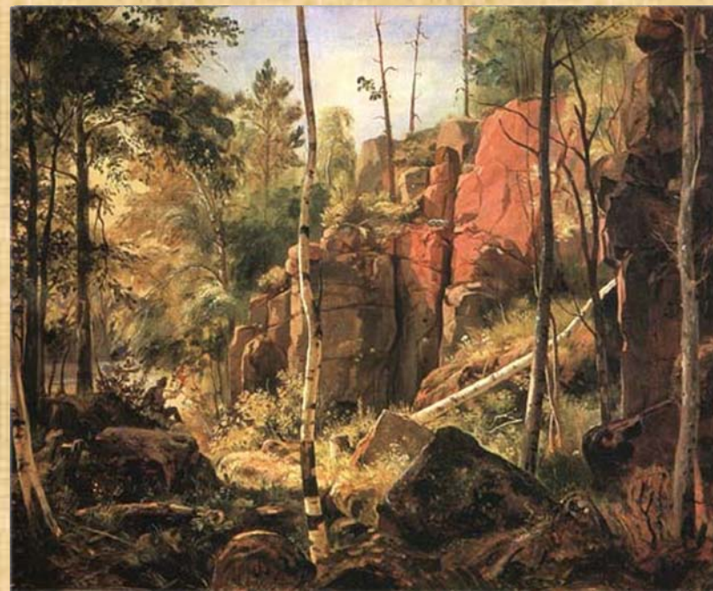
Вид на острове Валааме