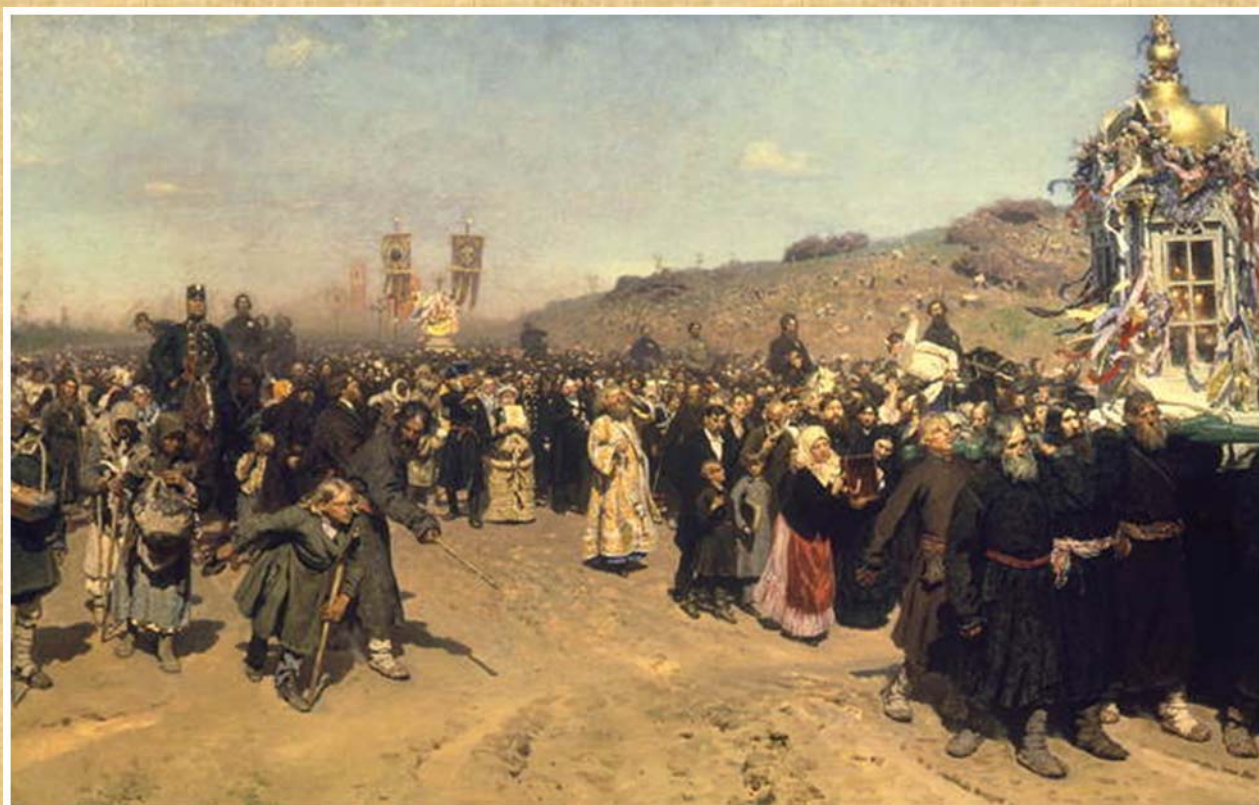
Крёстный ход в Курской губернии