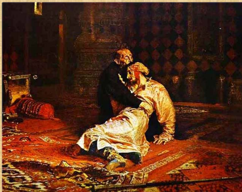
Царь Иван Грозный и сын его Иван