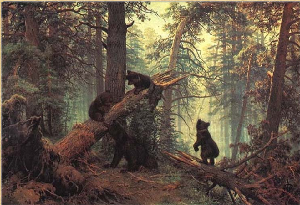
Утро в сосновом лесу