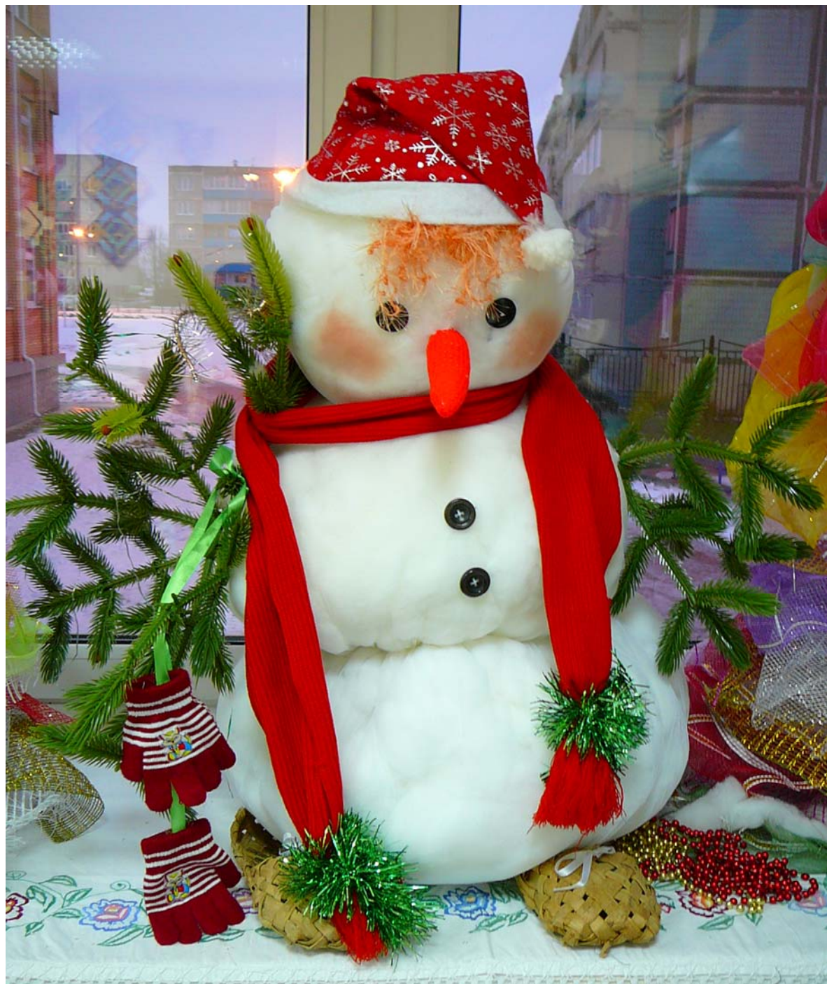
Снеговик ( тюль+синтепон)