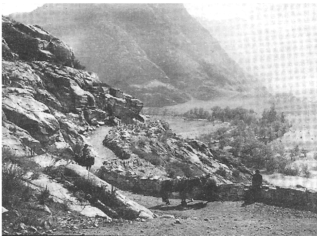
Старый Чуйский тракт. Фото начала XX века.