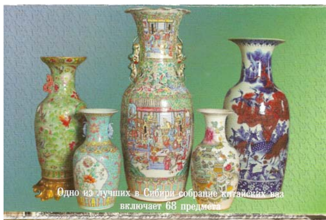
Одно из лучших в Сибири собрание китайских ваз включает 68 предметов