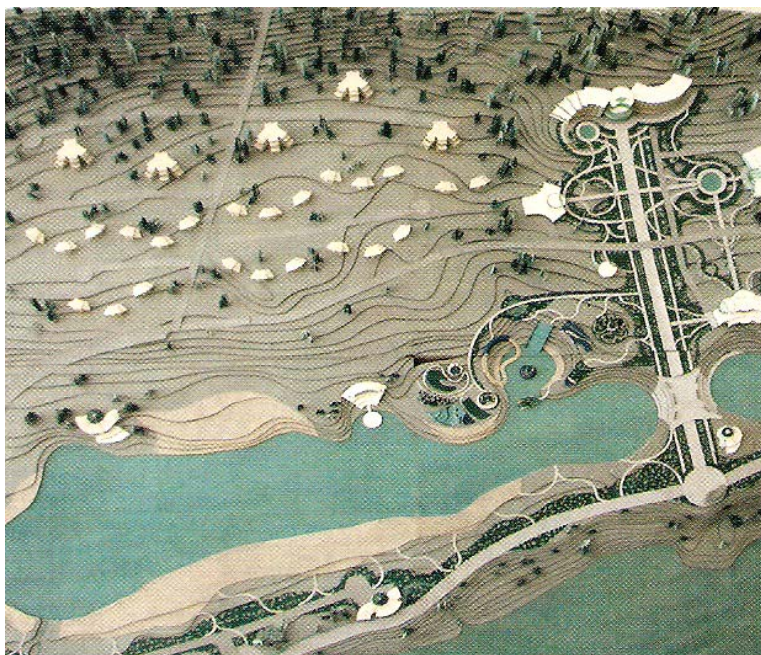
«Бирюзовая Катунь». Большое искусственное озеро с тёплой водой и пляжем, рассчитанным на 3,5 – 4 тысячи человек.