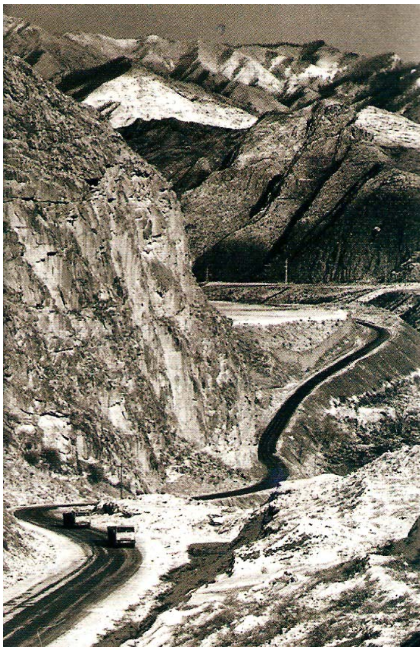
Современный Чуйский тракт.