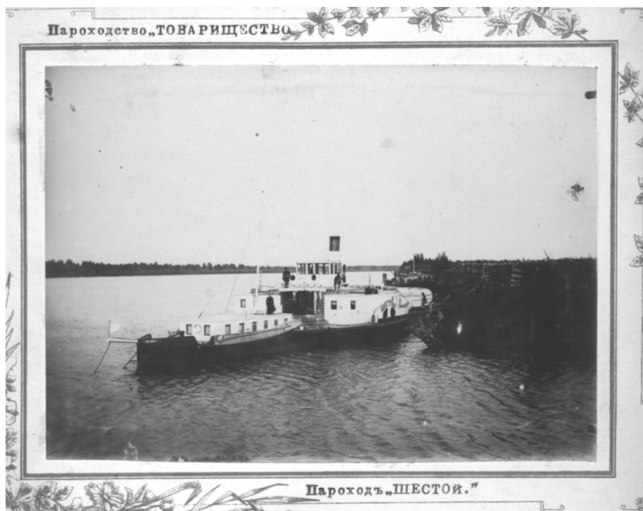
Пароход купцов Морозовых.