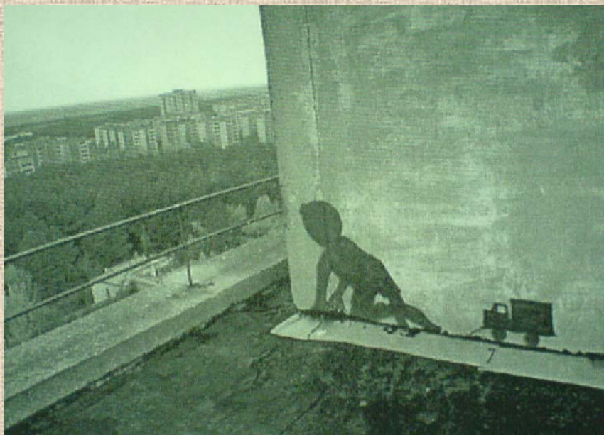
Рисунок граффитера - чернобыльца. Ребенок, который смотрит в мертвый город.