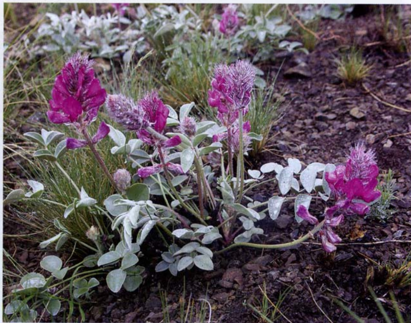
Копеечник серебристолистный (редкое растение)