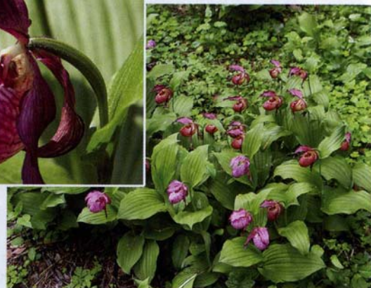
Венерин башмачок вздутый (редкое рас- тение)