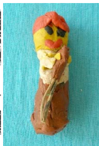
Романовская Ярослава (пластилин)