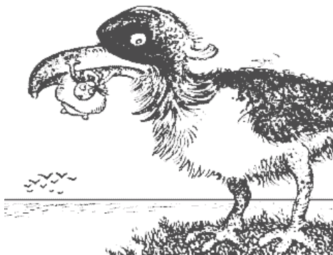
Путаница Бабы Яги...Ребята, что вы здесь видите?