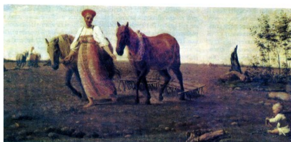
А. Венецианов. Весна. На пашне.