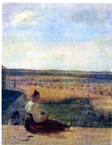
А. Венецианов. На жатве