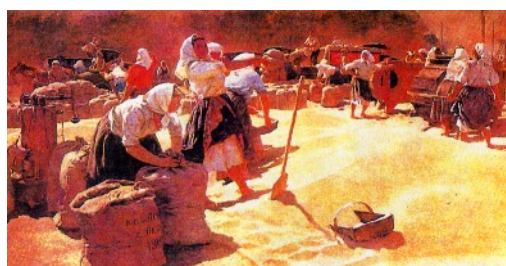
Г. Яблонский Хлеб.