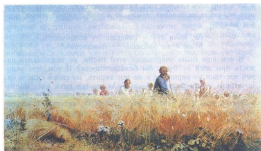
Г. Мясоедов «Страдная пора (Косцы)».