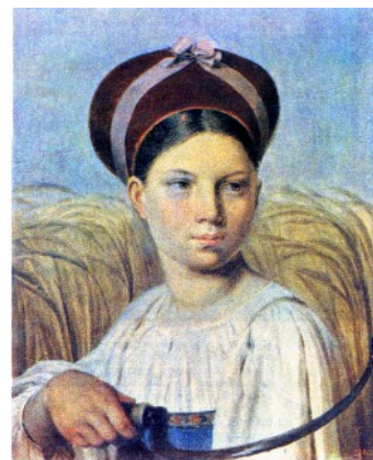
А. Венецианов. Жница