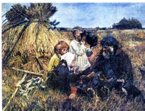
А. Пластов. Жатва