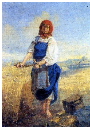
В. Васнецов. Жница