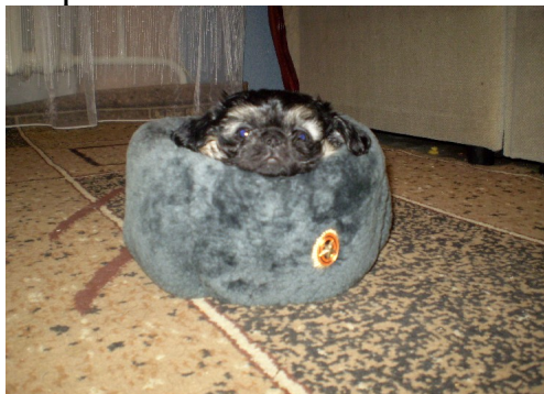
Мерин сынок в папиной шапке.