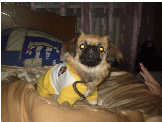
Мери собирается на прогулку.