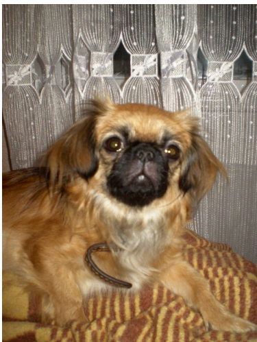
Мери отдыхает после прогулки.