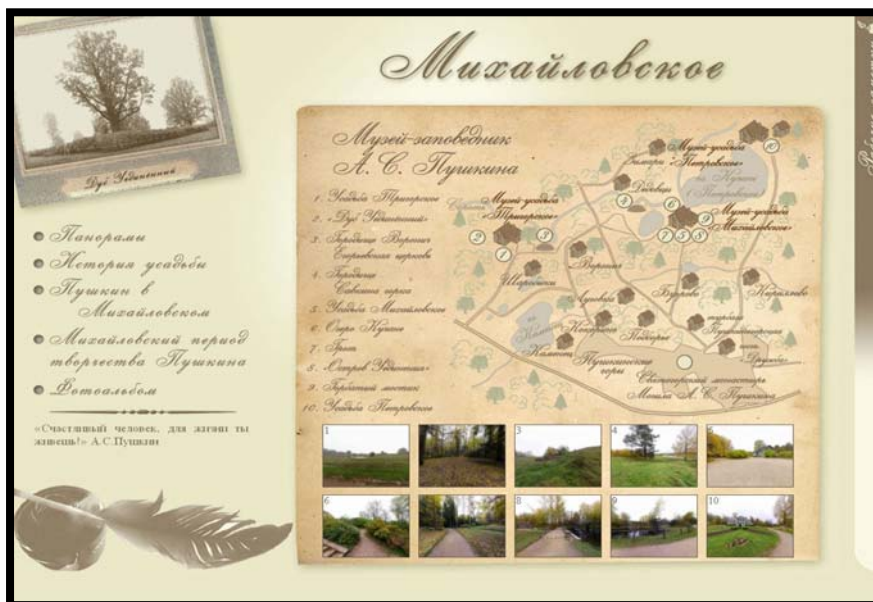
Карта Пушкинских гор.

Сегодня я приглашаю вас в увлекательное путешествие по Пушкинским местам. Это сёла: Тригорское, Петровское и Михайловское, а так же Святогорский монастырь, возле которого захоронен прах А. С. Пушкина. Добраться до Святых Пушкинских гор можно так: с Ленинградского вокзала ехать на поезде до города Пскова, а затем на автобусе до Святогорья. Разместимся в гостинице «Дружба» (на весь микрорайон она одна), или на турбазе.