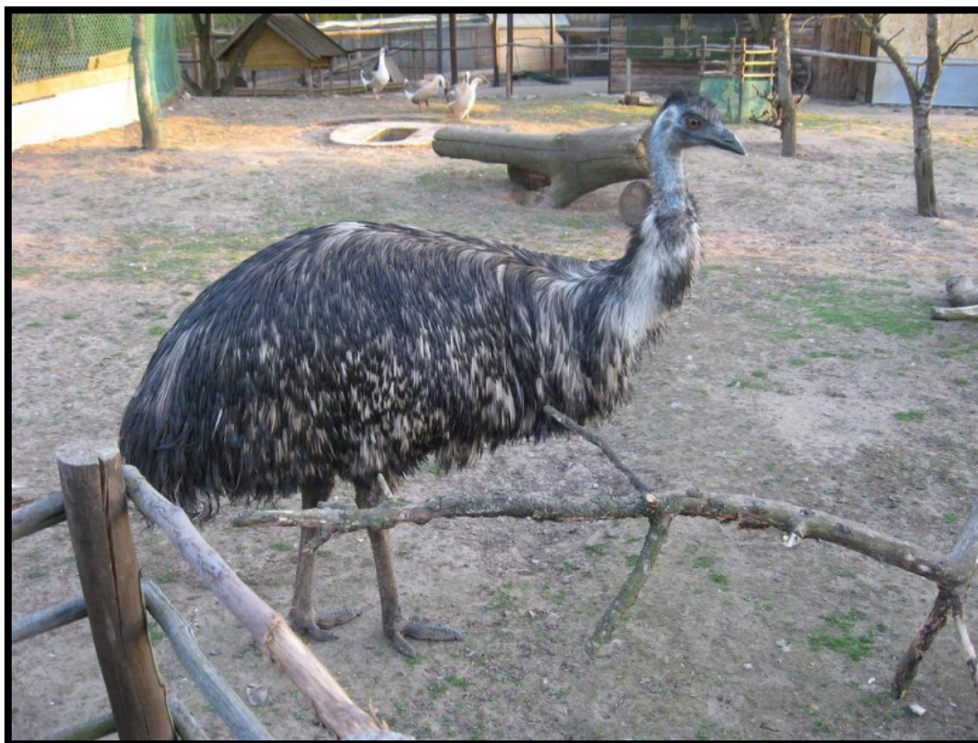
Ручной страус Кузя.