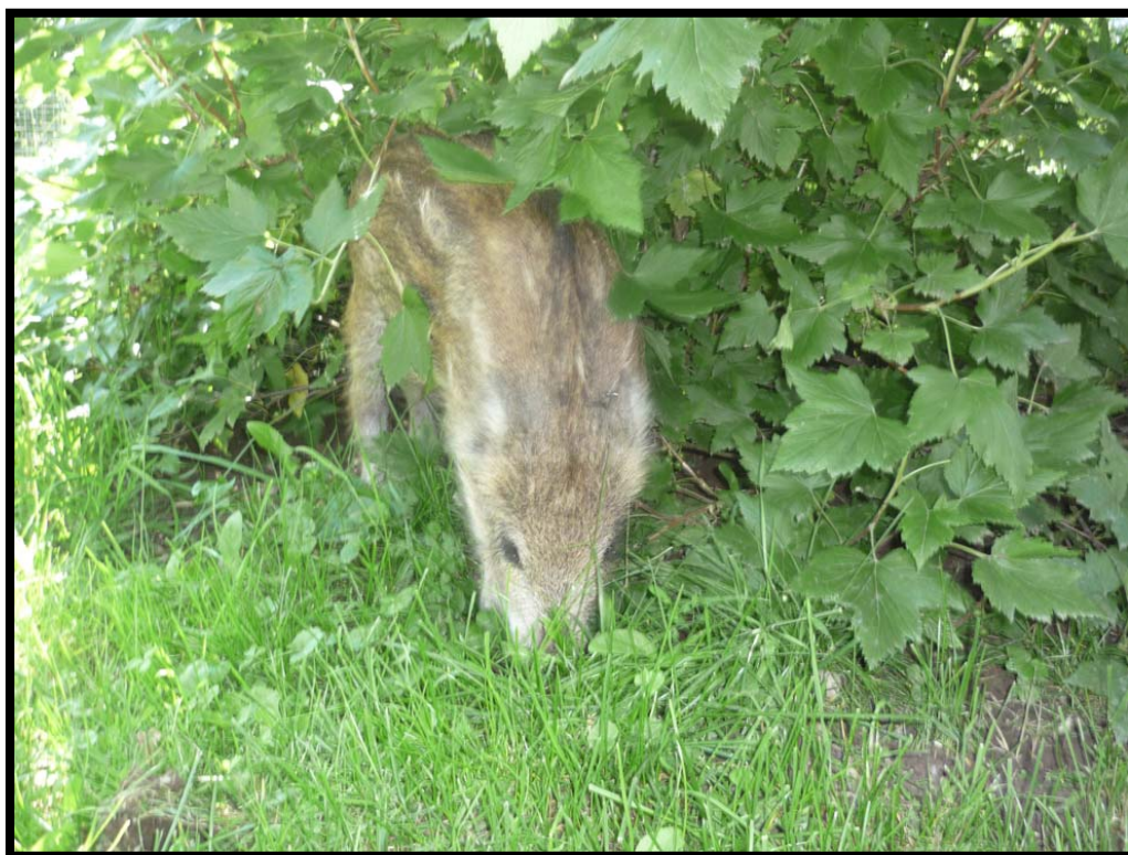
Лесной кабанчик Чуня.