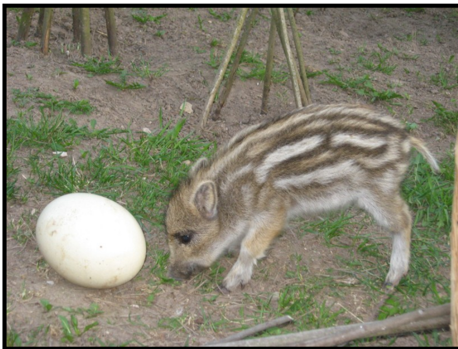
Чуня и страусиное яйцо.