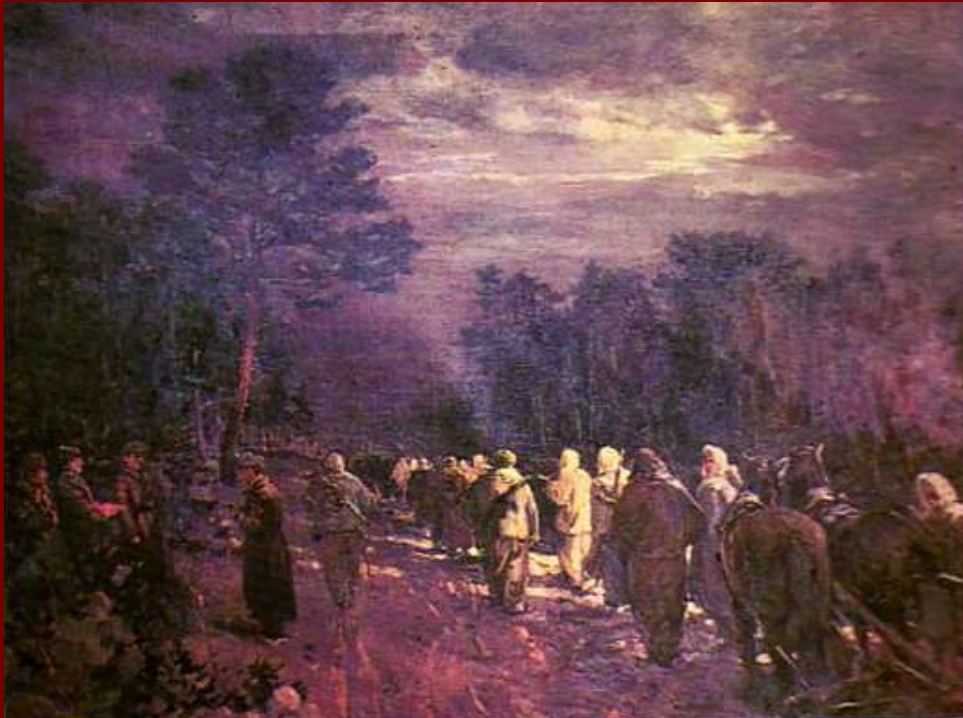
В тыл к противнику. На боевое задание 1947 год холст. масло

Плескалось багровое знамя, горели багровые звёзды, слепая пурга накрывала багровый от крови закат, и слышалась поступь дивизий, великая поступь дивизий, железная поступь дивизий, точная поступь солдат!