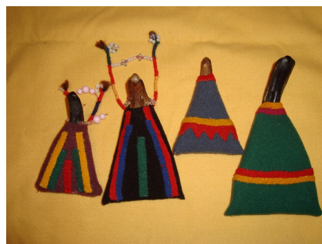
Куколки в летней одежде.