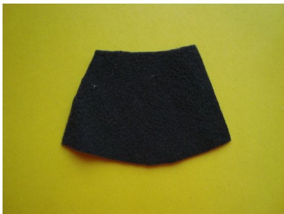
3. Вырезать из ткани внутреннюю деталь.