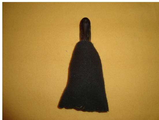
4. Пришить внутреннюю деталь к клювику.