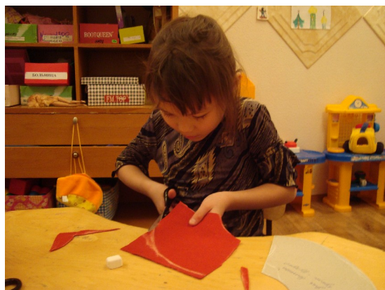
5. Скроить основу одежды, рукава, полосы для орнаментов и орнаменты.