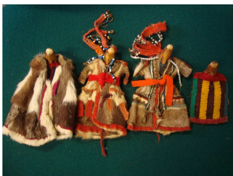
Старинные ненецкие куклы