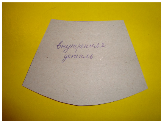
1. Трафарет внутренней детали