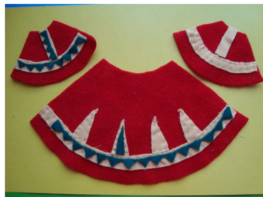
6. Пришить полосы с орнаментами к основе одежды и рукавам.