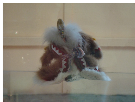
Куколка – нухуко в зимней одежде ягушка