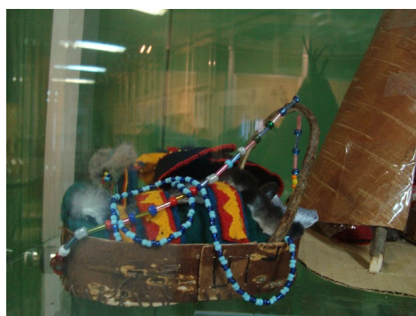
Куколка в колыбели