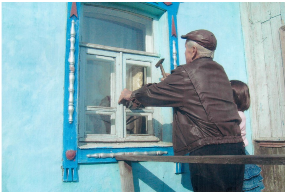
У дедушки новая задумка.