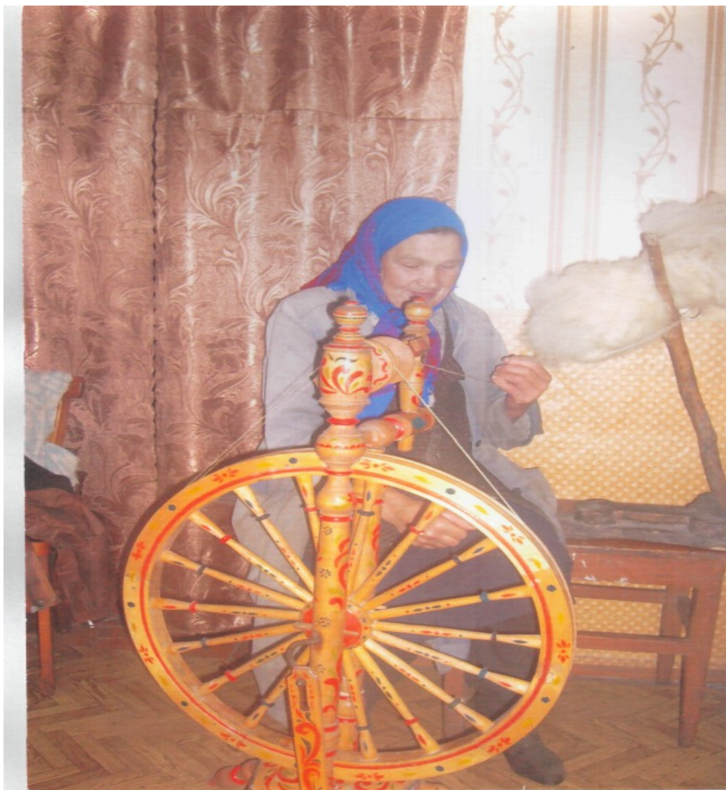
Прялка в работе.