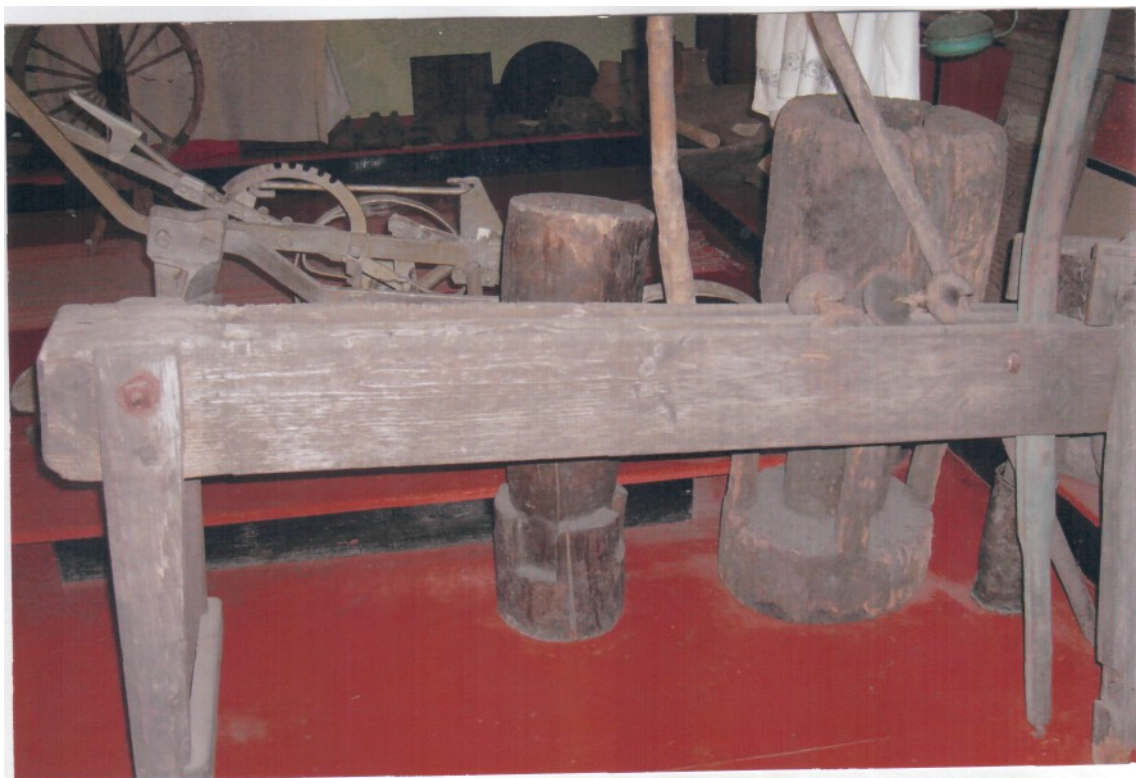
Валяльный станок для изготовления валенок.