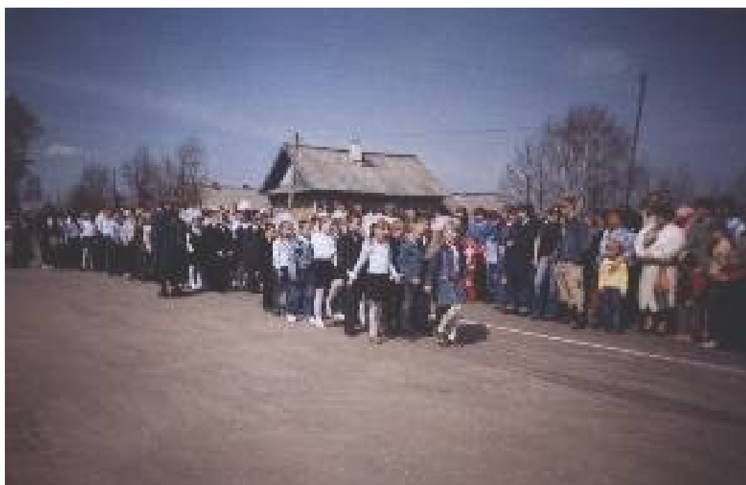
Смотр строя и песни.