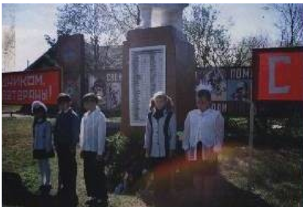
Первый караульный пост у памятника.