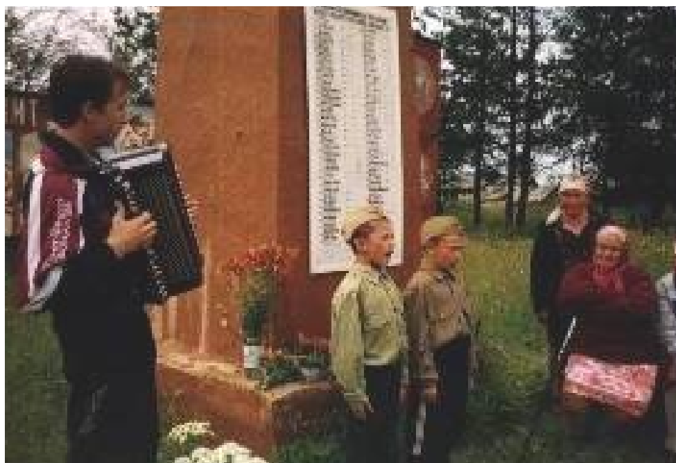
Смотр военной песни.