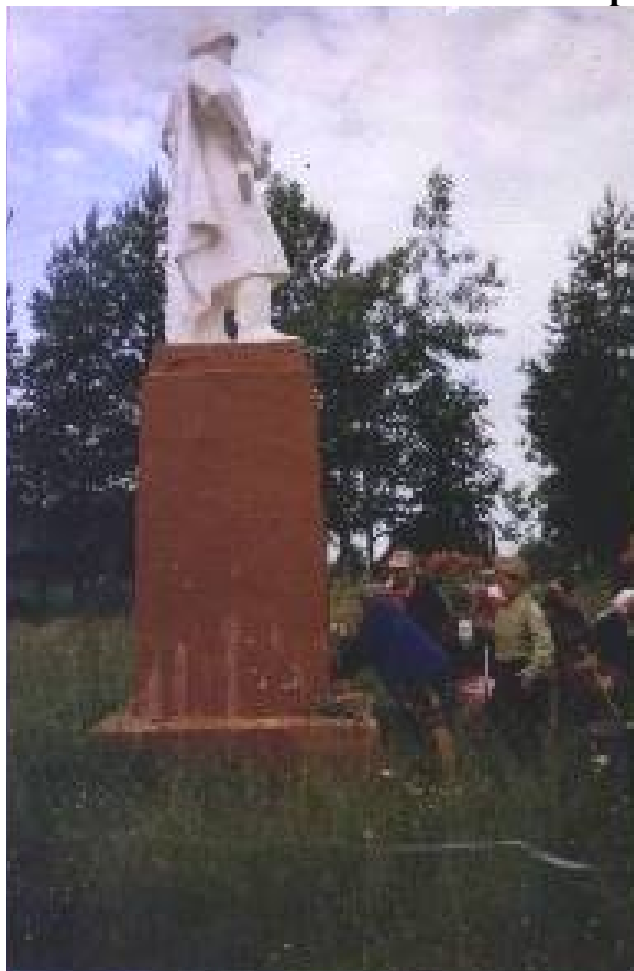
Открытие памятника в п. Зебляки.