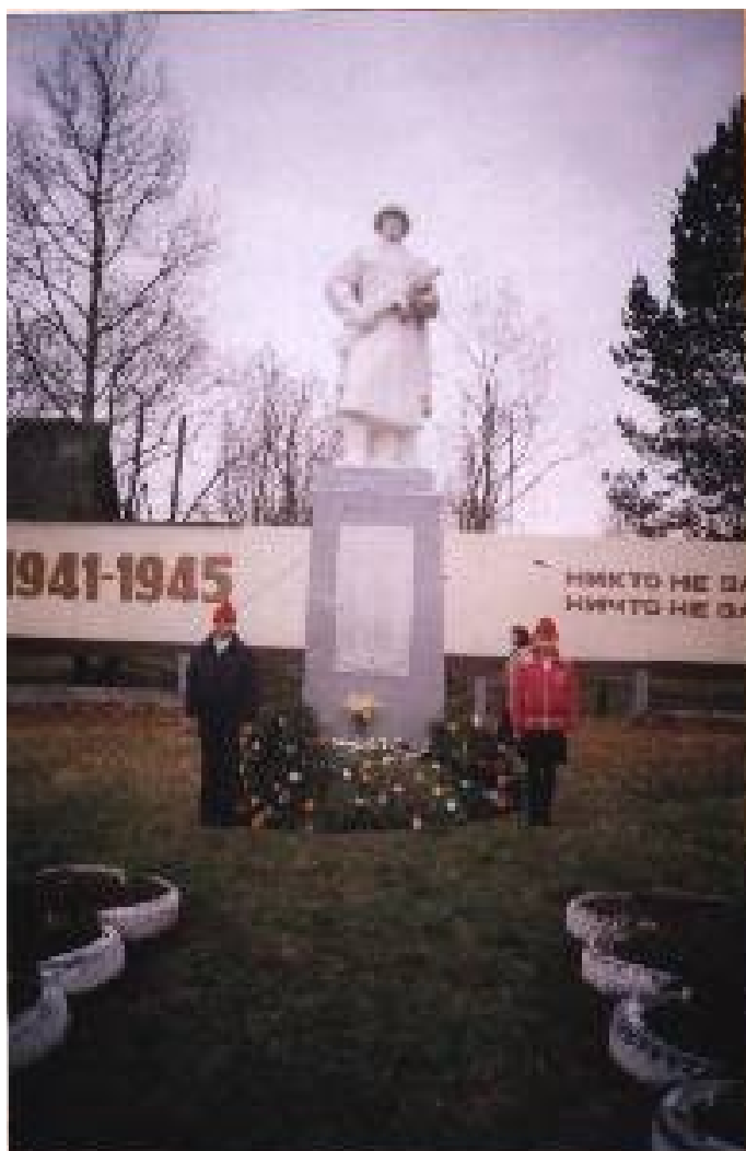
Караул у памятника.