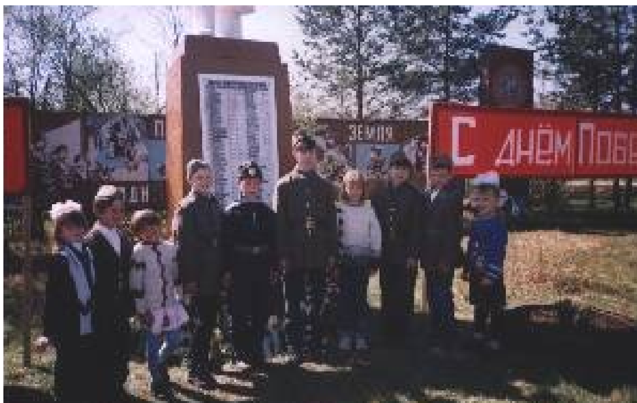
Будущие защитники России.