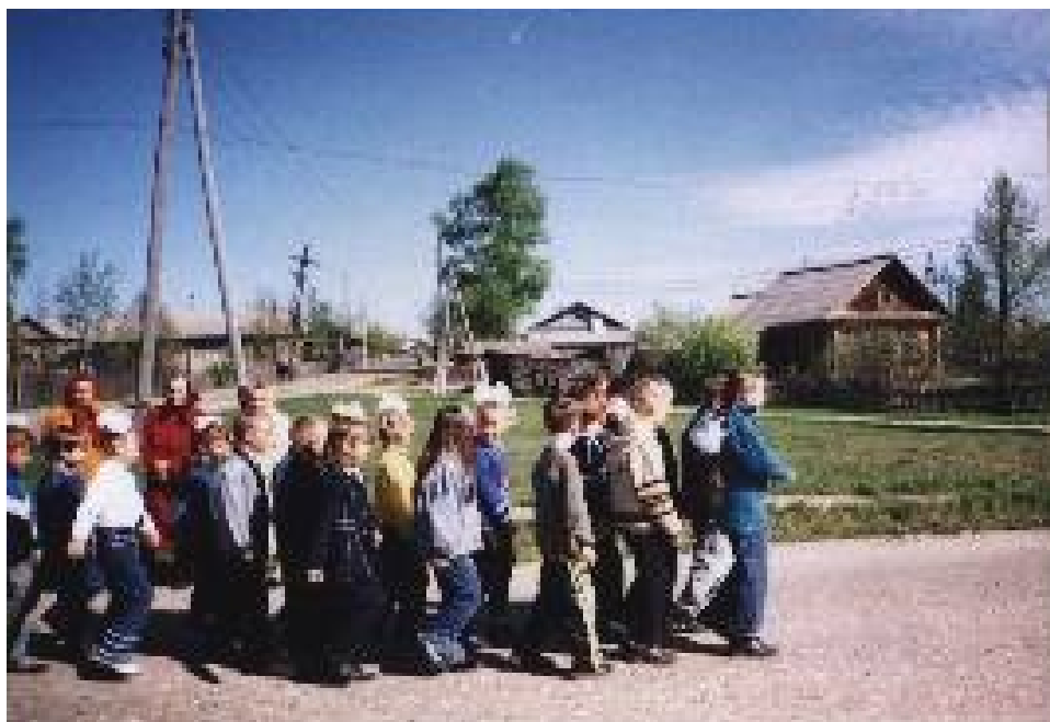
Смотр строя и песни.