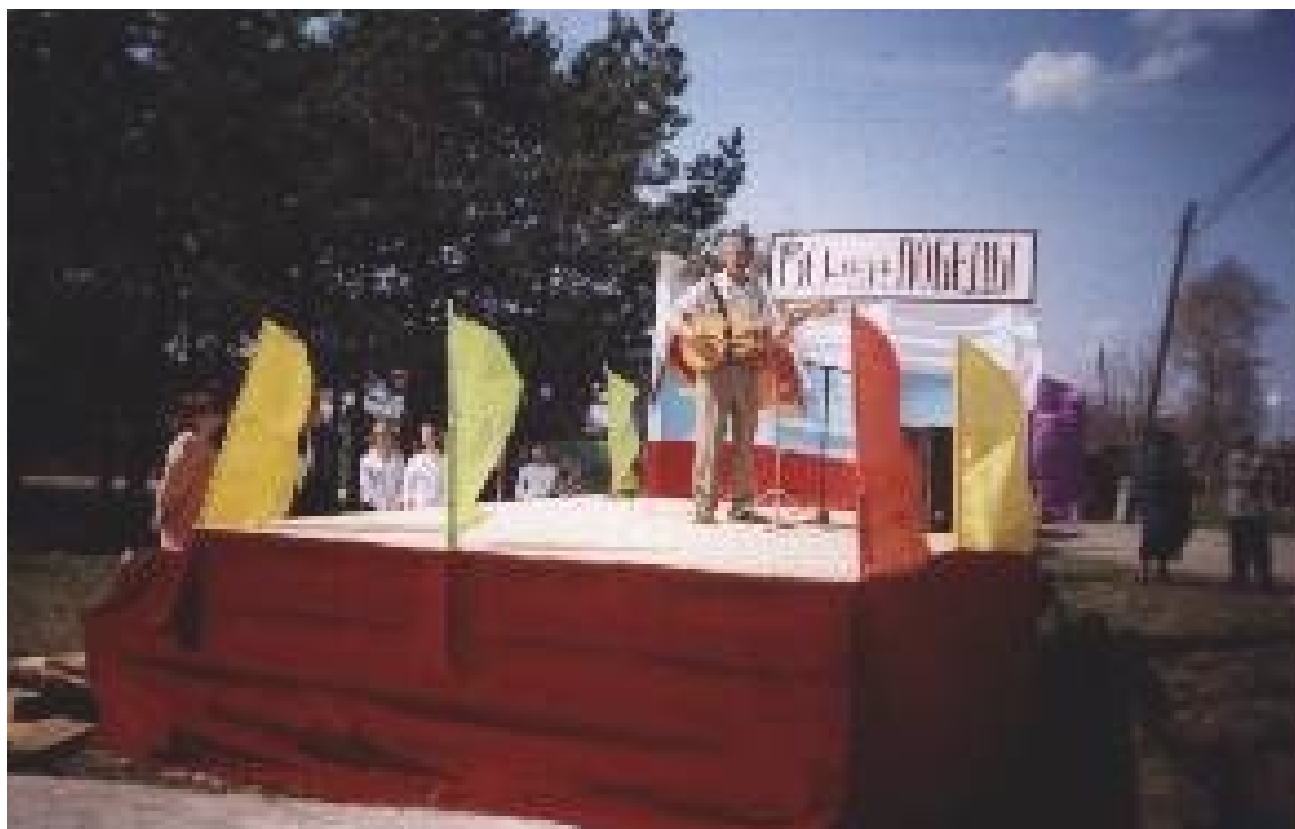
Концерт на митинге.