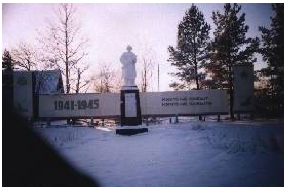
Памятник после подкраски и ремонта сквера.