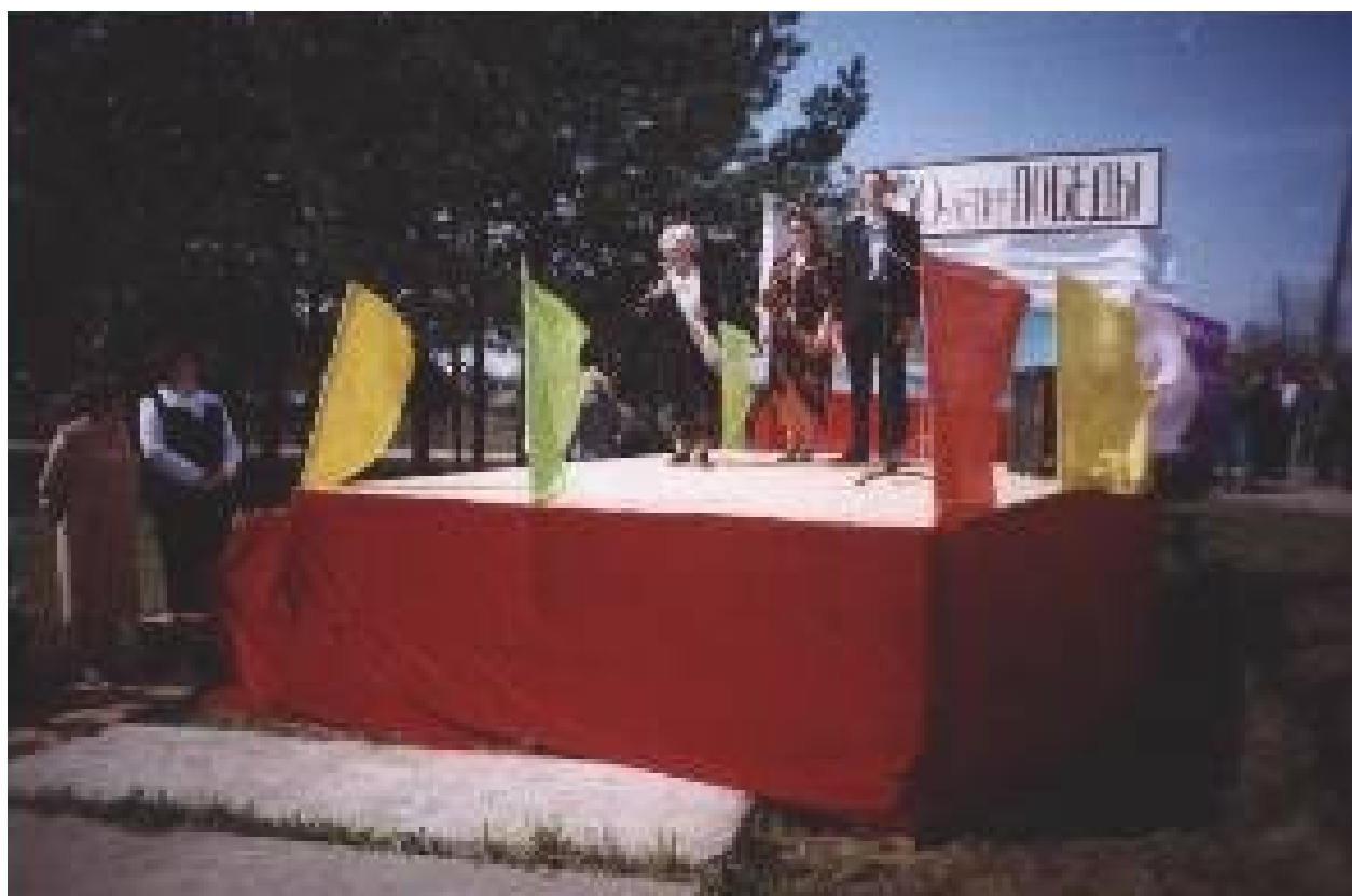
Митинг у памятника погибшим воинам.