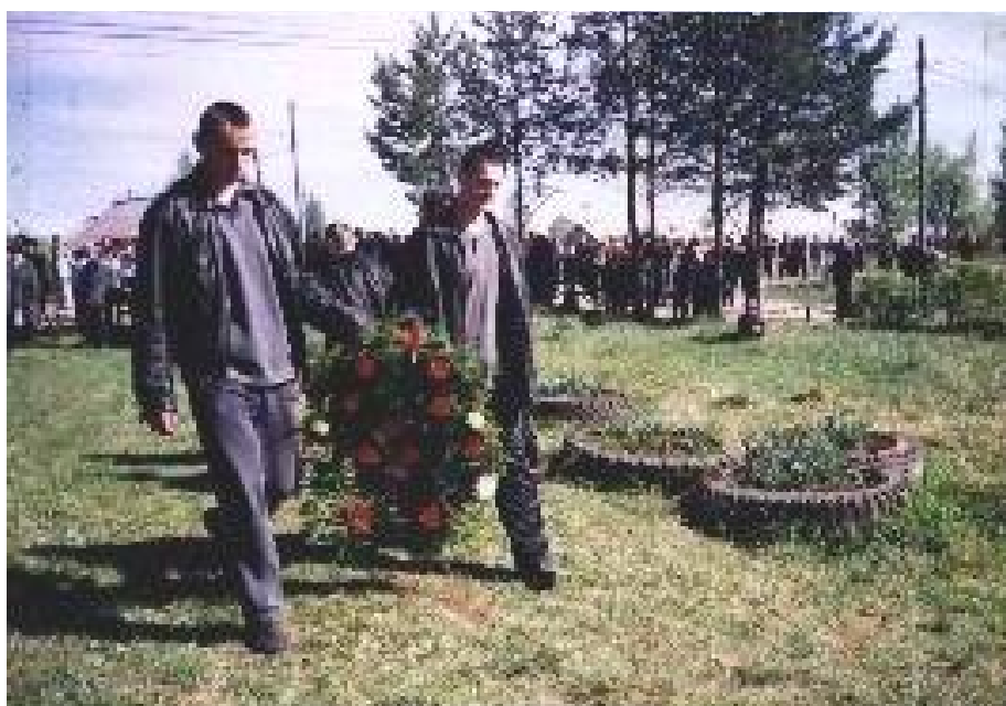
Возложение венков к памятнику.