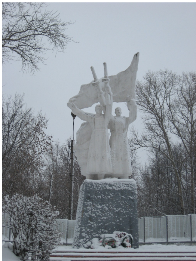
Мемориальный комплекс, посвященный подвигу воинов-шарьинцев ул. Октябрьская, д.8.