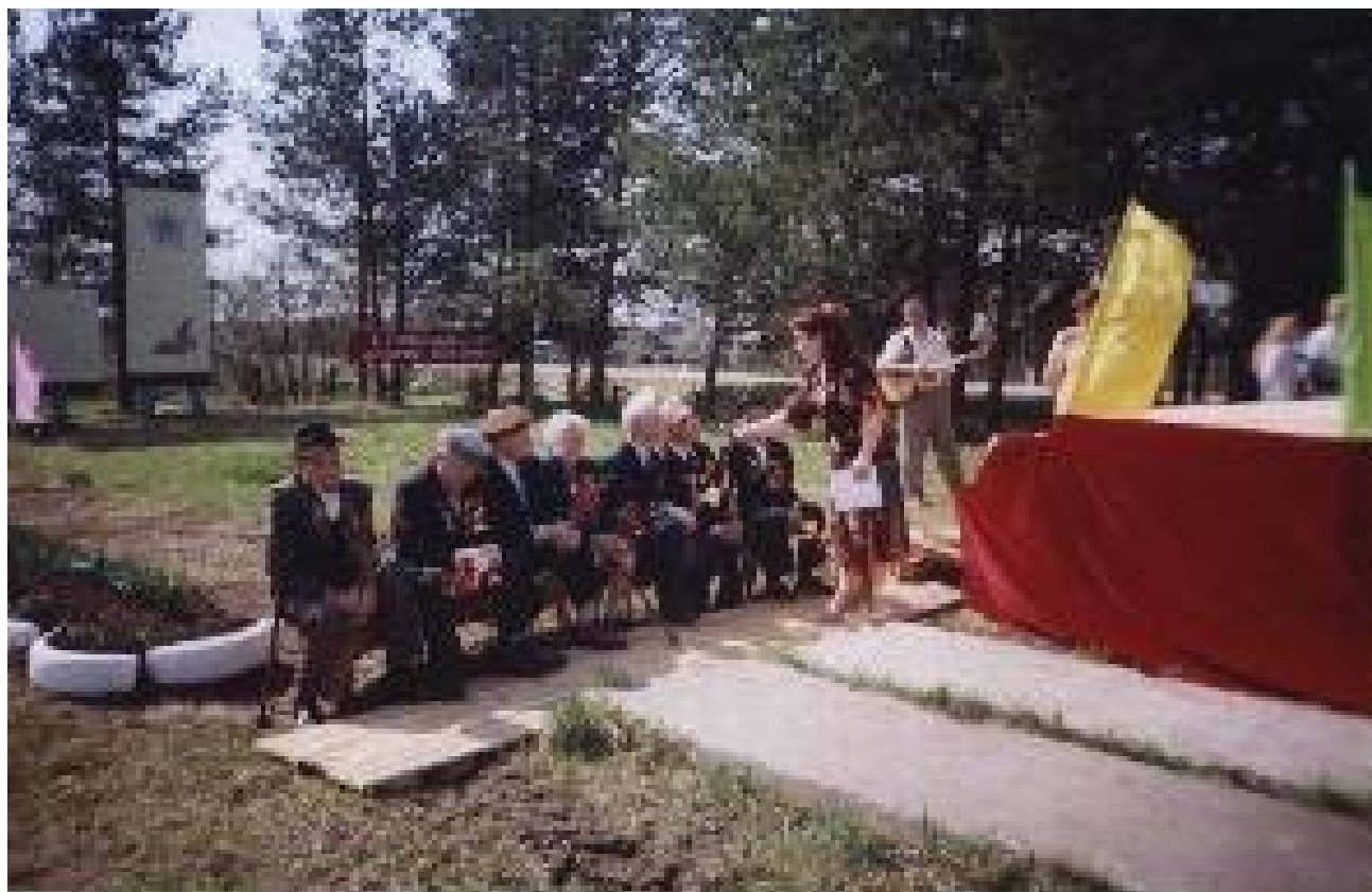
Интервью с ветеранами.