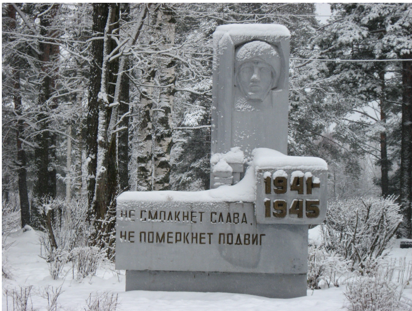
Памятник погибшим землякам пос.Ветлужский, установленный к 60-летию Победы в ВОВ.