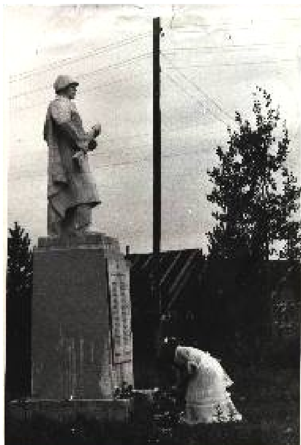
Возложение цветов молодоженами в день регистрации брака.