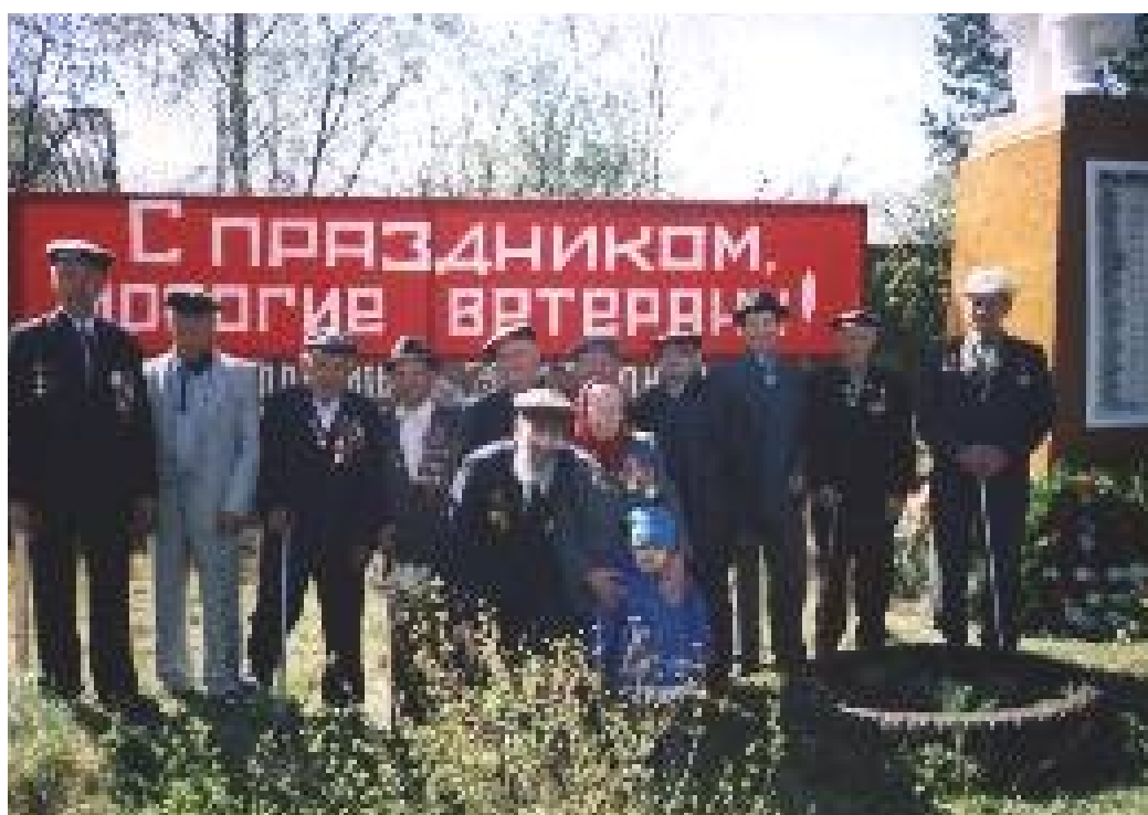
Ветераны войны на митинге.