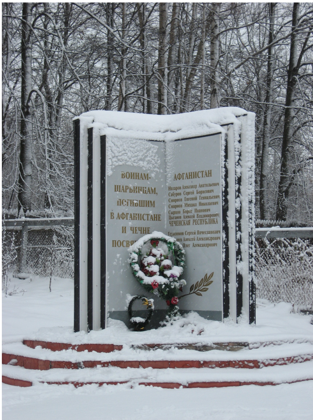
Гранитная книга памяти, посвященная памяти воинам-шарьинцам погибшим в Афганистане и Чечне.