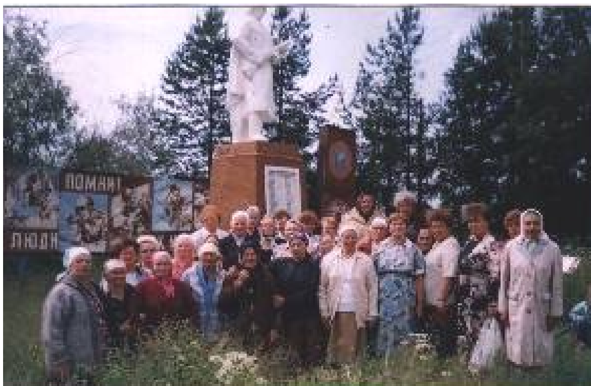
Встреча у памятника Зебляковских вдов.