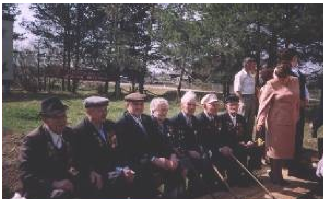
Ветераны войны на митинге.