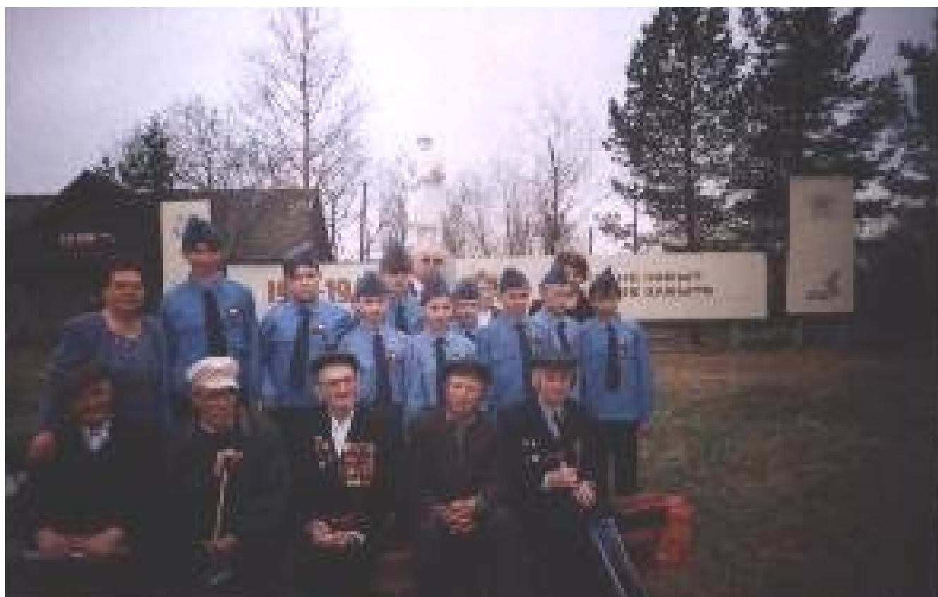
Тимуровцы приветствуют ветеранов войны.