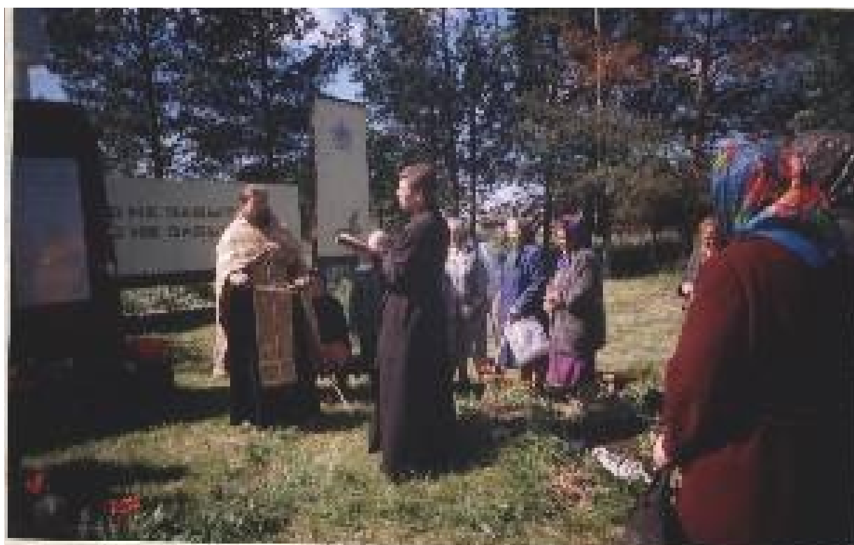
Панихида у памятника погибшим воинам.