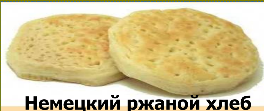
Немецкий ржаной хлеб dreikornbrot