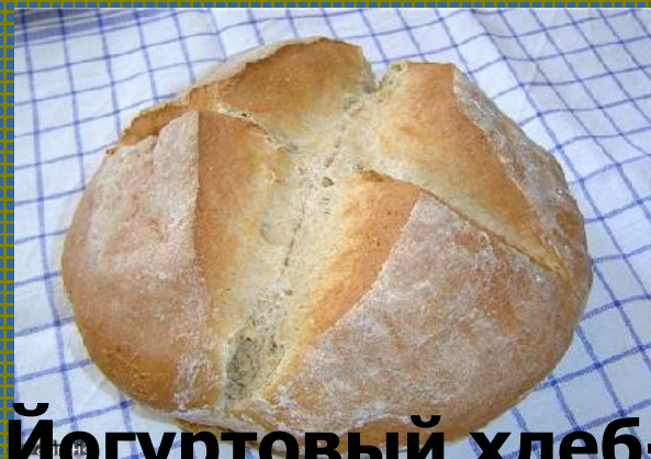
Йогуртовый хлеб- Joghurtbrot.