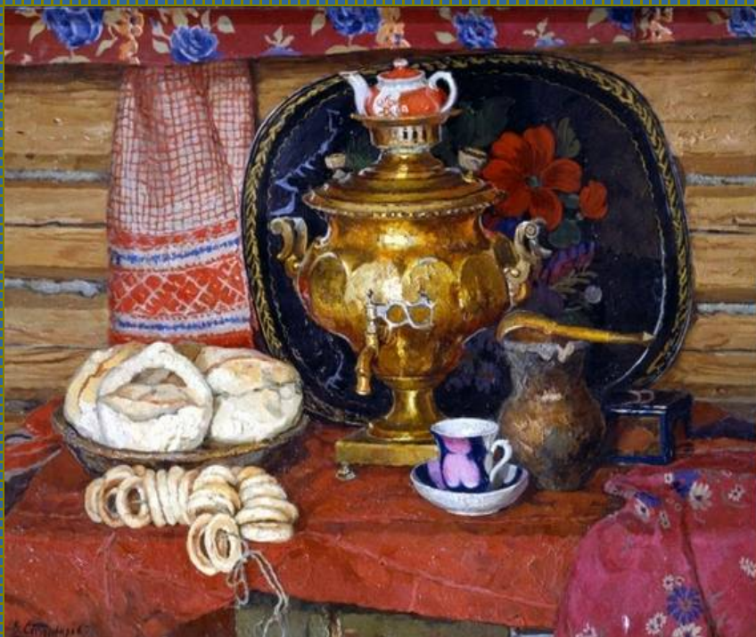
Стожаров В. Ф. "Чай с калачами"