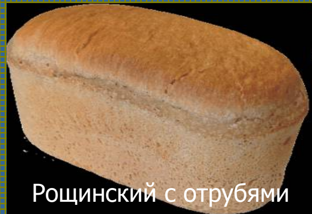
Рощинский с отрубями