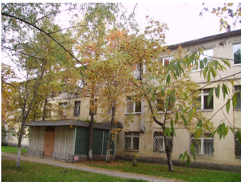
Дом № 14 по улице Комаровского (ныне – туберкулезный диспансер)