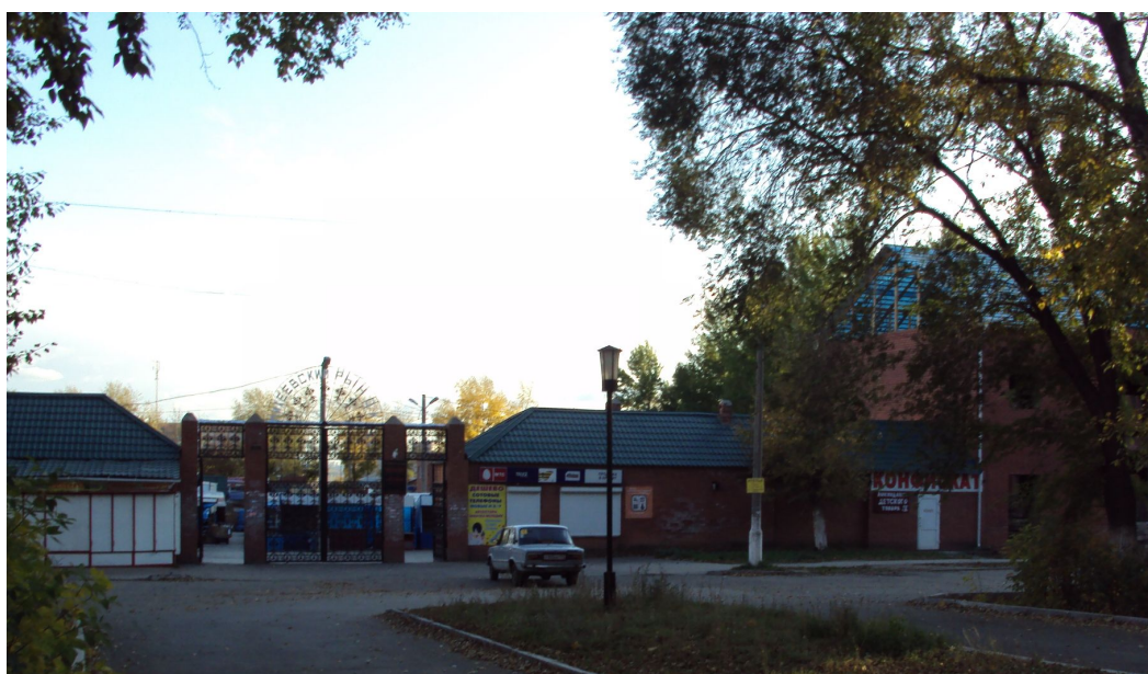
Территория стройотряда № 7 (сегодня - рынок «Мехеевский»)