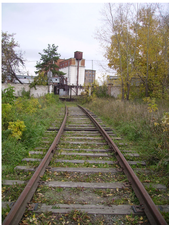
Мельничный тупик (мельзавод «Победа»)