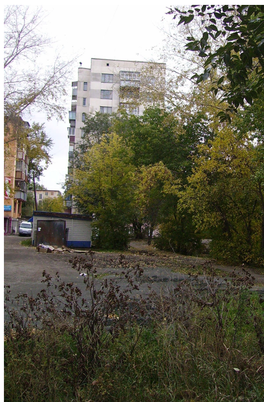
Дома на месте бывшей узкоколейки в районе улицы Черкасская (ул. Черкасская 2-А, Шоссе Metallургов 35-Б)