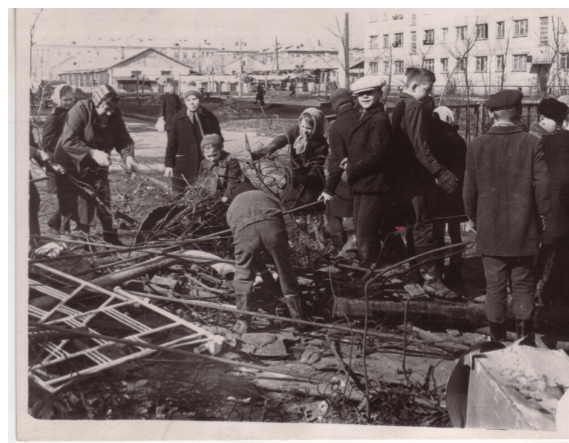
Сбор металлолом в школе № 74. На заднем плане видны бараки (фото конца 60-х годов)