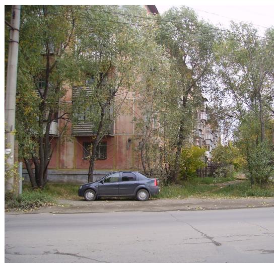
Вахта и дорога лагеря стройотряда № 6 (ул. П.Калмыкова 8)