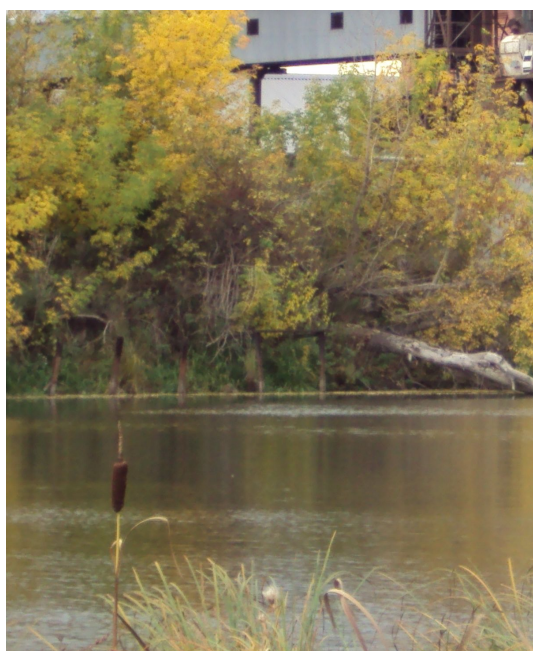
Опоры бывшего моста (на стороне Мельничного тупика)