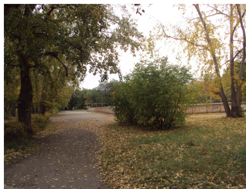
Лагерный плац (школьный двор МОУ № 42)