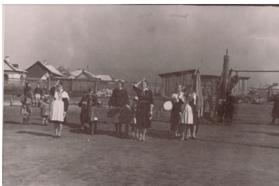
Праздничные мероприятия школы № 74 на бывшем лагерном плацу (фото конца 60-х годов)