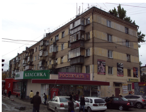
Дом № 1 на ул. Комаровского