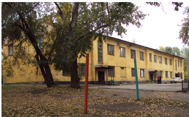
Управление БАКАЛстроя и БАКАЛЛАГА (ул. Комаровского 13-А)