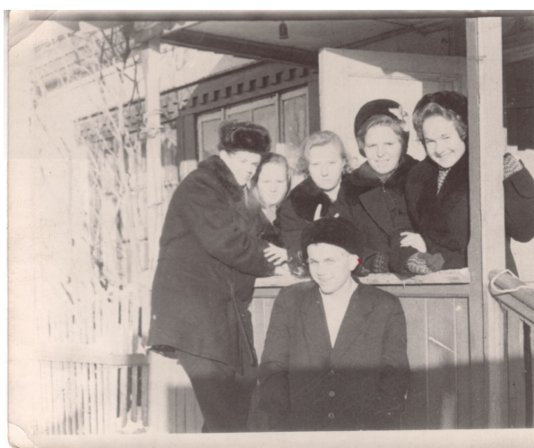
Крайнее крыльцо барака поселка Бакал. Сегодня – ул. Комаровского 1 (фото конца 50-х годов)