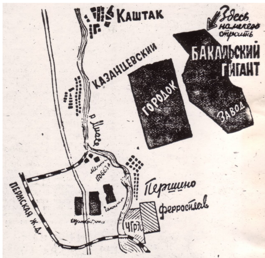
Карта-схема планируемой территории городка Бакальского металлургического завода. 1931г.