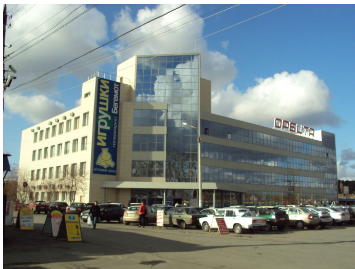
Территория стройотряда № 2 (торговый комплекс «Орбита»)