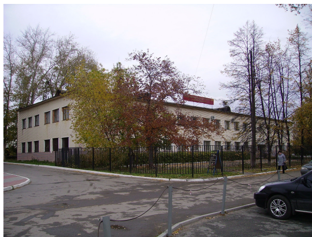
Неполно-средняя школа № 29, ул. Черкасская 1-А (сегодня – Областной центр технического творчества профтехобразования)