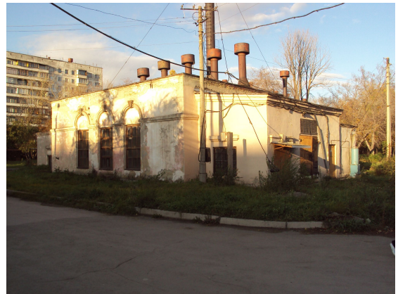
Барачные постройки на месте отдельной зоны лагеря стройотряда № 6 (сегодня – больничный городок ЧГМА)