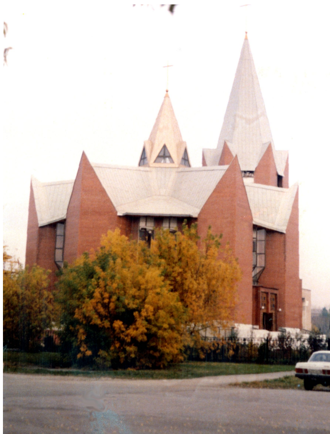
Территория лагеря стройотряда № 1