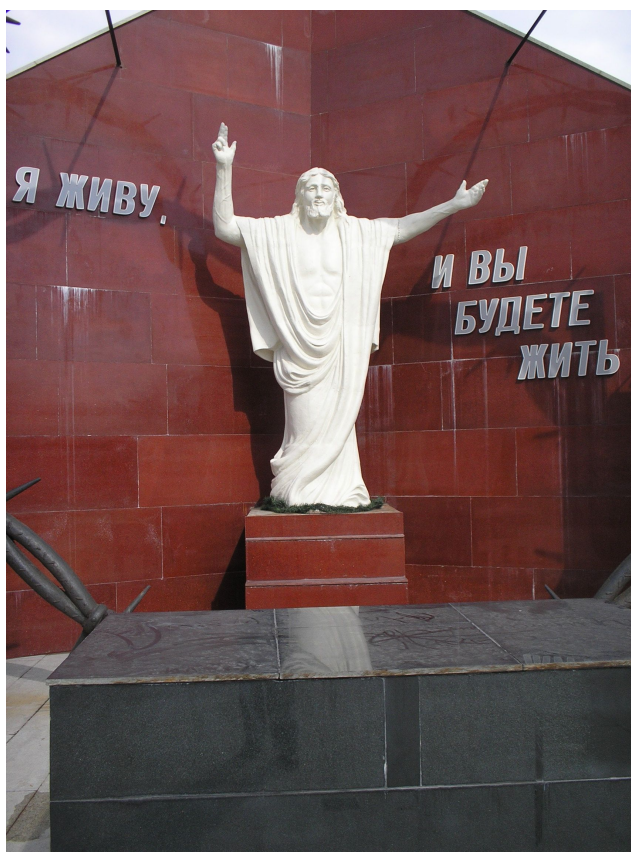
Памятник трудармейцам на территории Католического костела