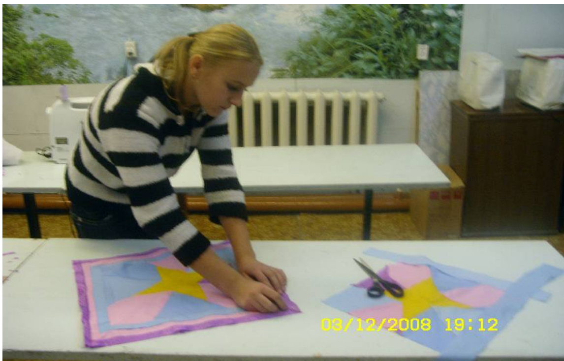
Готовый комплект в действии