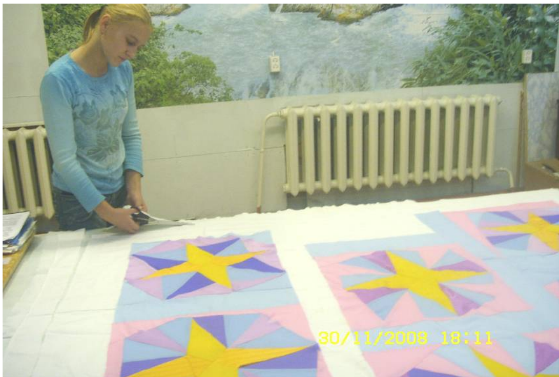
Готовое лоскутное одеяло