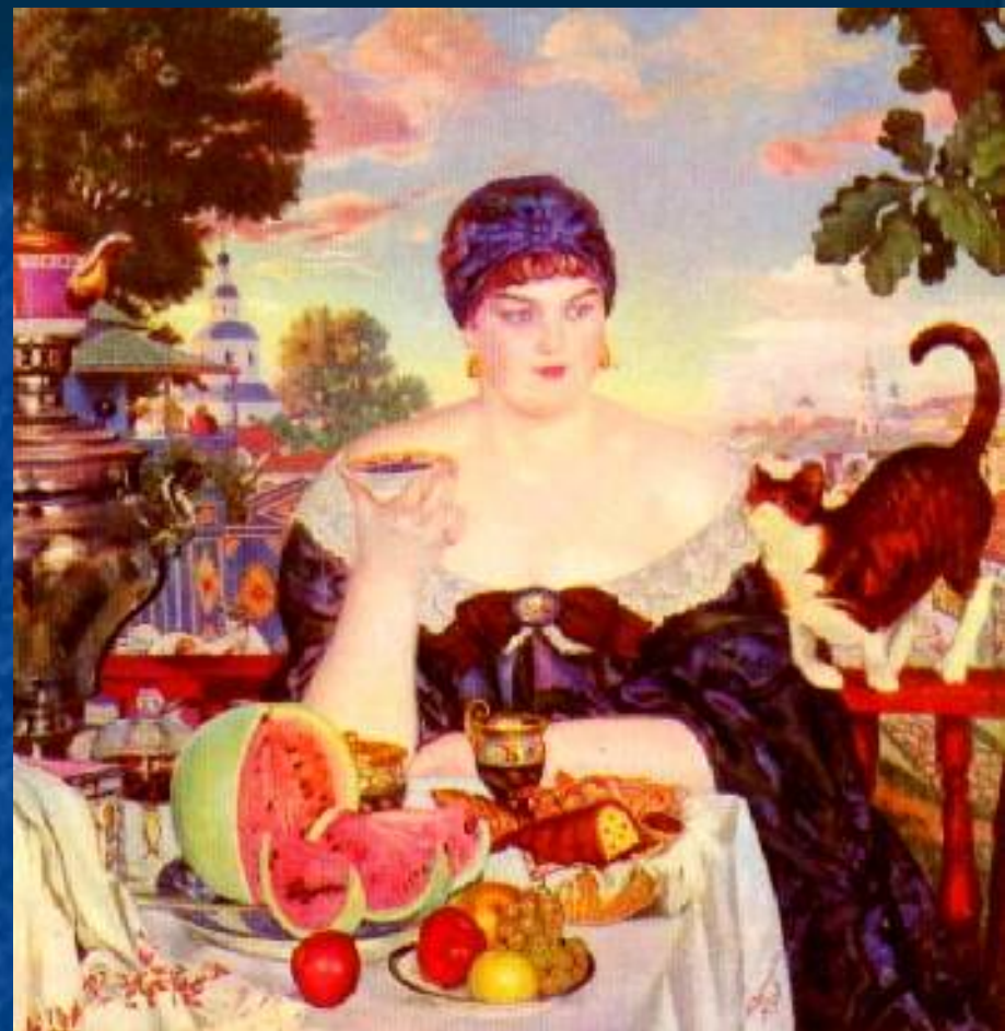
Зинаида Серебрякова. Автопортрет. 1909 Борис Кустодиев «Купчиха за чаем» 1918 ГТГ