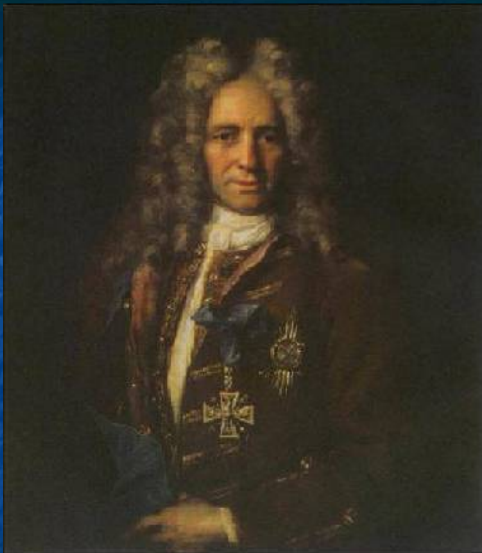
Иван Никитин. Канцлер Головкин 1720 ГТГ