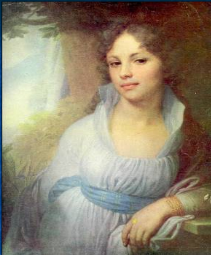
Владимир Боровиковский. Мария Лопухина. 1797 ГГ