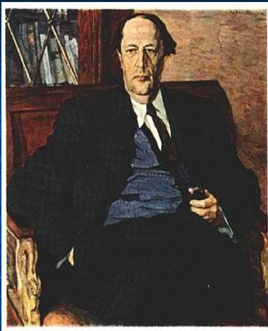
Павел Корин. Портрет писателя Алексея Толстой 1940