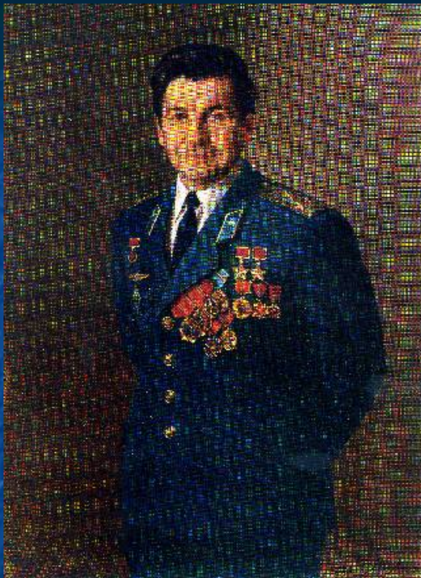
А.Шилов. Портрет Героя Советского Союза летчика-космонавта Ковальчука Н. И. 1981