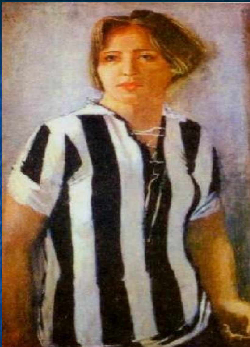
Александр Самохвалов. Девушка в футболке 1932 ГРМ