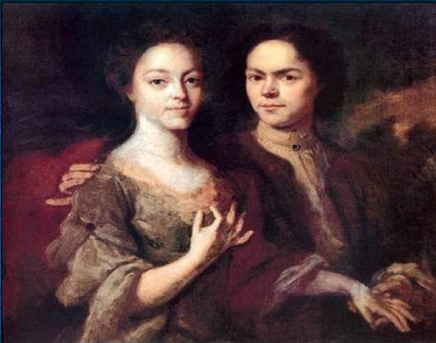
Андрей Матвеев. Автопортрет с женой. 1729 ГРМ