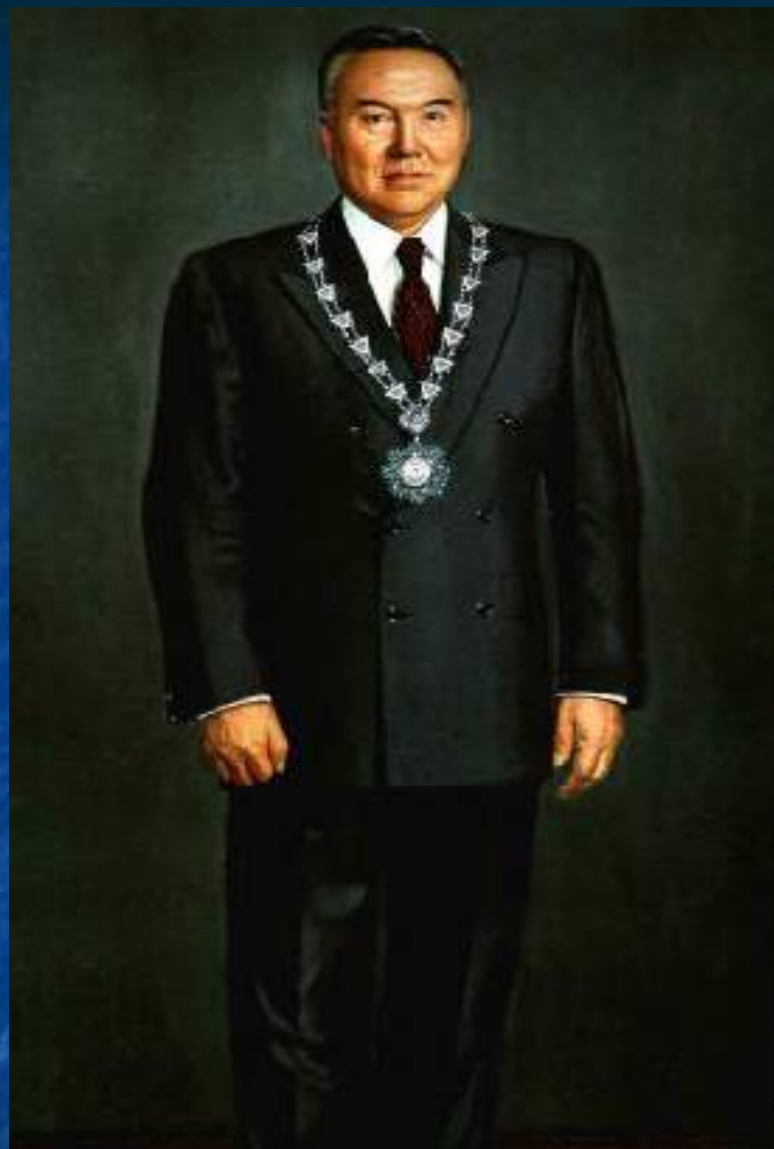
Илья Глазунов. Портрет Президента Республики Казахстан Нурсултана Назарбаева 1990