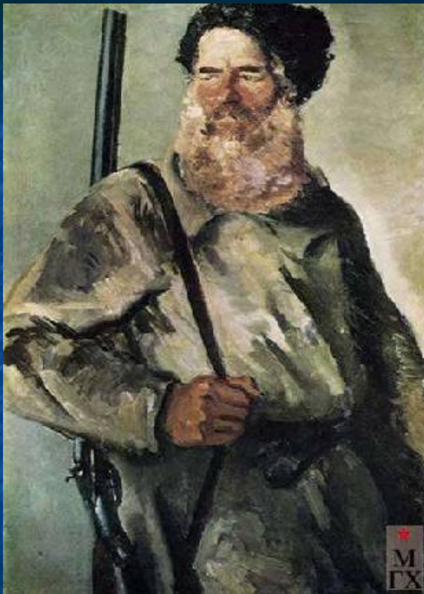
Сергей Герасимов. Колхозный сторож 1937. ГРМ