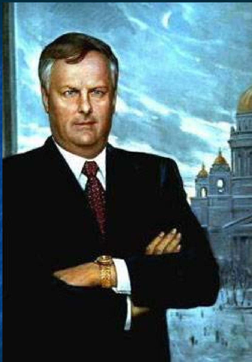
Илья Глазунов. Портрет Анатолия Собчака 1995