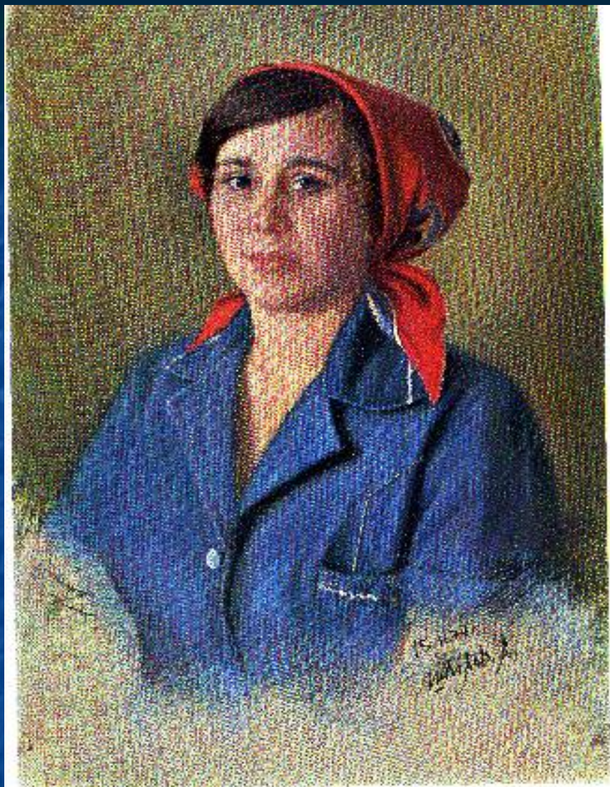
Александр Шилов. Портрет Героя Социалистического труда В. И. Голубкиной