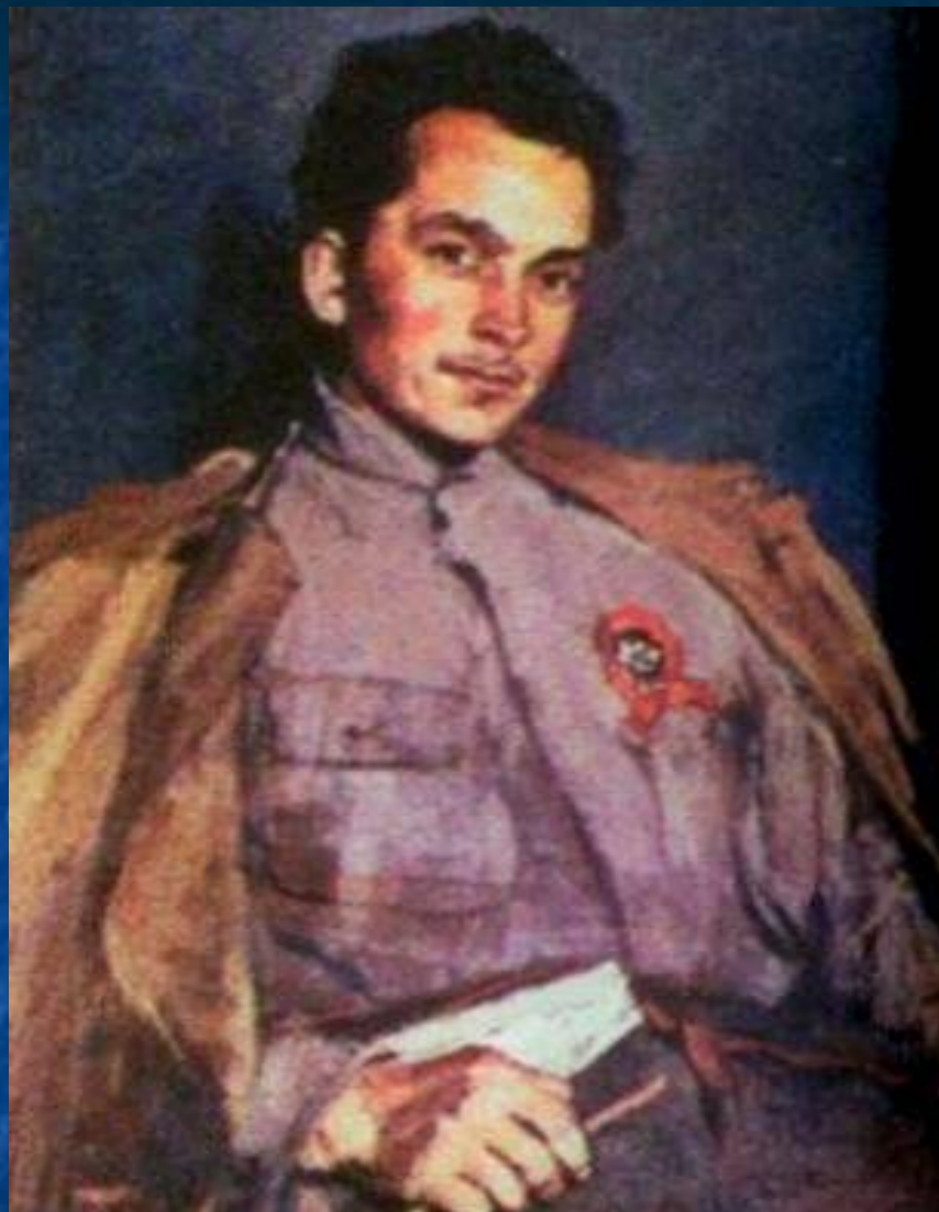
Сергей Малютин. Портрет писателя Дмитрия Фурманова 1922 ГТГ