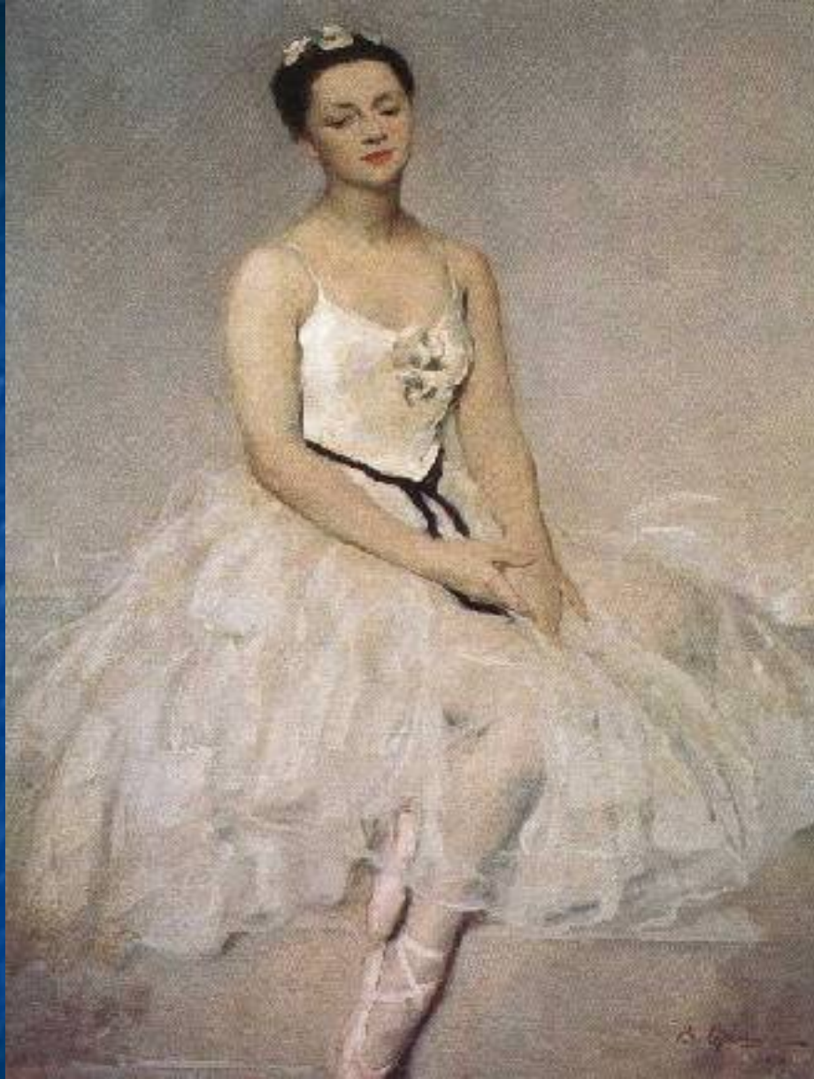
Виктор Орешников. Портрет балерины Аллы Шелест. 1949 ГРМ