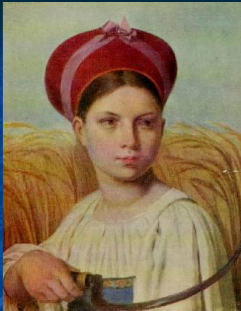
Алексей Венецианов. Жница 1820 ГРМ