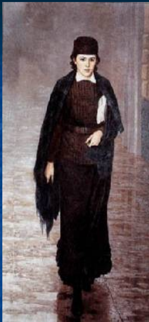
Николай Ярошенко. Курсистка 1883 ГТГ