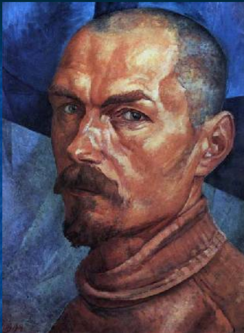
Кузьма Петров-Водкин. Автопортрет 1920 ГРМ