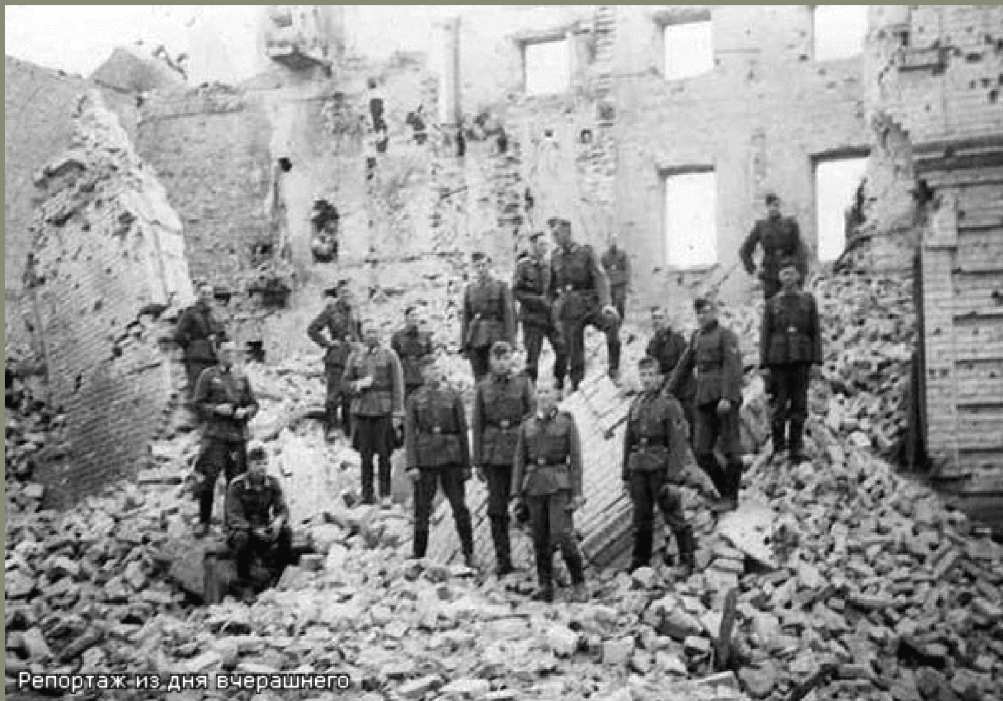
Репортаж из дня вчерашнего