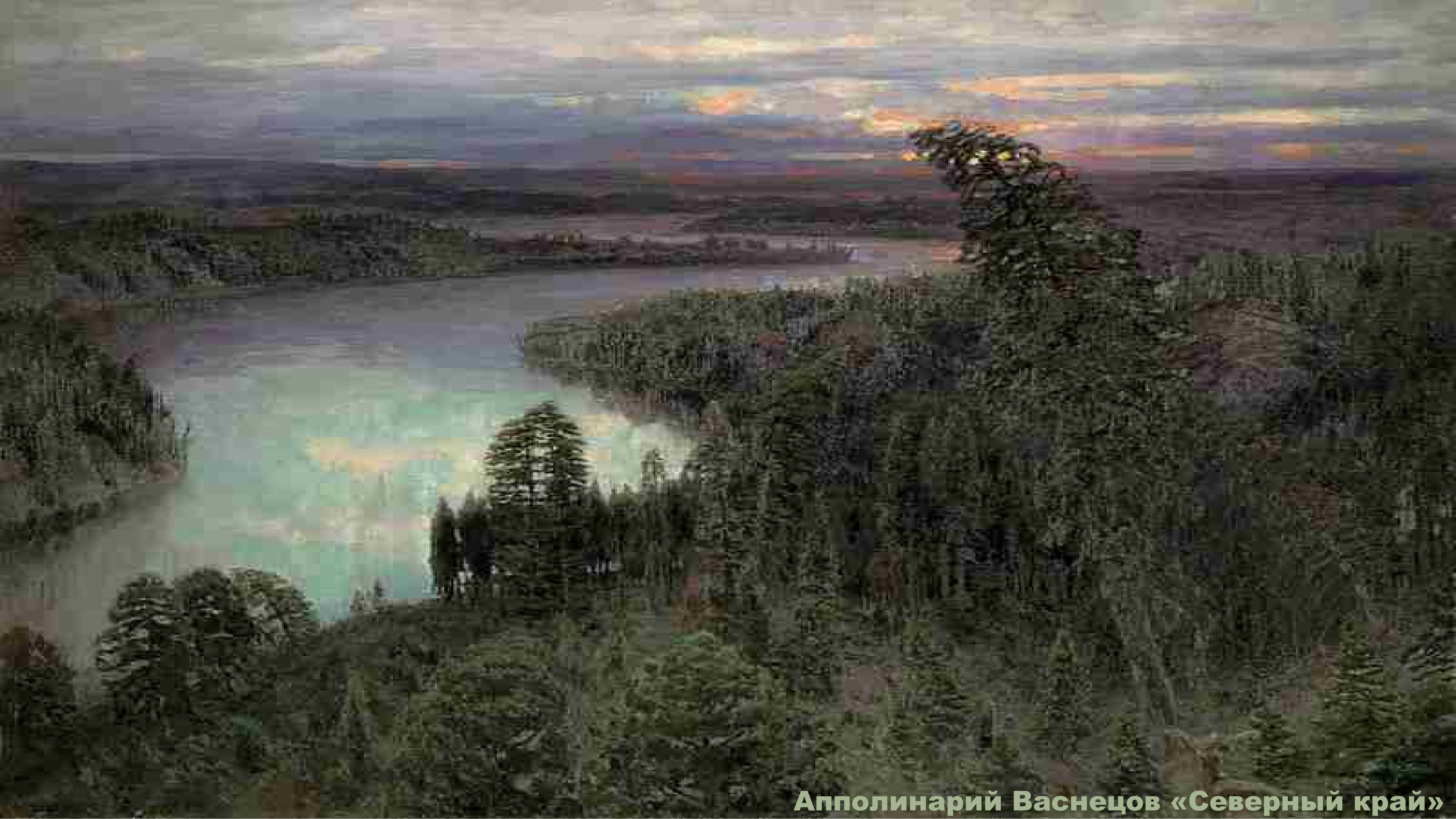
Апполинарий Васнецов «Северный край»