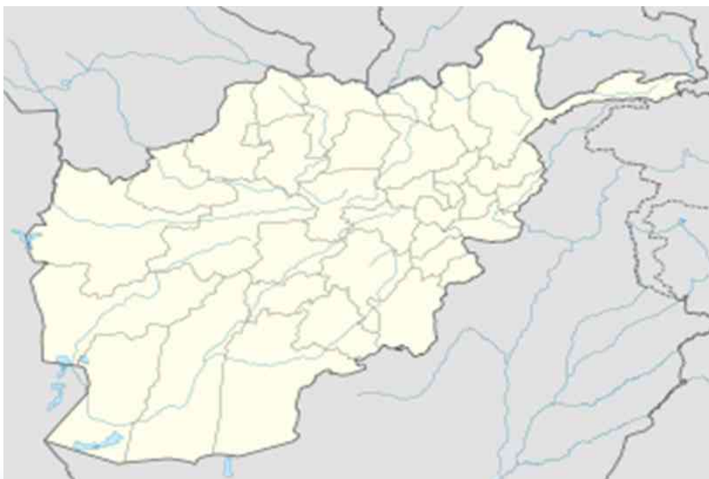
ПРИЛОЖЕНИЕ № 11