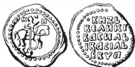
Монета чеканки XV века. На лицевой стороне монеты символы утверждают, что это князь. На обратной стороне "Князь Великий Василий Васильевич".

Рубль состоял из 100 копеек, или 200 денег, или 400 полушек.